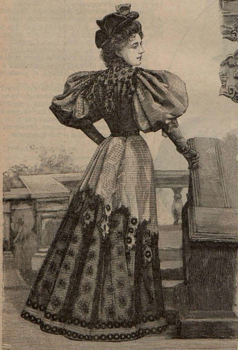
Núm. 12.—Traje para visita.

A estas cualidades reúne la prenda que me ocupa, la de poder ser confeccionada en breves instantes sin necesidad de