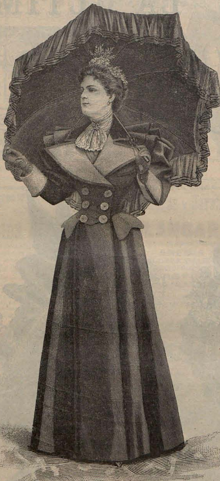
Núm. 3.—Traje para paseo matinal.