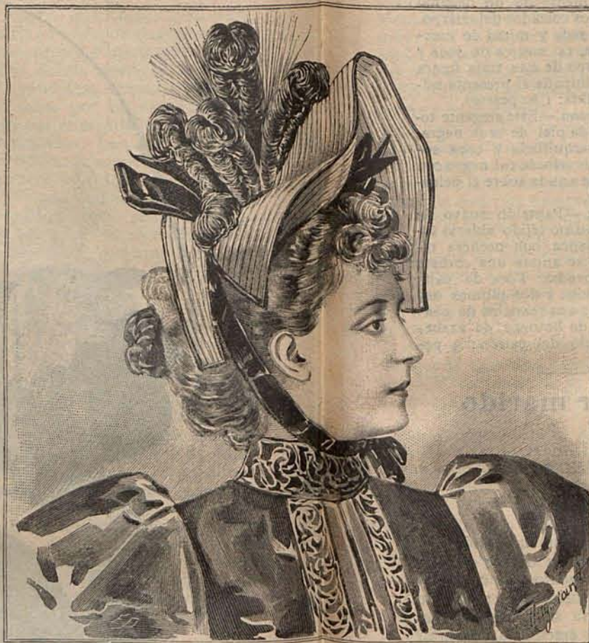
Núm. 14.—Sombrero PALMIRA.

Reconozco que estos sombreros pueden ser considerados como la última palabra de la elegancia; pero también creo que son de muy difícil adaptación, pues resultan favorables á contadísimos tipos.