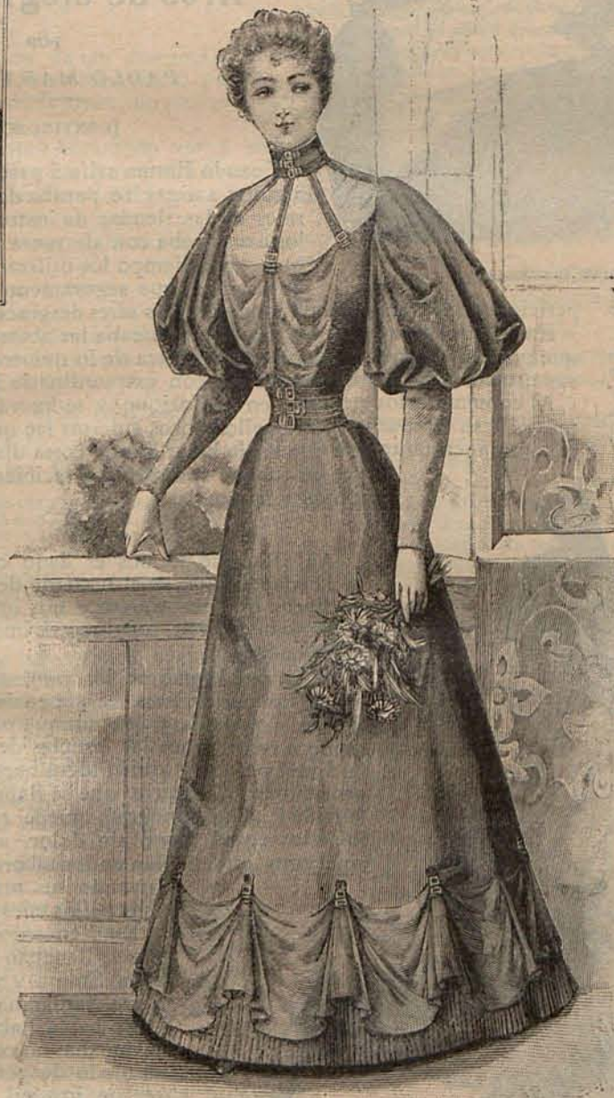
Núm. 17.—Traje para campo.

dea con un galón labrado de lana verde mirto. Blusa fruncida, con aldeta galoneada. Mangas lisas, con segundas mangas forma pantalla, guarnecidas con galones labrados. Tela necesaria para este traje, 7 metros de sarga, doble ancho. Precio del patrón: 3 pesetas.