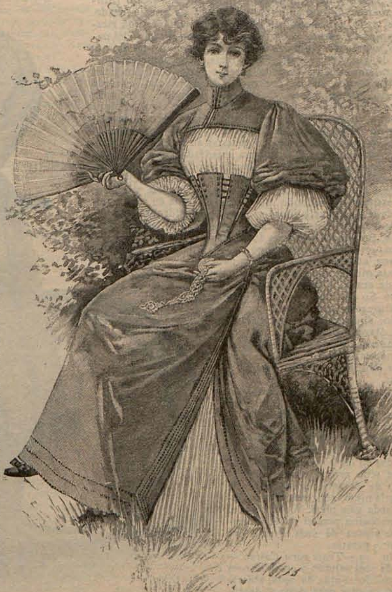
Núm. 19.—Traje para Casino

Núm. 9.— Traje de playa para señorita. —Es de batista azul porcelana.