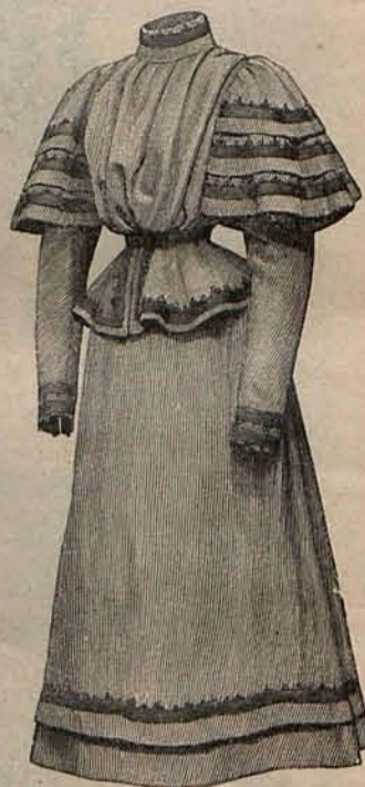
Núm. 4.—Traje para viaje.