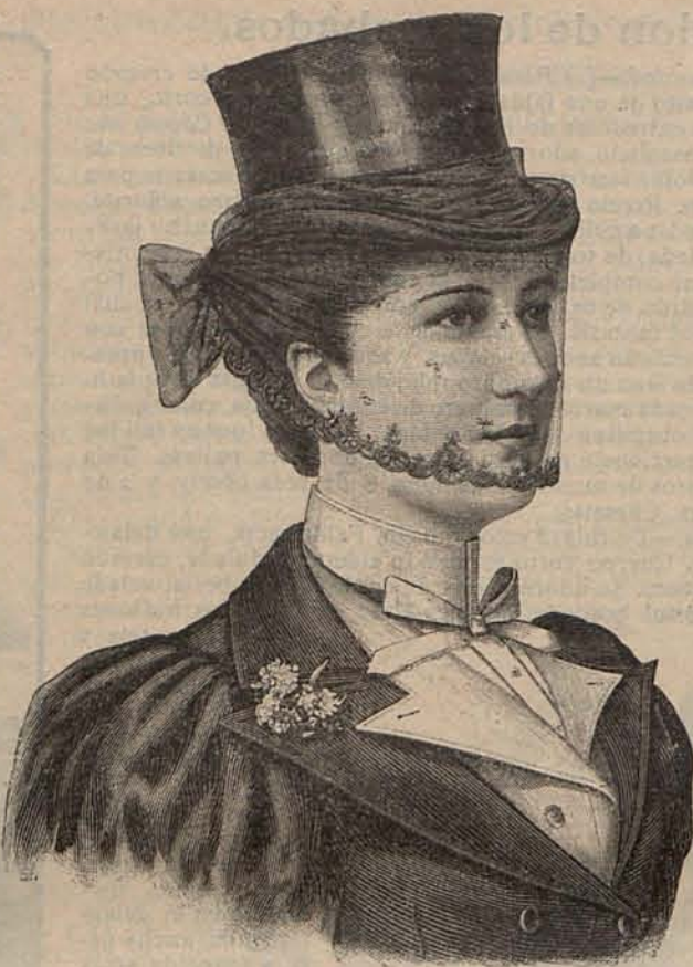
Núm. 20.—Tocado de amazona.

Núm. 19.— Traje para Casino .—De seda rosa salmón y crespón rosa muy pálido. Falda de seda, abierta en los costados para dejar al descubierto dos quillas de crespón plegado afectando forma cónica. Cuerpo de seda, velado en parte por una ca-