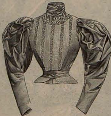
Núm. 6.—Blusa para campo.