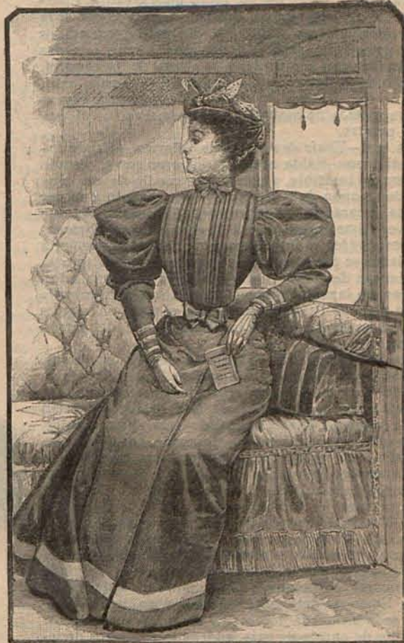
Núm. 18.—Traje para viaje.

Núm. 4.— Traje para viaje. —De sarga gris de lino. Falda recta. El bajo se ro-