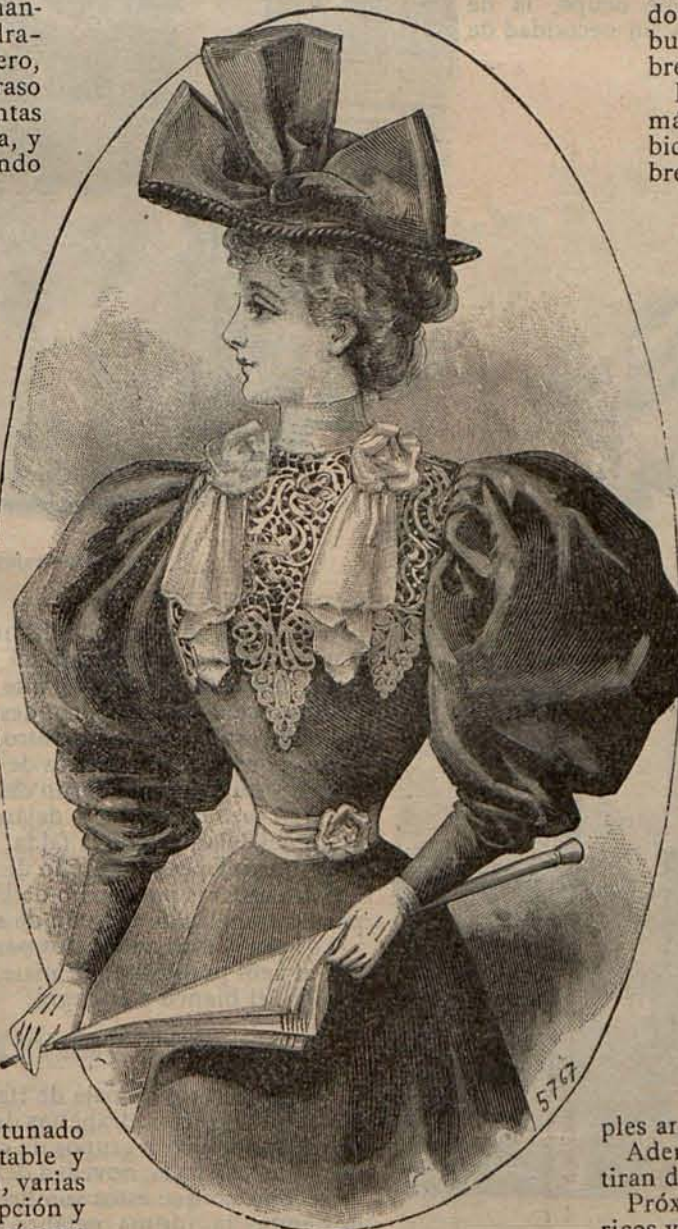
Núm. 10.—Traje de visita para señorita.

Próximamente publicaremos un modelo de los más ricos y elegantes en su clase; pues juzgamos que las señoras que no puedan visitar las playas entonadas, ten-