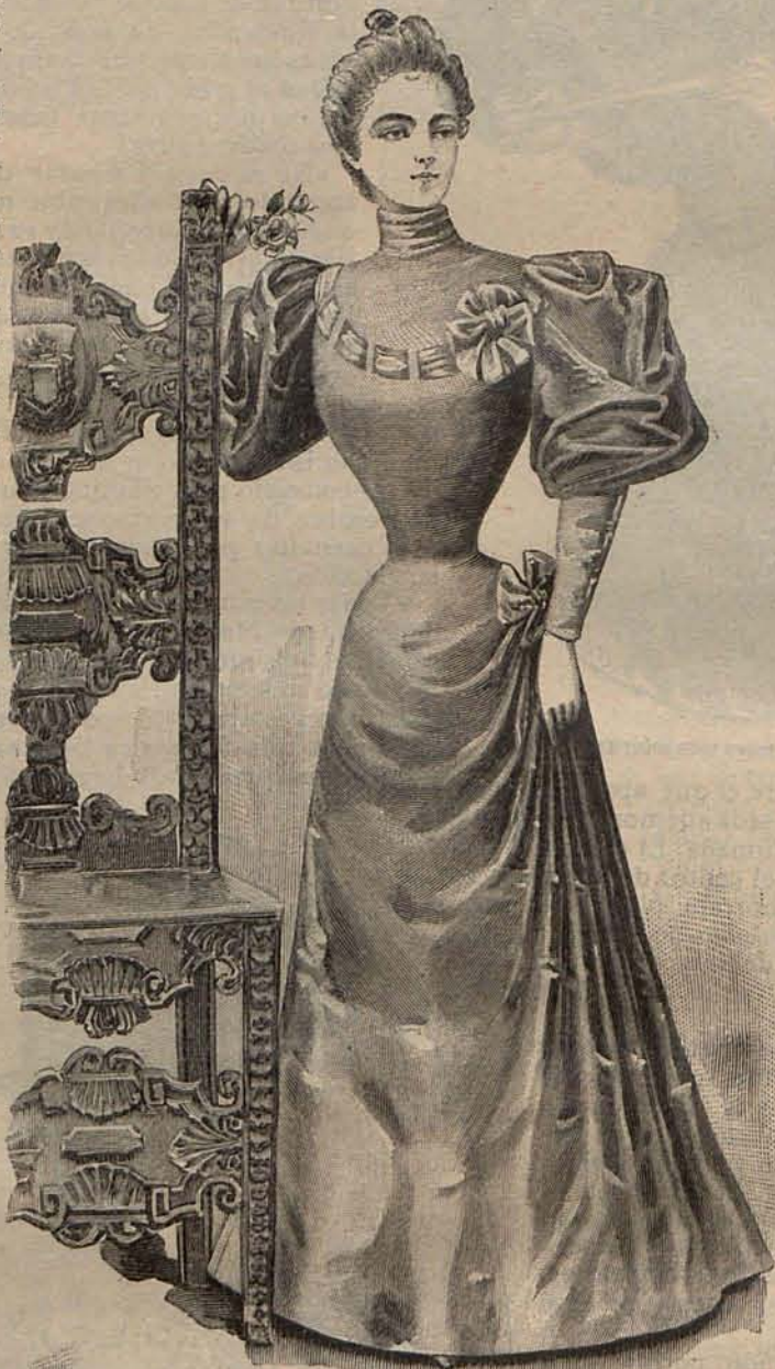
Núm. 13.—Traje para paseo.

patrón; pues se compone de una tira de crespón de lana ó seda del ancho natural del tejido por tres metros de larga, bordeada de un volante de encaje ó tul bordado. Esta tira se dobla un poco desmentida, de modo que un volante resulte encima de otro, sosteniéndola en dicha posición por medio de lacitos de tres cocas de cinta blanca ó negra; y se coloca en torno del cuello prendiéndola con un gran lazo de cinta, y dejando caer sus extremos á lo largo del delantero de la falda, ó bien cruzando los extremos sobre el pecho á modo de fichú y sosteniéndolos sobre las caderas por medio de broches imperdibles ocultos por escarapelas de crespón de seda.