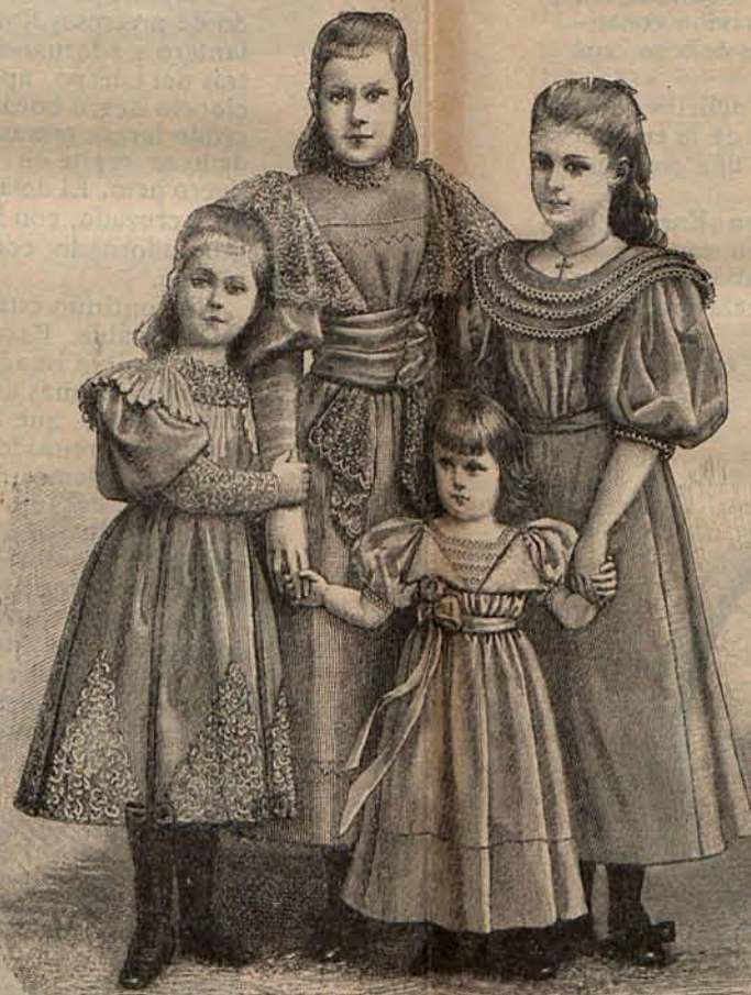
Núm. 16.—Trajes para niñas de 2 á 10 años.