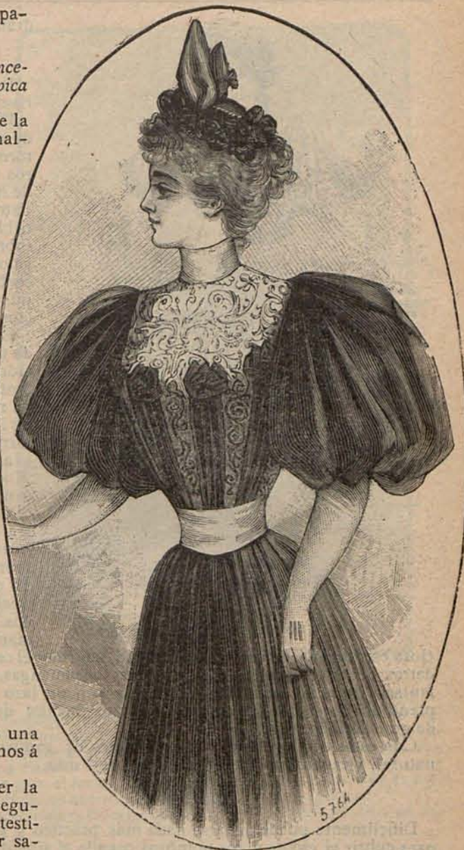
Núm. 9.—Traje de playa para señorita.

«Todas las mujeres de Francia al saber la desgracia de Mad. Carnot, han sentido seguramente vivísimos deseos de ofrecerla un testimonio de su simpatía: pues bien; para dar satisfacción á este noble deseo y para que la caridad pueda transformar en lágrimas de amor y gratitud las que hemos derramado poseídas de