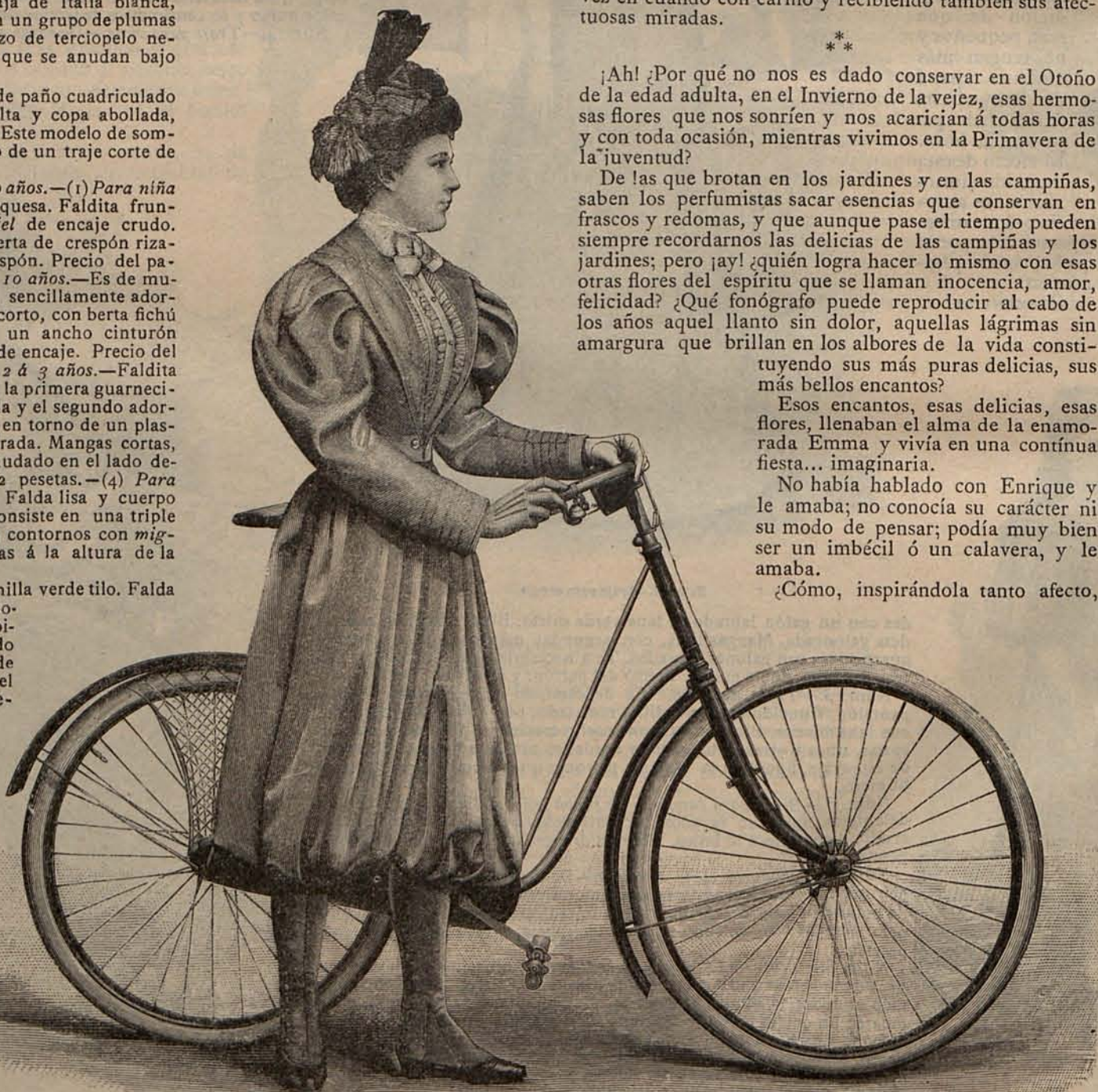
Núm. 21.—Traje para ciclista.

miseta de crespón ajustada por medio de un original corselete de seda que parte de los costados del cuerpo. Mangas muy huecas, mitad de seda y mitad de crespón. Tela necesaria para el traje, 14 metros de seda y 6 de crespón. El patrón del cuerpo de este traje figura en la Hoja de patrones que acompaña al presente número. Precio del patrón de la falda: 1,50 pesetas.