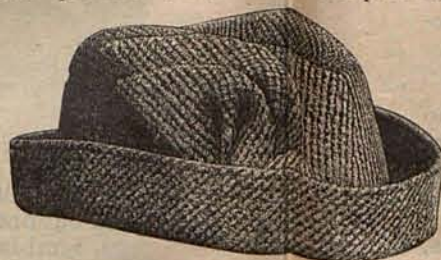
Núm. 15.—Sombrero para viaje.