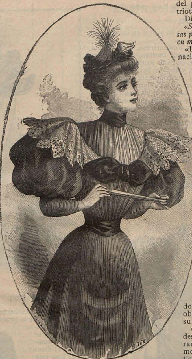
Núm. 8.—Traje de paseo para señorita.

da con volante bordado, sobre el que aparecen ligeros bullones de muselina de seda anémona. La manga, semi-larga, también abullonada. El cuerpo, drapeado en los hombros y en el centro del delantero, deja al descubierto una chorrera plana de raso anémona, figurando dos V orladas de encaje. Cintas de raso anémona dibujan el delantero de la falda, y están adheridas á la cintura por cocas, terminando en el bajo en elegantes lazos.