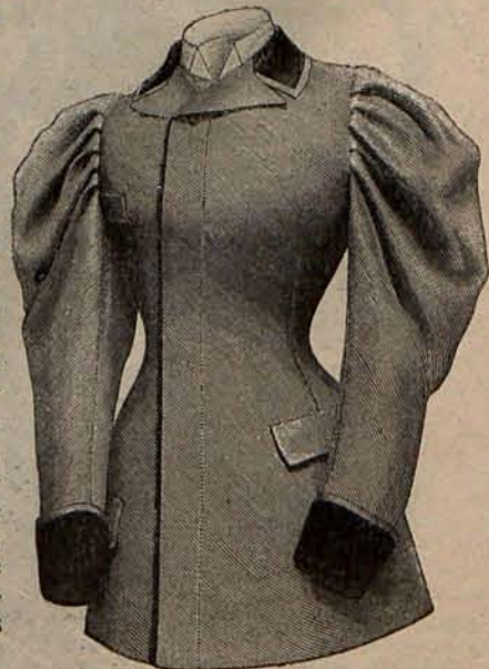
Núm. 7.—Chaqueta corte de sastre.