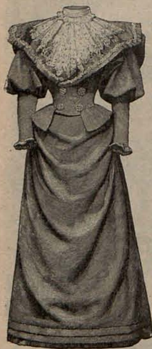
Núm. 2.—Traje para visita.