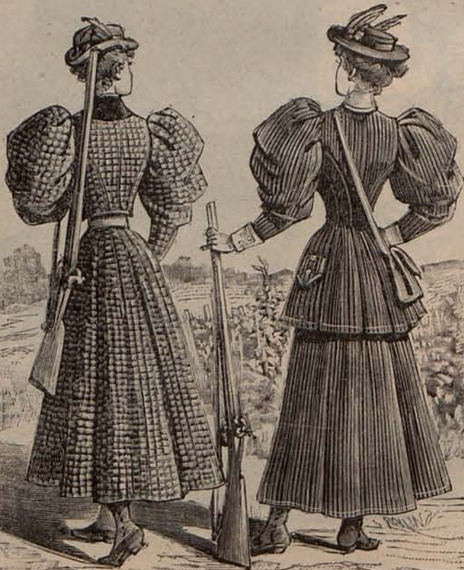
Núm. 13.—Reverso del Figurín acuarela.

El joven ingeniero, por el contrario, sentía cada