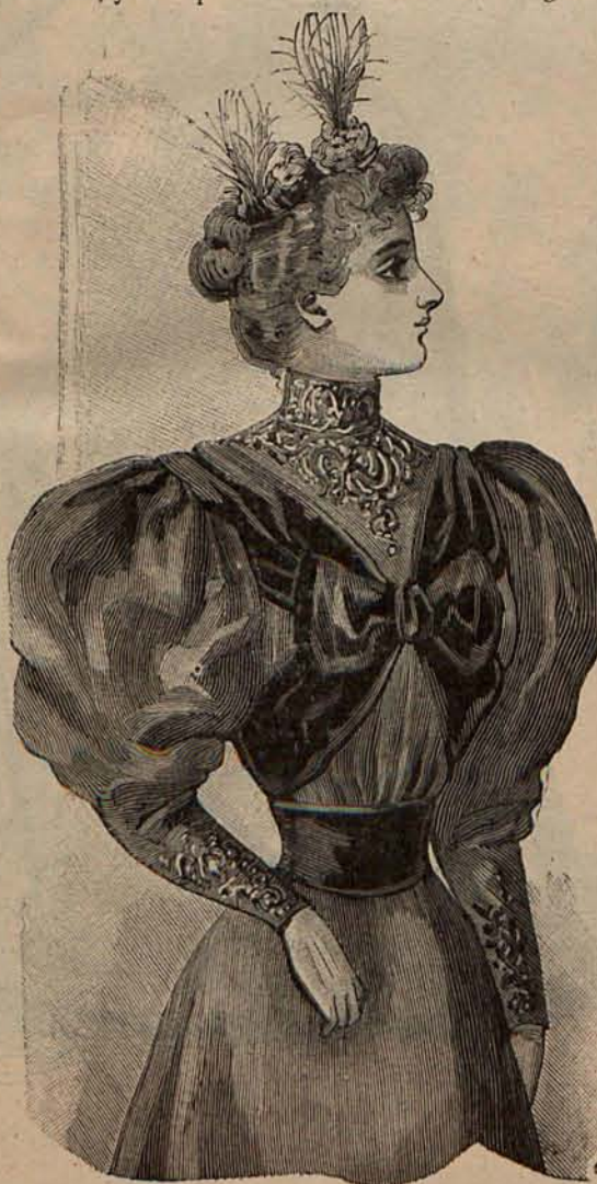
Núm. 7.—Traje para calle.

Núm. 7.—TRAJE PARA CALLE.—De lanilla color cobre. Falda recta. Cuerpo fruncido, con cuello y canesú de pasamanería de seda negra. De los hombros salen dos anchas caídas de terciopelo negro, que después de fijarse en el centro del pecho con un lazo de lo mismo, pasan por debajo de los brazos y dan vuelta al talle en forma de cinturón. Mangas de pernil, con bocamangas bordadas de pasamanería. Sombrero de paja, color cobre, adornado con plumas. Tela necesaria