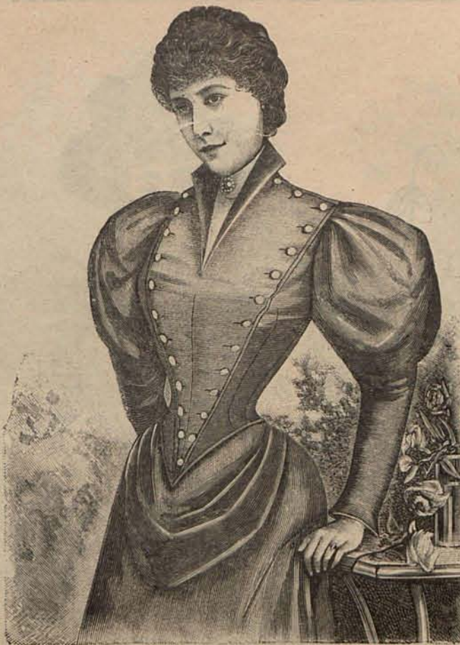
Núm. 6 — Cuerpo para traje de amazona.

Una preciosa innovación se advierte en la manera de cerrar los cuerpos de los trajes de vestir, de muy lindo efecto