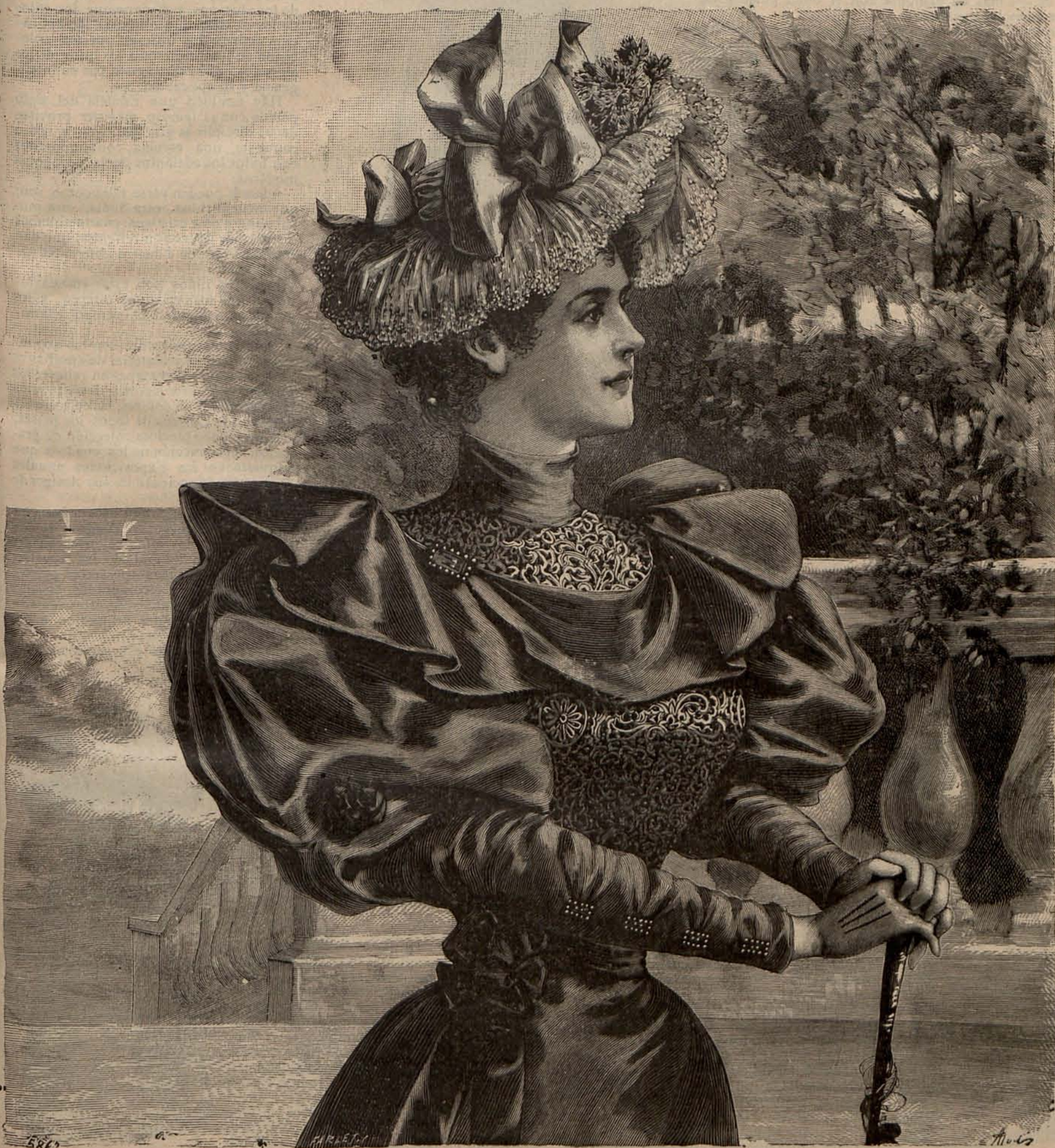
Núm. 1.—Traje para paseo.