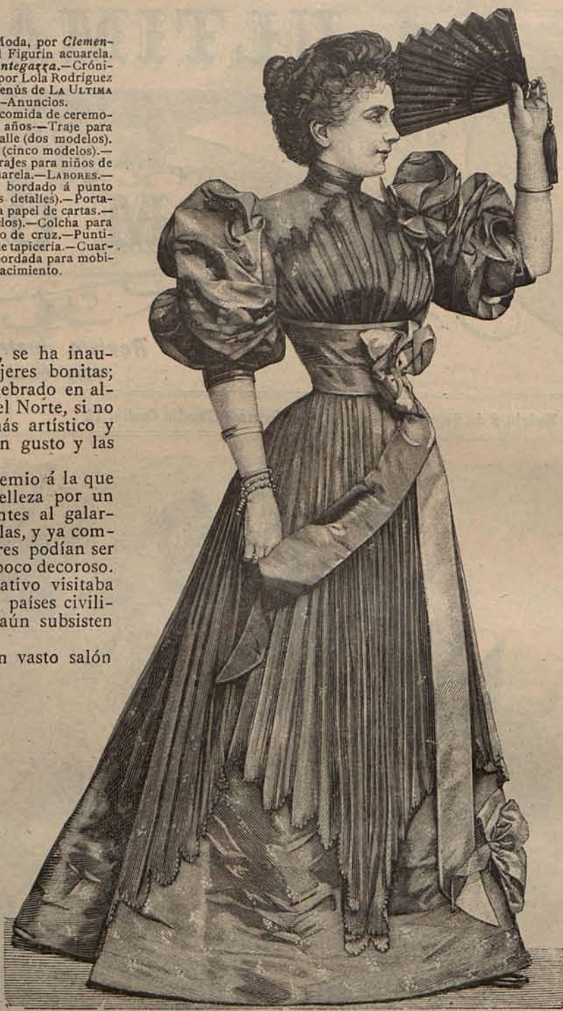
Núm. 2.—Traje para comida de ceremonia.

Otra Exposición no menos interesante y curiosa se está celebrando en París. Es el único atractivo que en estos momentos ofrece la capital de Francia; y cuando se visitan por las mañanas ó por las tardes los inmensos salones del Palacio de la Industria donde se halla instalada, se adquiere la convicción de que si falta esa animación exterior que las altas clases sociales dan á la gran ciudad, que parece en esta época más que oasis, desierto, nunca faltan ni parisienses ni extranjeros que contribu-