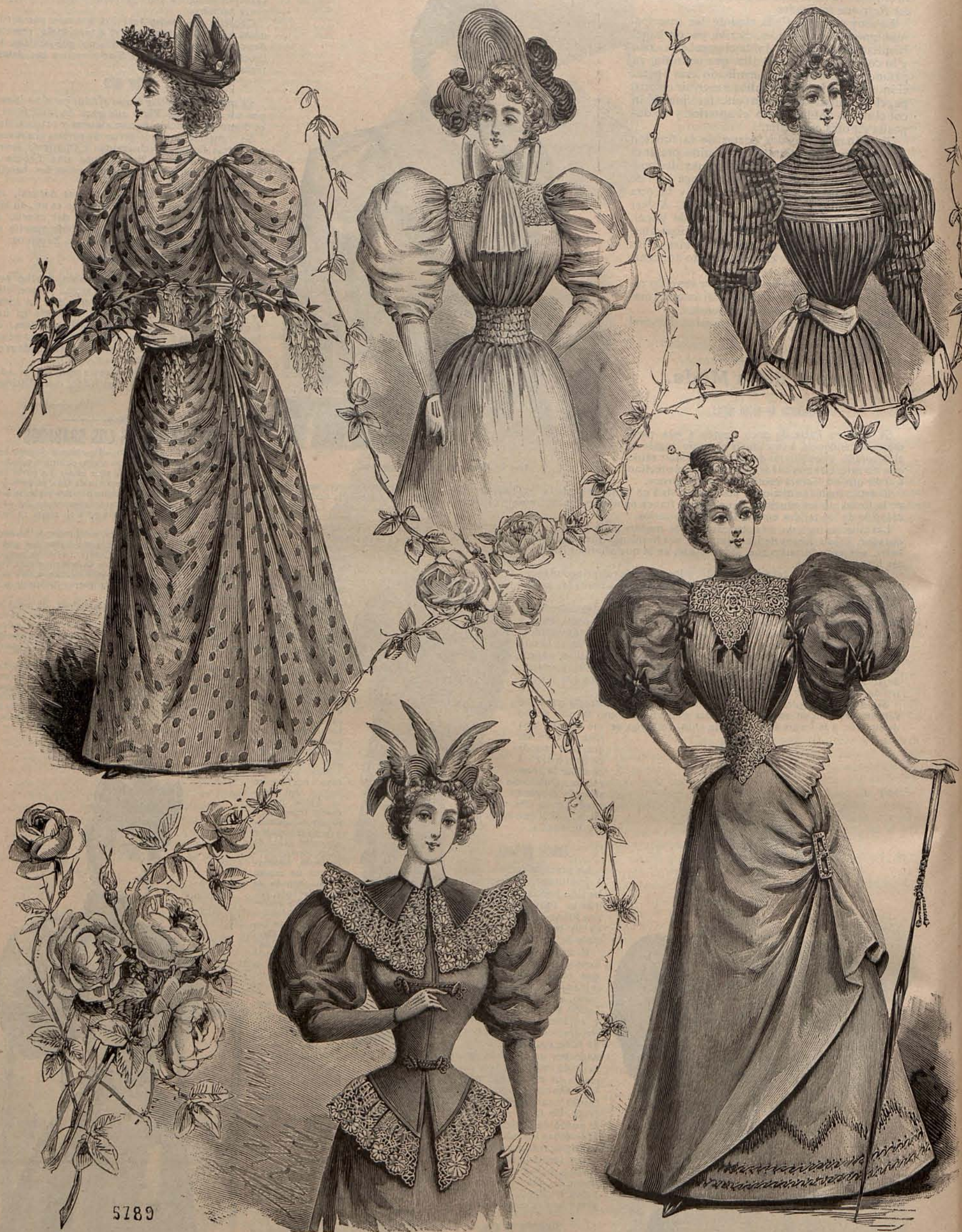
Núm. 10.—Toilettes alta novedad para visita.