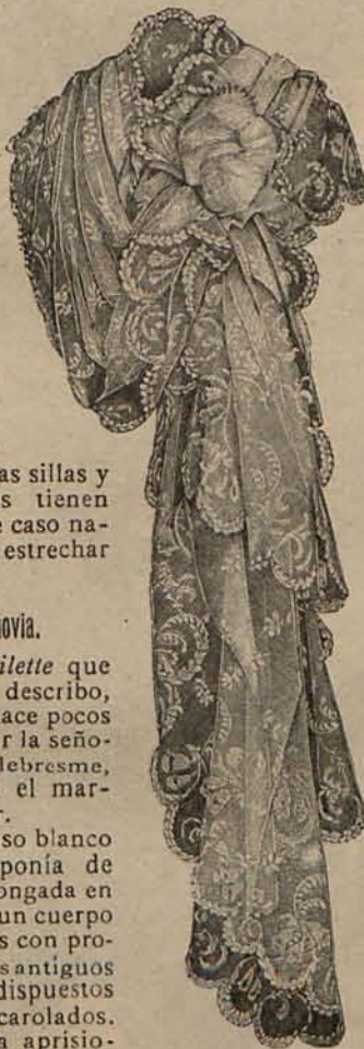
Núm. 8 — Fichú de encaje.

y que puede ser apreciada en el modelo representado por la figura 4 del grabado núm. 11 del presente número.