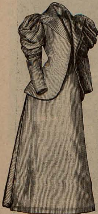
Núm. 3.—Traje corte de sastre.

Terminaré anunciando un nuevo entretenimiento que, para distraer el tiempo, goza de gran favor en las reuniones que se celebran en los castillos ó en las casas de campo. Los