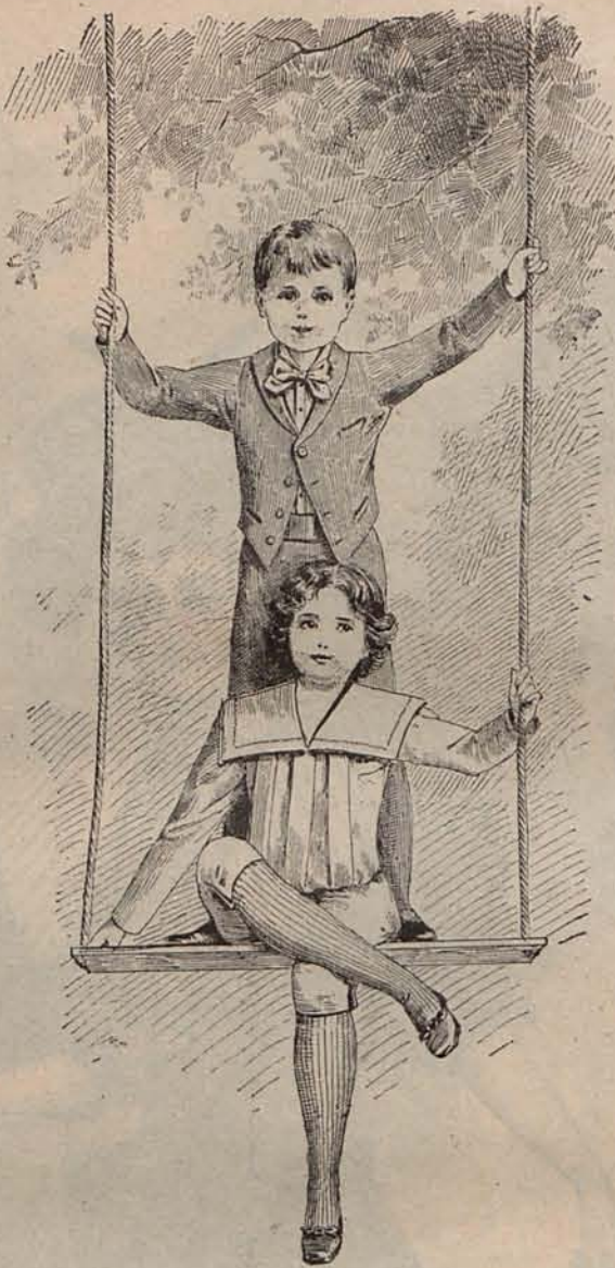
Núm. 12.—Trajes para niños de 5 á 7 años.

TRAJES DE CAZA.—Modelo 1.º.—Está confeccionado con paño juego de damas de tonos marrón y blanco. Falda semi-larga cerrada en el costado por botones de terciopelo marrón y montada en dobles pliegues. Chaquetilla con solapas y cuello vuelto, de terciopelo marrón guarnecida con filas de botones del mismo tejido. Los delanteros están sueltos sobre una camiseta de bengalina rosa ajustada por un cinturón de cuero. Mangas huecas, con puños de terciopelo. Sombrero de fieltro beige, adornado con un ala