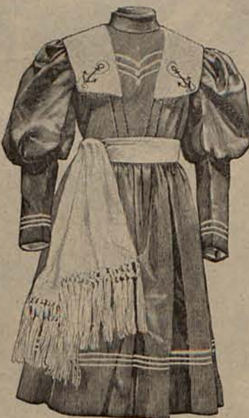
Núm. 4.—Traje para niño de 2 á 4 años