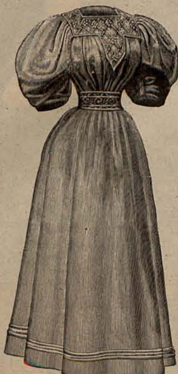
Núm. 5 Traje para playa.