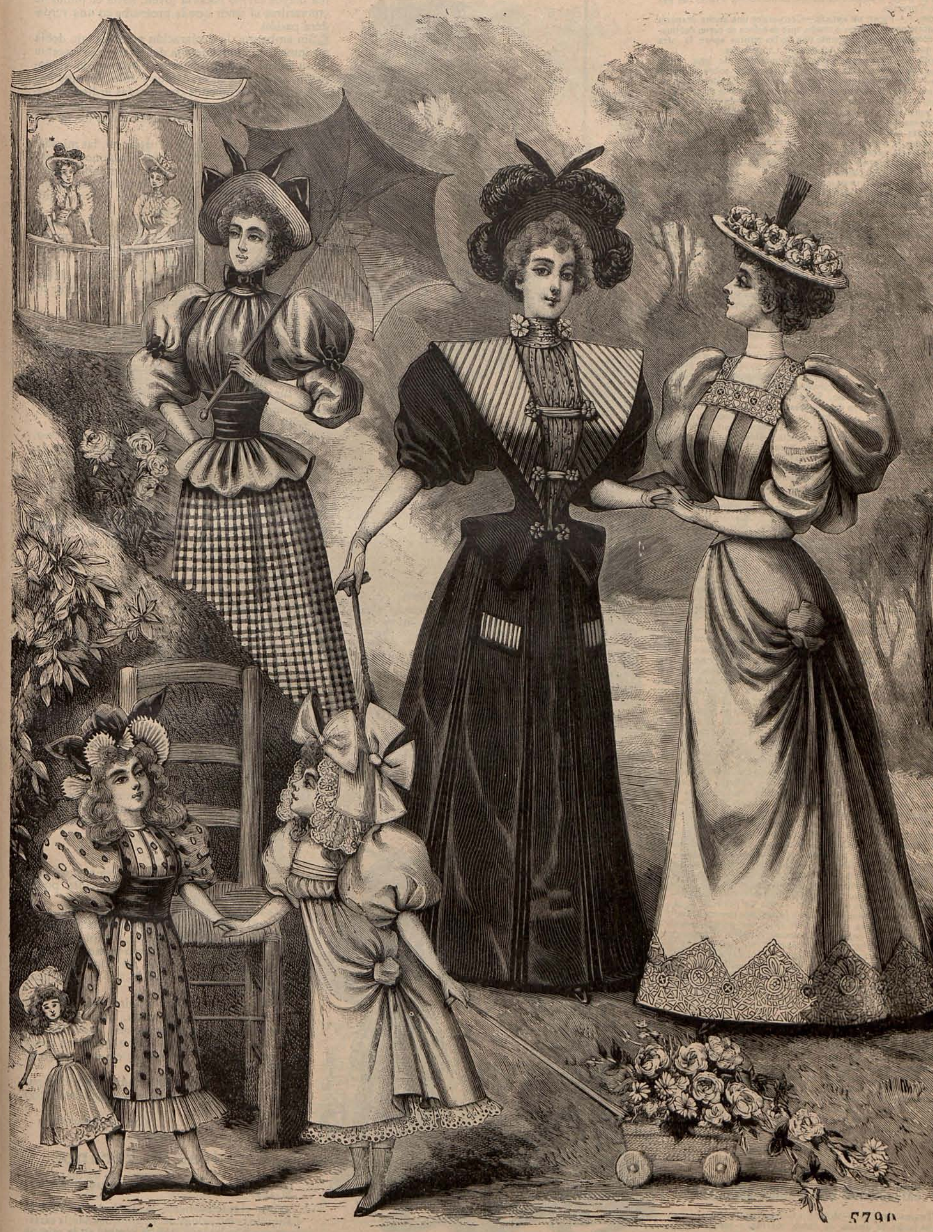
Núm. 11.—Toilettes alta novedad para paseo.