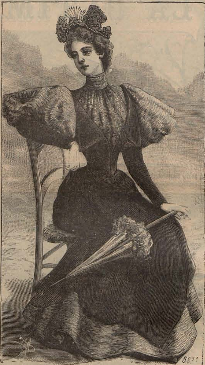
Núm. 2.—Traje de paseo para señorita.

Los amables dueños habían invitado á comer á sus mejores amigos, y después de una succulenta comida al aire libre en medio de un jardín delicioso, se trató de buscar la manera más agradable de pasar la velada.