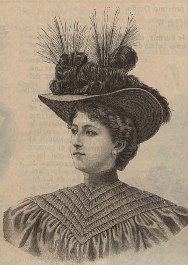
Núm. 17.—Sombrero PASTORA.

Núm. 10.— Traje para Casino. —(Espalda y delantero).—Falda de surah maíz, con quilla y volante de encaje blanco, sobre la que se coloca una segunda falda