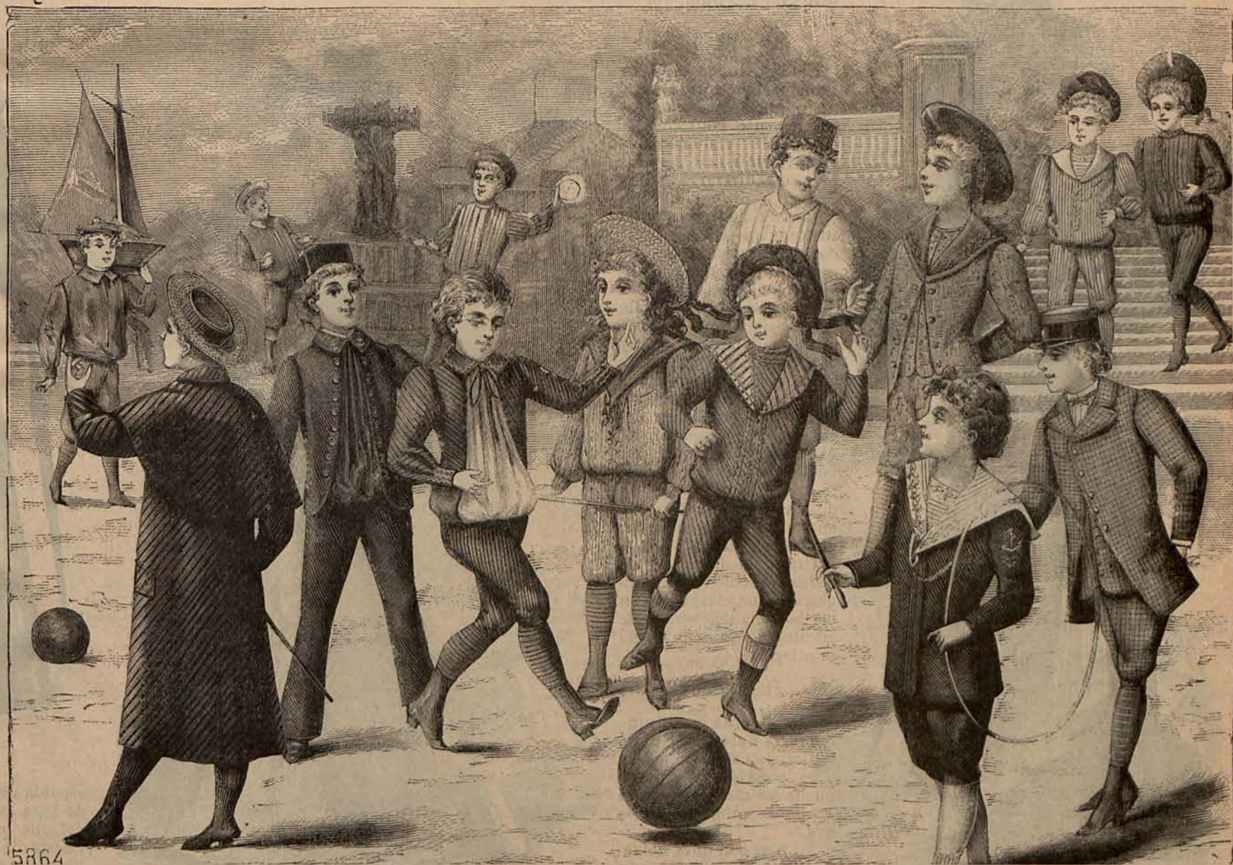
Núm. 6.—Trajes para niños de 5 á 12 años.

Era ya tarde, las horas habían volado en torno nuestro, y la reunión se disolvió dejando en todos impresiones más ó menos du-