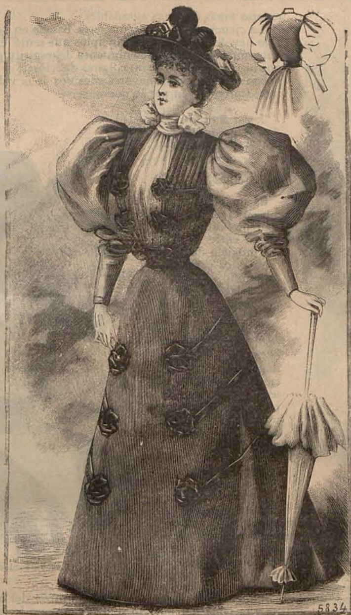
Núm. 5.—Traje para visita (delantero y espalda)

—En efecto—asintió el académico—por algo se los llama espejo del alma. Azules ó de un gris azulado, indican la dulzura, la sensibilidad. Los de un azul muy claro, rara vez se hallan en las personas irritables, coléricas, y menos aún en las melancólicas. Un hombre ó una mujer que tienen propensión á encolerizarse, poseen ojos verduscos ó castaños, y á veces de dos ó tres matices, formando un tornasol oscuro. Los ojos negros y brillantes, manifiestan talento, valor, alegría. Los rojos son indicio de una naturaleza ambiciosa ó avara. Los ojos amarillos tirando á castaños, revelan genio. Los grises, un carácter firme... Podría estendeme mucho más; pero lo creo inútil—añadió el sabio sonriendo—porque el lenguaje de los ojos lo sabe todo el mundo,