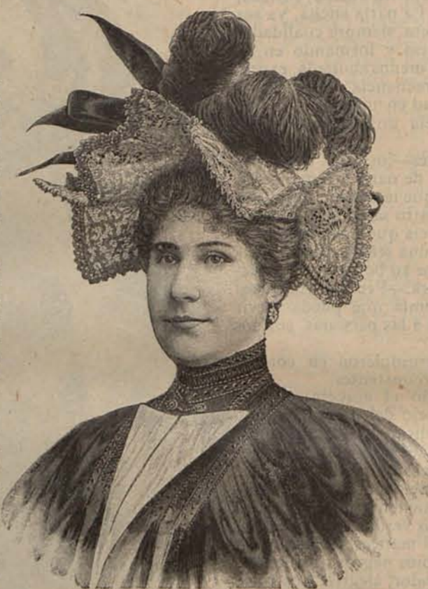
Núm. 9.—Sombrero ARABELA.

Aparte de la que podría llamarse incubación de las que han de ser innovaciones trascendentes, existen lo que podemos calificar de novedades al por menor ó de detalle, cuya creación y aparición no se interrumpe en ninguna época del año, y que si bien no son de ex-