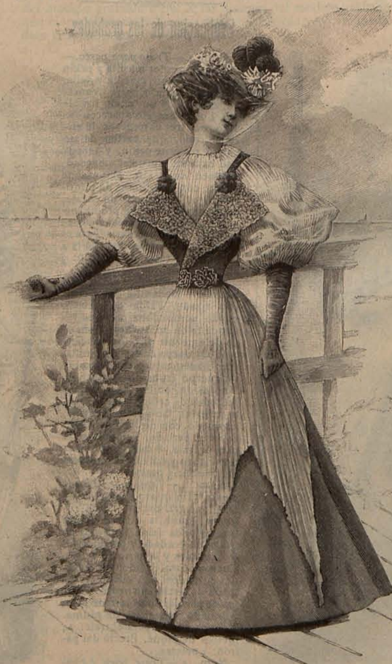
Núm. 18.—Traje para paseo

abierta en el costado, guarnecida por un volante de encaje cosido con un rizado de cinta maíz. Cuerpo corselete de terciopelo negro, abierto sobre un primer cuerpo de surah, cuyo escote se cierra con un lazo mariposa de encaje. Mangas de gasa de seda maíz, con hombreras formadas por cocas de terciopelo negro. Sombrero de paja de Italia, adornado con plumas y lazos de terciopelo negro. Tela necesaria para el traje, 14 metros de surah, 2 de terciopelo y 3 de gasa negra. Precio del patrón: 3 pesetas.