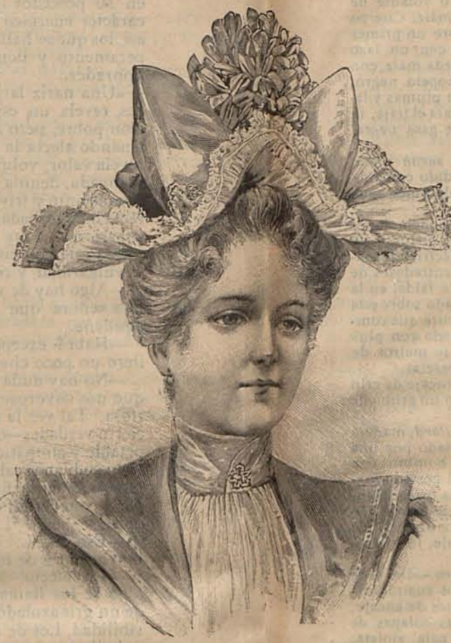
Núm. 11.—Sombrero GARMELA.

leen recto, de lana escocesa de tonos madera y granate. De los hombros parten anchos galones elásticos, cruzados sobre la espalda y cosidos á los costados de los delanteros, á los que sirven de sostén; pues la prenda que me ocupa, tiene en lugar de las piezas correspondientes á la