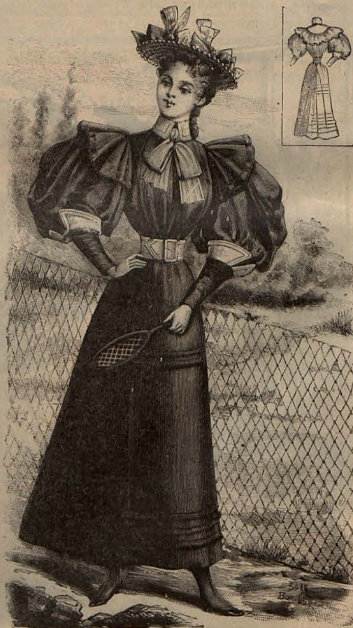
Núm. 4.—Traje para jugar al Lawn-tennis (delantero y espalda.)