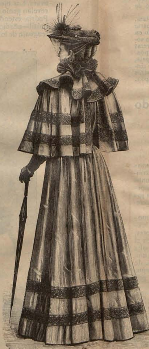
Núm. 12.—Sobretodo elegante.

leen recto, de lana escocesa de tonos madera y granate. De los hombros parten anchos galones elásticos, cruzados sobre la espalda y cosidos á los costados de los delanteros, á los que sirven de sostén; pues la prenda que me ocupa, tiene en lugar de las piezas correspondientes á la