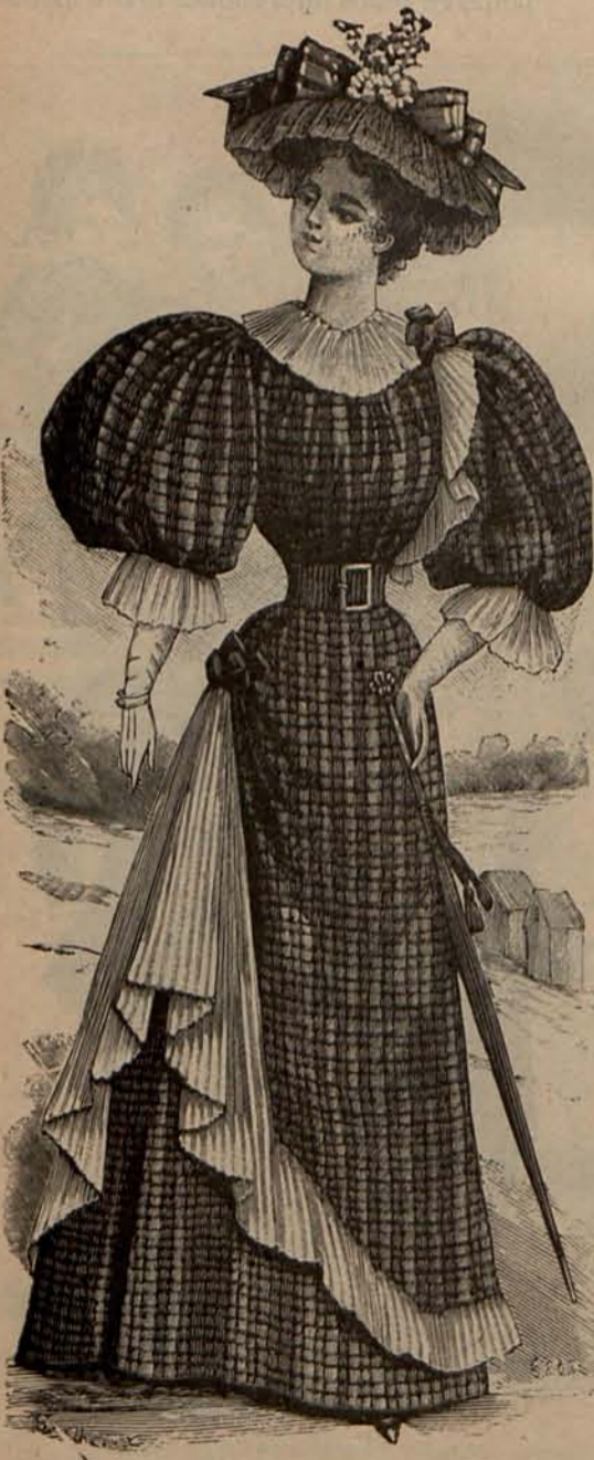
Núm. 8.—Traje para paseo.