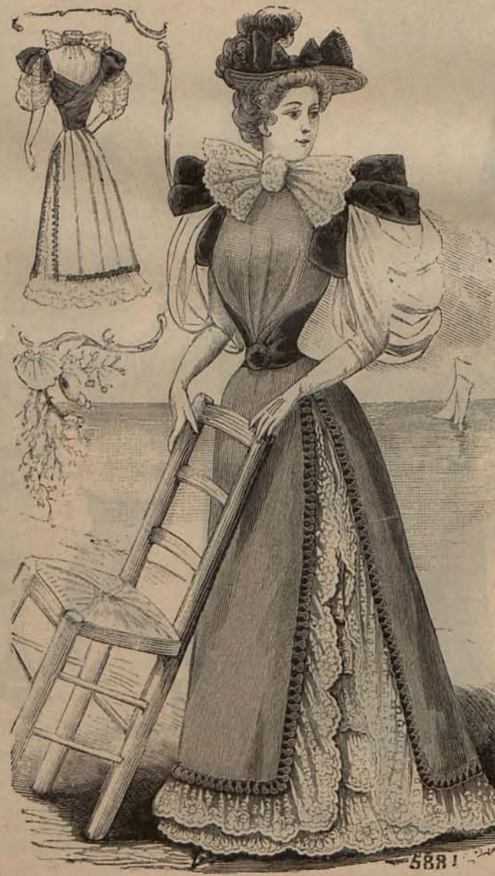
Núm. 10.—Traje para Casino (espalda y delantero).