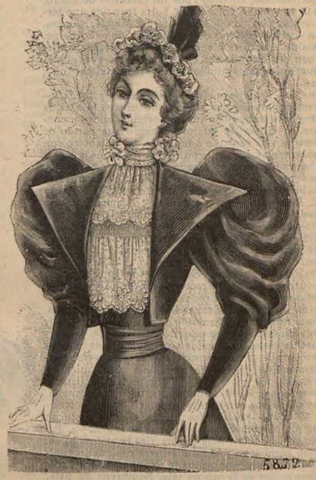
Núm. 15.—Cuerpo para traje de teatro.