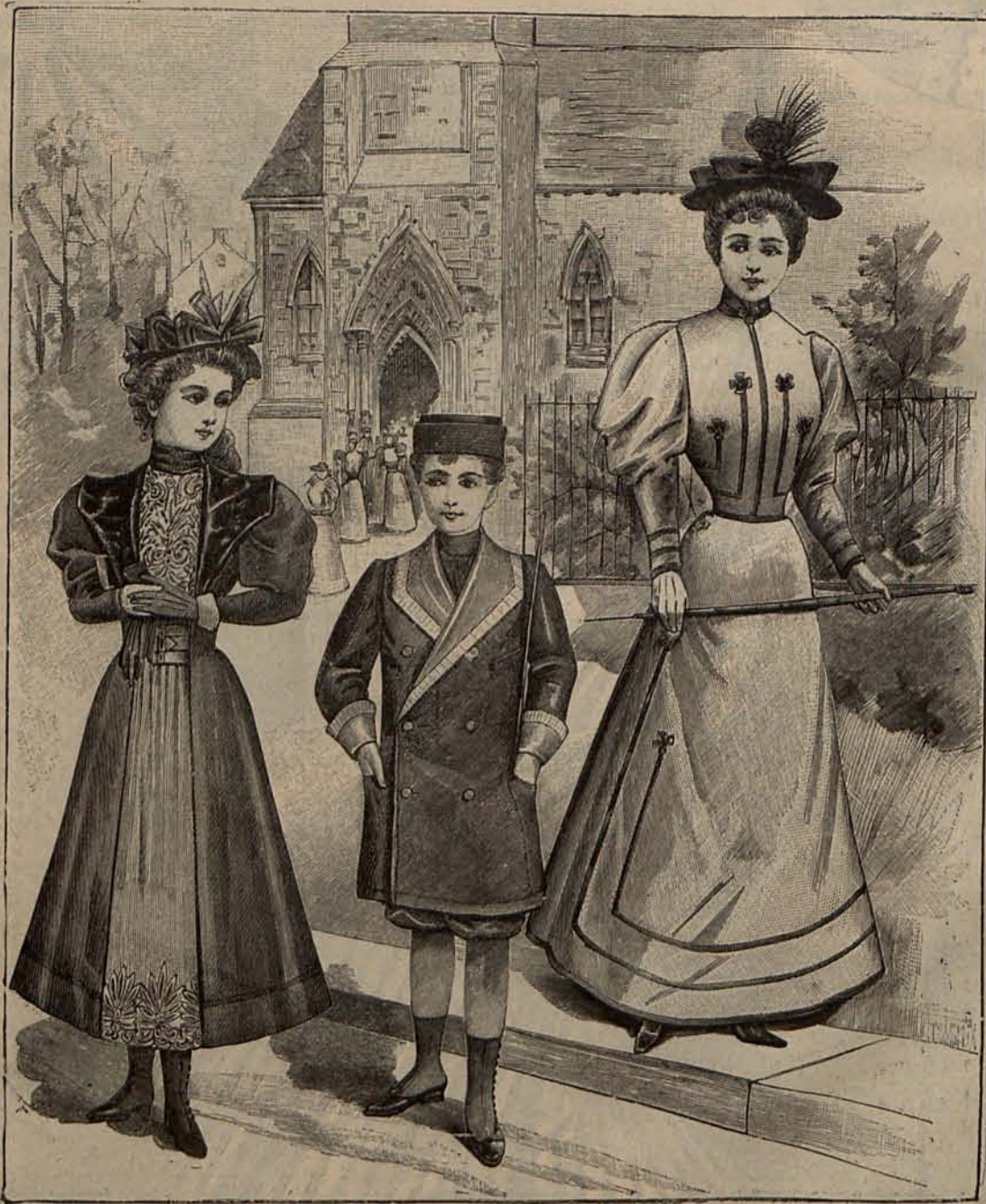
Núm. 3.—Trajes de Otoño para niñas y niños.

No tenía que esforzarse en convencernos; cuantos le oíamos estábamos de acuerdo con él, y supongo que la inmensa mayoría de las lec-