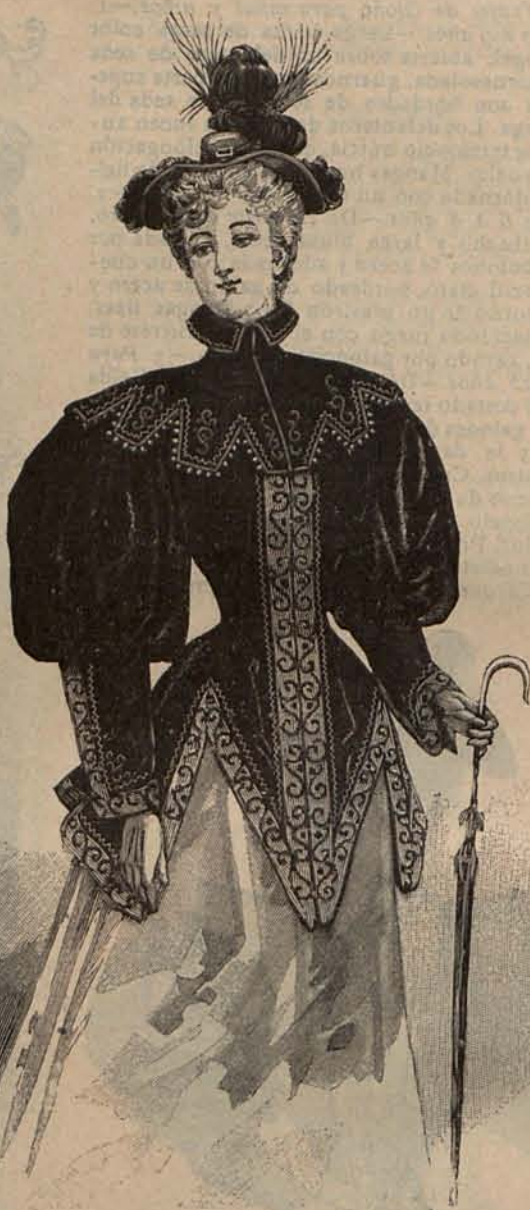
Núm. 14.—Chaqueta de Otoño.

Núm. 14.— Chaqueta de Otoño. —Es de terciopelo negro con espalda y delanteros ajustados, los últimos cortados en dos agudos picos. En torno del escote, se dispone un cuello esclavina formando almenas, y las mangas son huecas. El adorno de esta elegante prenda, consiste en agremanes y aplicaciones de pasamanería de acero, combinada con pesamanería negra. Sombrero de fieltro gris acero, adornado plumas negras. Precio del patrón de la chaqueta: 2,50 pesetas.