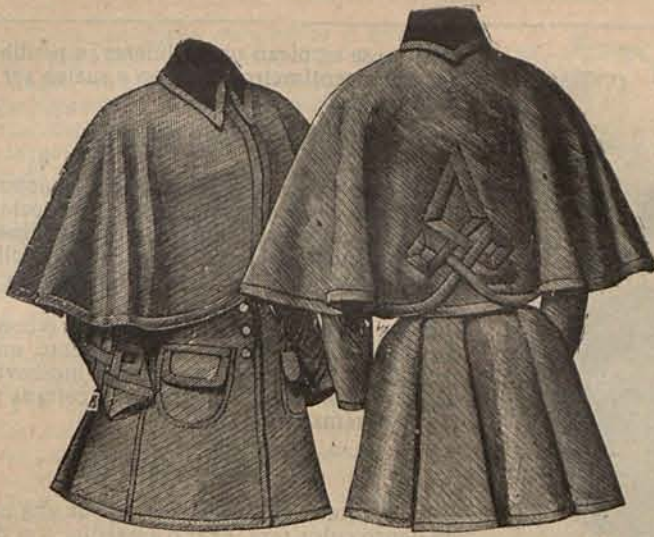
Núm. 4.—Chaqueta con esclavina. (Delantero y espalda.)

Cuando la materia vejeta y duerme, el espíritu vive y crea. ¡Hermoso privilegio del alma, que nunca agradeceremos lo bastante al Supremo Hacedor; y que debemos aprovechar para ser dignos de El y encontrar en medio de las miserias y las