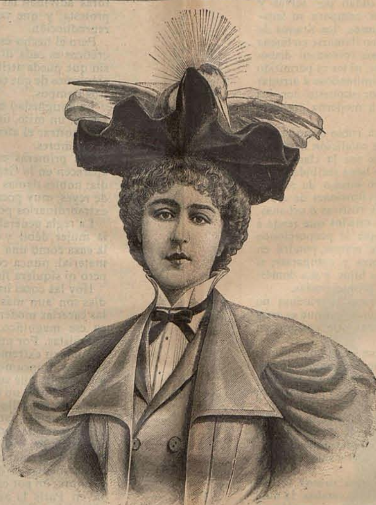
Núm. 9.—Sombrero AUREOLA.