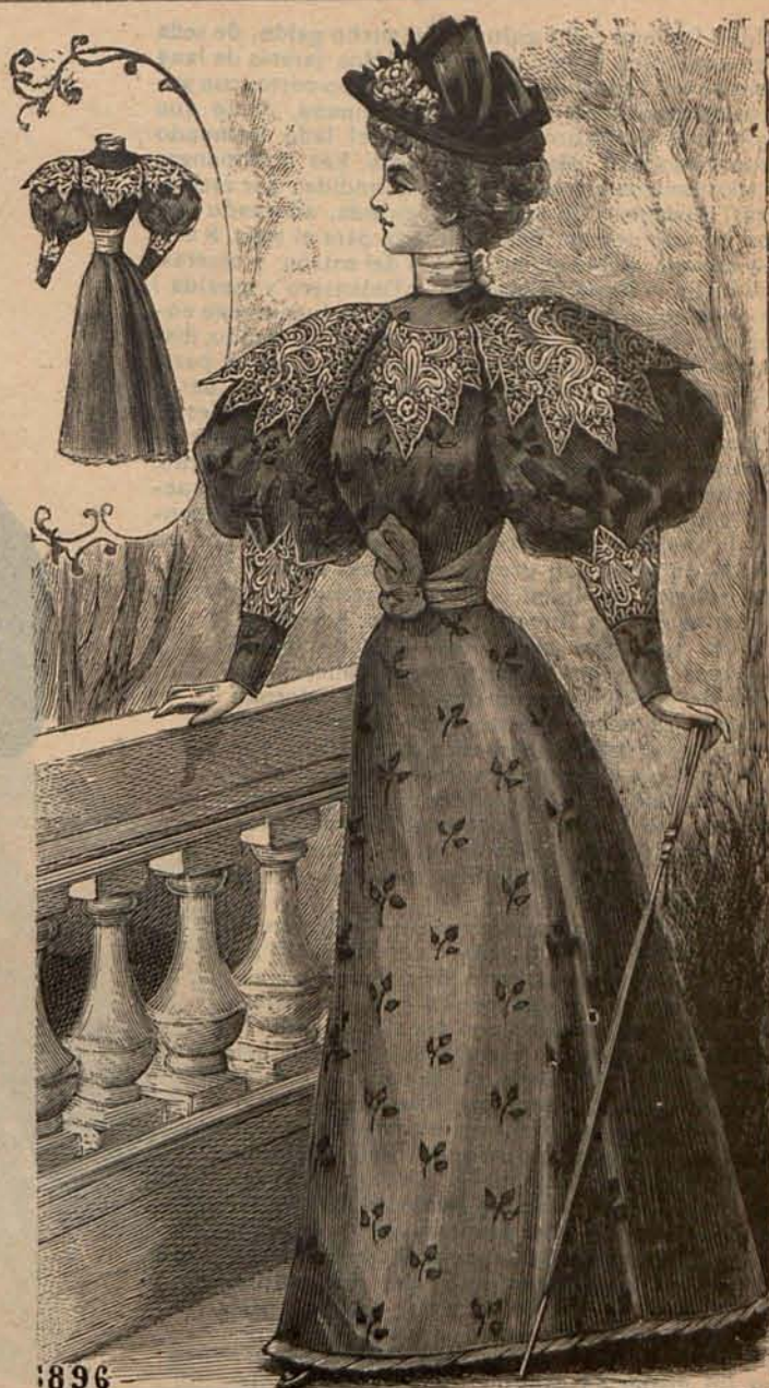
Núm. 12.—Traje para paseo. (Espalda y delantero)

Núm. 6.— Traje para paseo .—(Delantero y es-