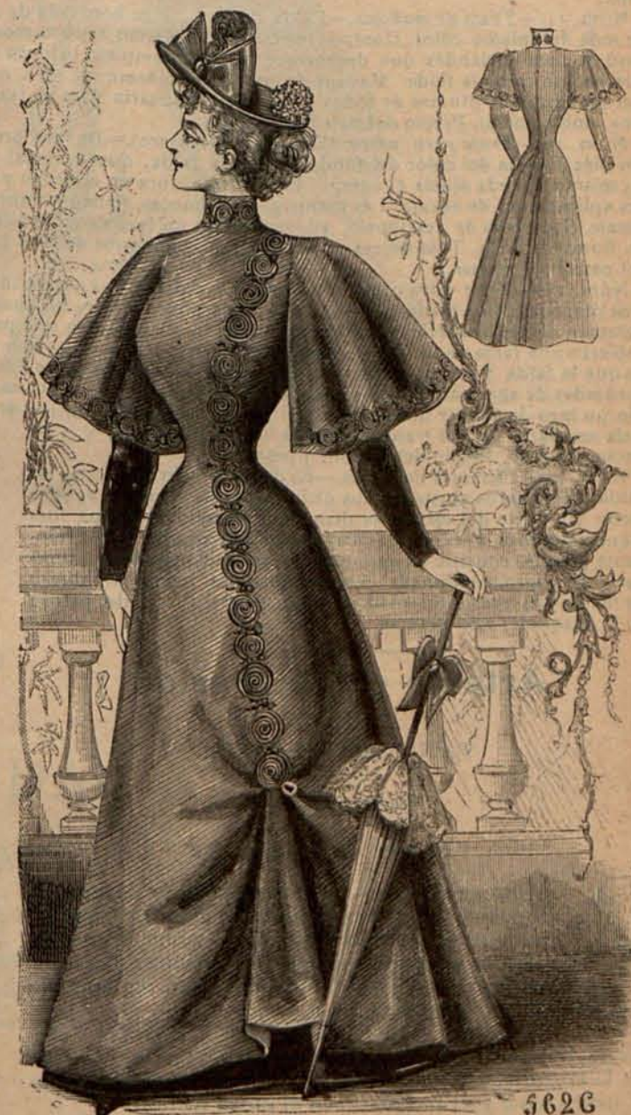
Núm. 13.—Traje para calle. (Delantero y espalda.)