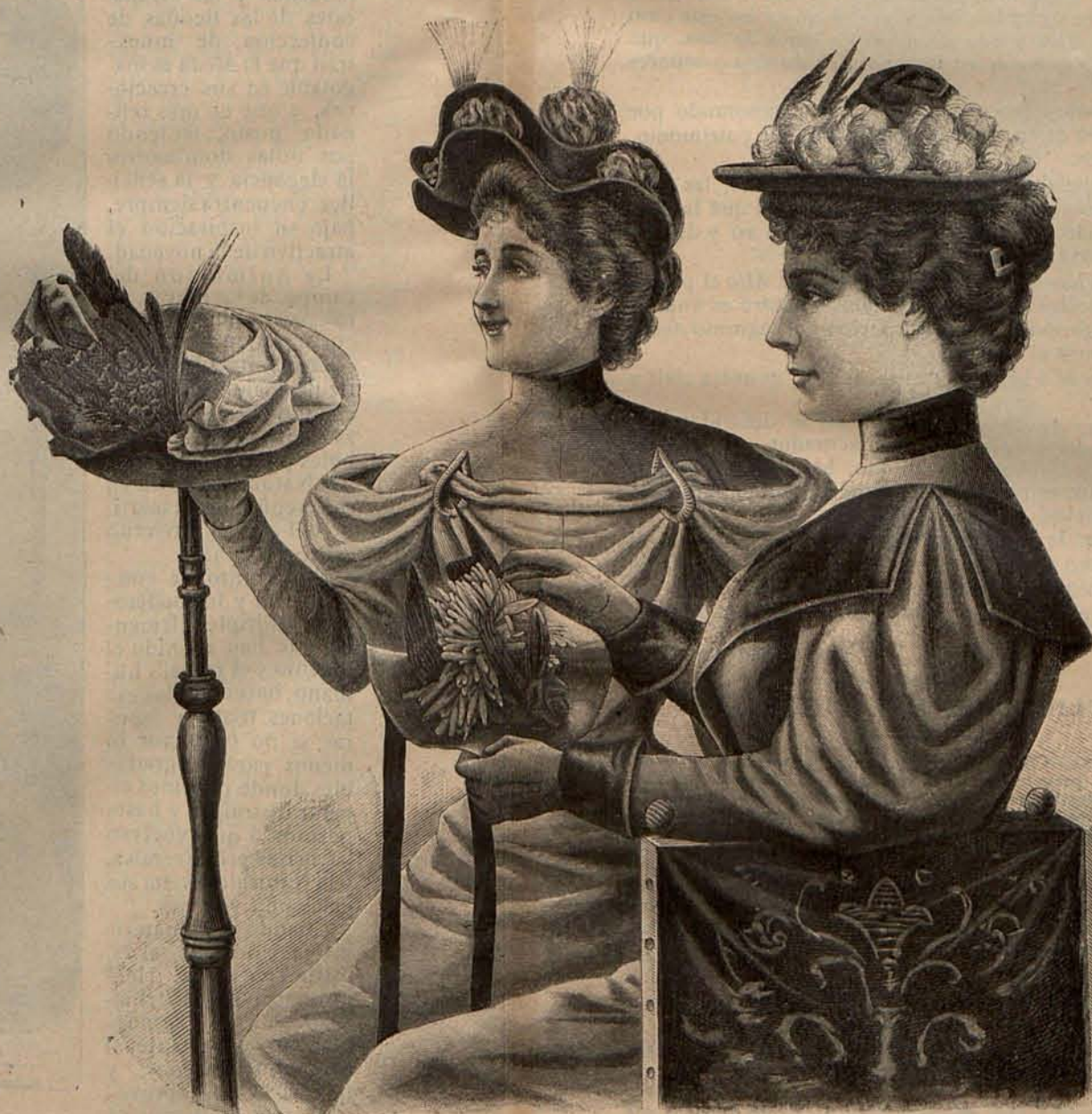
Núm. 10.—Sombreros de Otoño.