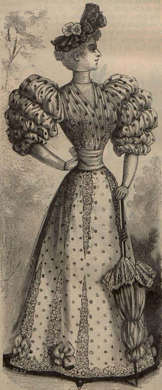
Núm. 8.—Traje para paseo.

sultan mucho menos prácticas que las de lienzo blanco ó crudo, con anchas cenefas bordadas á punto de cruz con algodones de tonos inalterables, las cuales están también muy de moda.