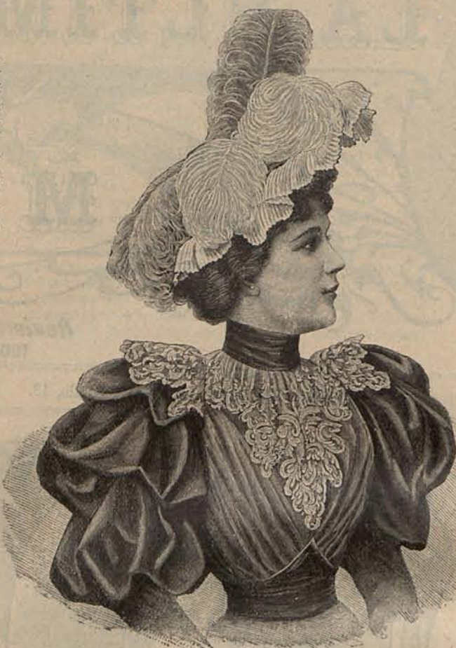
Núm. 2.—Cuerpo y sombrero para teatro.

Así es, que en los castillos, donde para cumplir la primera parte del programa,