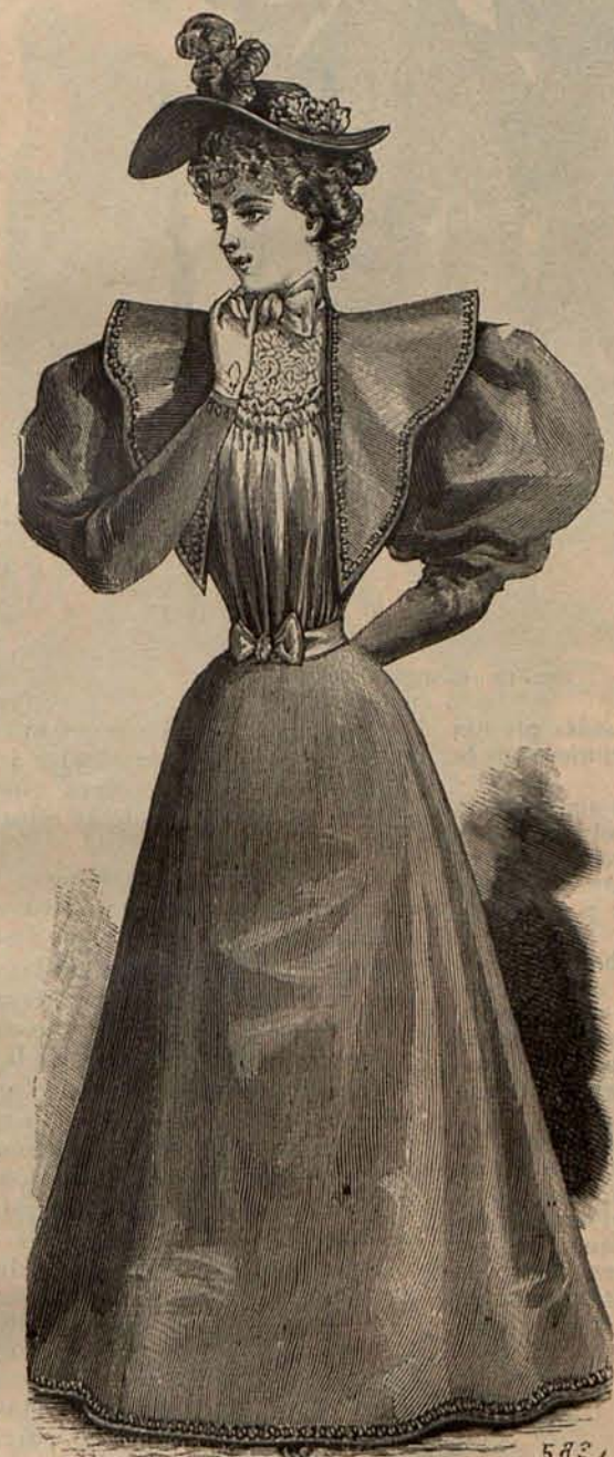
Núm. 11.—Traje de mañana.

palda).—De lana diagonal verde álamo. La espalda y los delanteros modelan el talle, cerrándose los últimos con botones metálicos. Del cuello, que es vuelto y de terciopelo negro, parte una esclavina, adornada con filas de pespuntos. Precio del patrón: 2,50 pesetas.