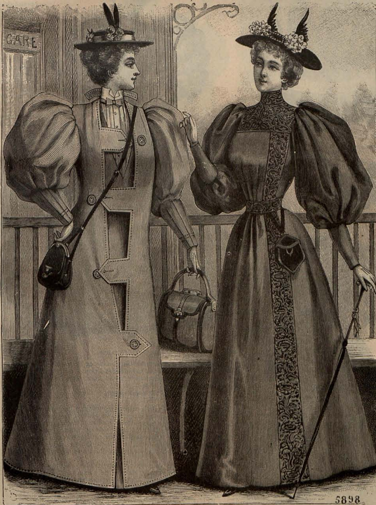
Núm. 5.—Sobretodos de Otoño para viaje.

Para prender y recoger sobre la parte de detrás de los citados peinados el largo velo de encaje ó tul