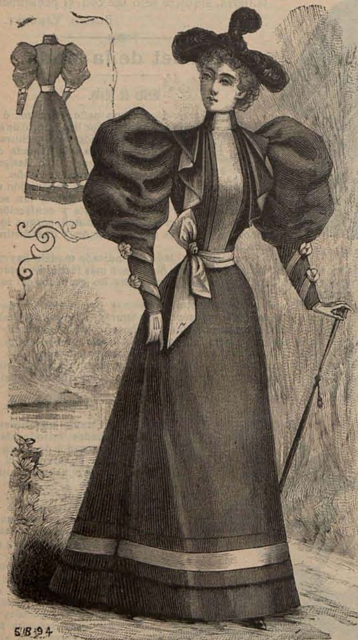
Núm. 6.—Traje para paseo. (Delantero y espalda.)

Núm. 4.— Chaqueta con esclavina . (Delantero y es-