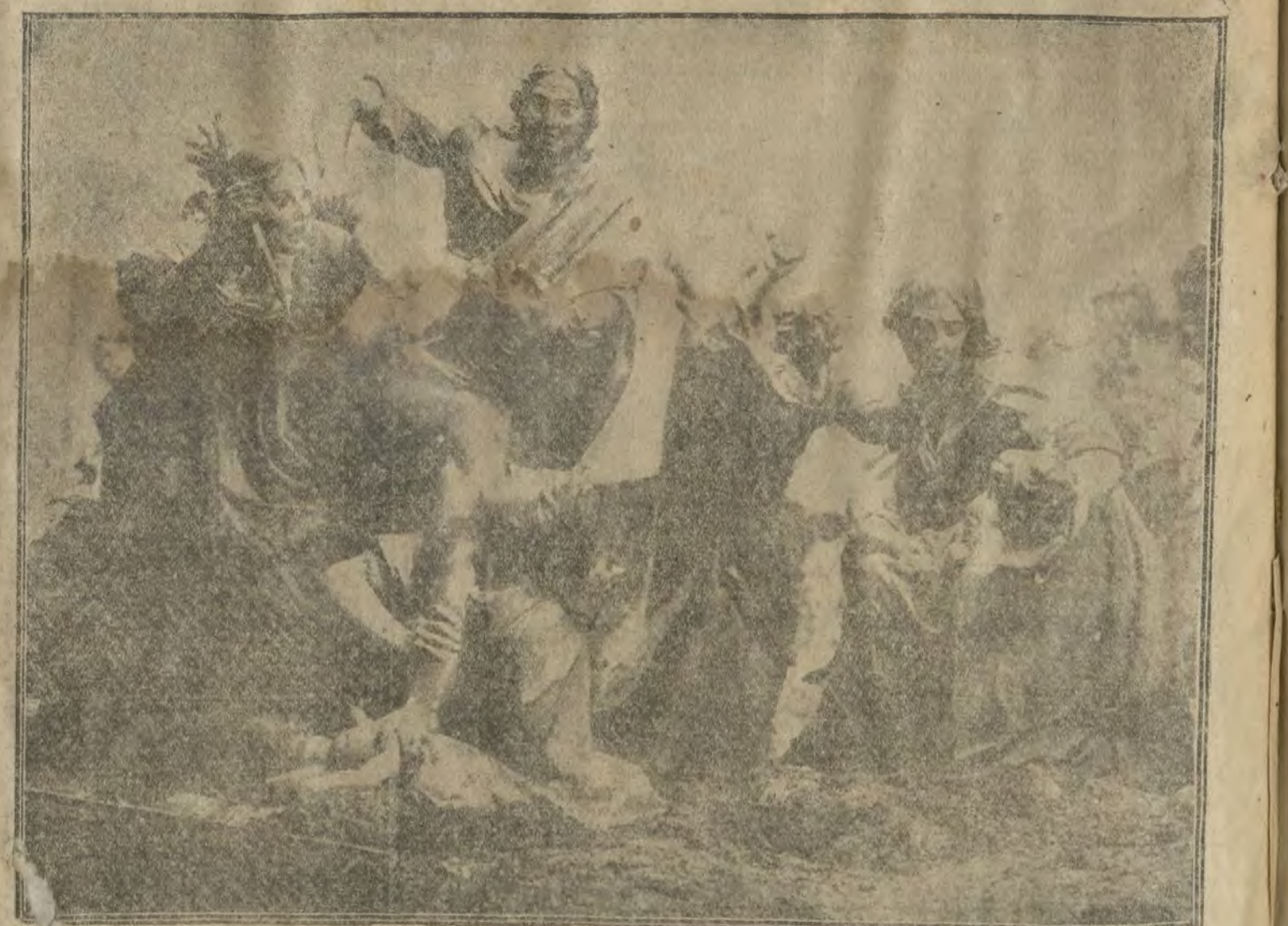
Grupo escultórico modelado por los alumnos de la «Escuela de Pintura y Escultura de San Fernando», representando la Degollación de los Inocentes y que forma parte del «Nacimiento», que esta tarde han inaugurado los Reyes