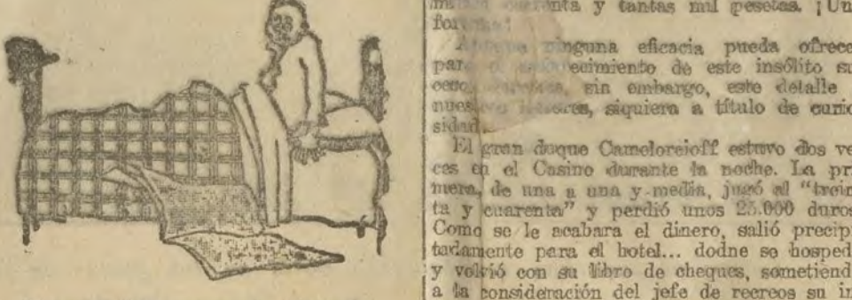
Leyendo "El suceso fantástico".