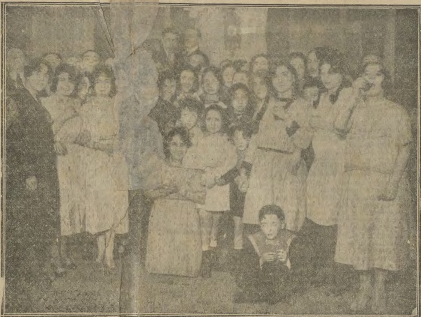
Grupo de señoritas que tomaron parte en las fiestas de fin de año, celebrada anoche en el Centro Asturiano

Los delegados de los Sindicatos únicos mercantiles que han concurrido al segundo Congreso de la Confederación Nacional del Trabajo convocan a los compañeros empleados y dependientes de la banca, industria y comercio de Madrid a un mitin de controversia, en el que podrán hacer uso de la palabra todos los asistentes que se celebrará el miércoles, 17, a las diez de la noche, en la calle de Pinar, 15 (Casino federal).