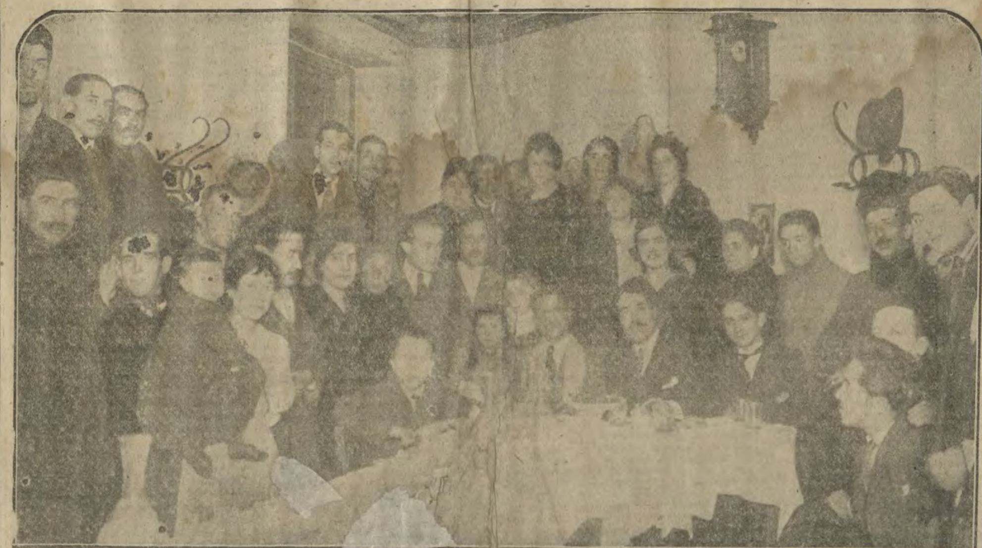
Cena de fin de año dada anoche a los padres por la revista "Mesa Revuelta"