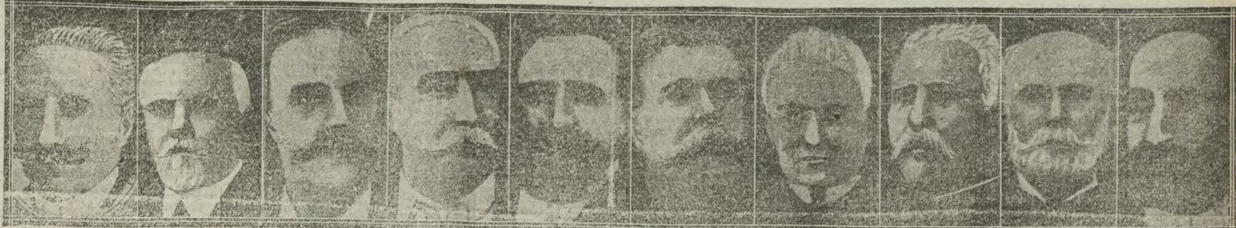
Deschanel, 1920. Poincaré, 1913. Porier, 1894. Félix Faure, 1895. Loubet, 1899. Fallières, 1906. Thiers, 1871. Mac-Mahon, 1873. Grévy, 1879. Sadí Carnot, 1887.