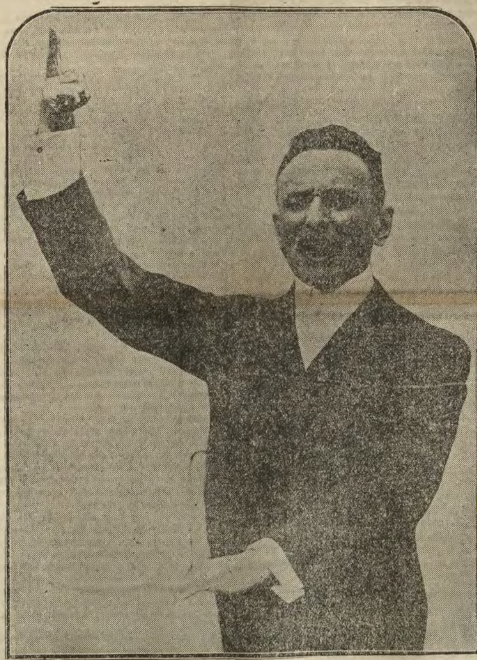
El jefe del partido reformista don Melquiades Alvarez, que ayer pronunció en el Congreso un notable discurso acerca de los problemas sociales.

—No, señor, señor guardia civil: no tiene usted derecho a molestarme. ¿No ha oído usted al Gobierno de Allende que anuncia que se va a conservar neutral, dejando a cada uno que compre los votos que quiera?