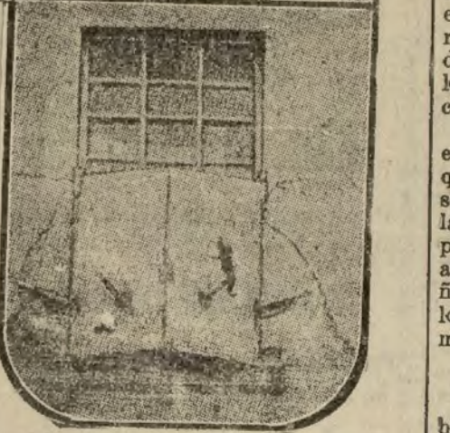
Una ventana blindada, por ca- yas troneras pasan los cañones de los fusiles.