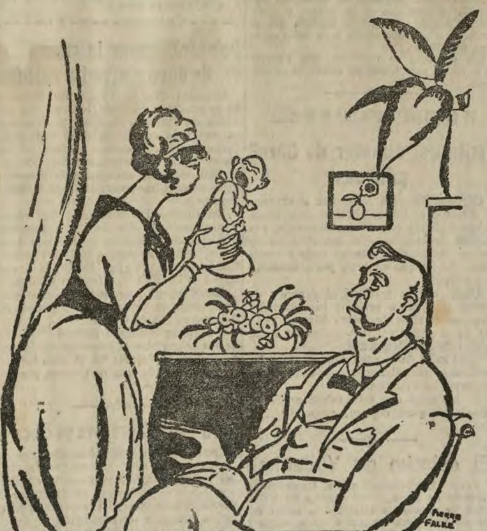
LA MADRE.—¡Este niño es imposible! Quiere estar tragando todo el día... EL PADRE.—¡Qué lástima que no tenga más edad! ¡Podríamos presentarle concejal!