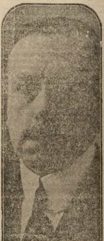
El poeta D. Manuel Sandoval, que mañana leerá su discurso de ingreso en la Real Academia Española.

Continúan las acciones; continúan siendo el eje de nuestra vida todas las mentiras y todas las insinceridades. La única soberanía verdaderamente soberana es el engaño y el embuste. ¿Cómo es posible que hombres y órganos de opinión opuestos a otorgar al pueblo ayer, al verdadero pueblo, que es en definitiva, no sólo el formado por los que trabajan y producen, sino por los que se organizan y viven atentos la marcha de los modernos postulados, sus justas peticiones, que aplaudan y glorifiquen hoy el discurso de Melquiades Alvarez, que ha defendido de una manera rotunda, expresa y categórica esa voluntad omnívota que ellos han negado con sus palabras y sus hechos?