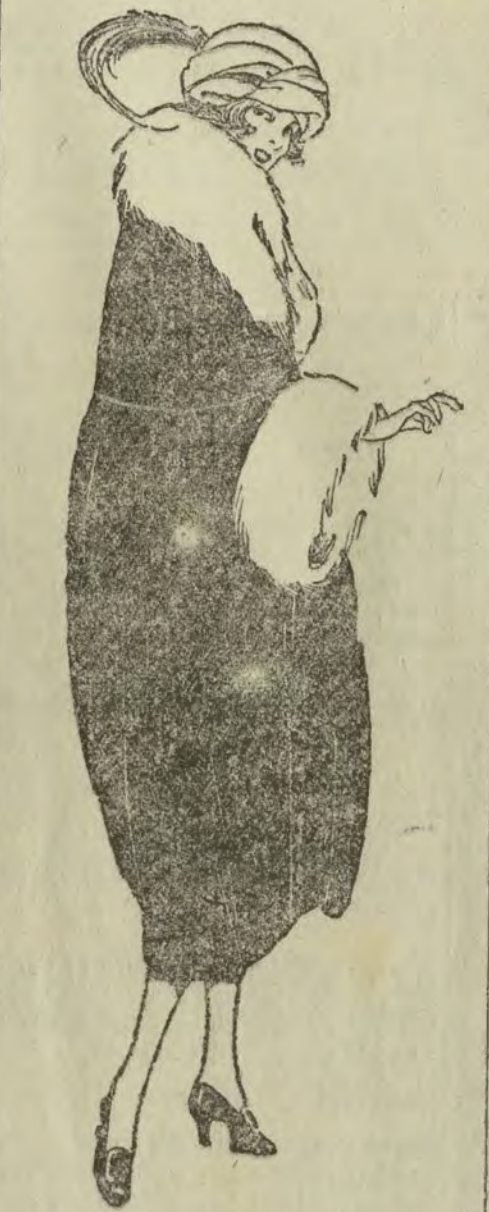
Abrijo-capa de terciopelo

casos estos recuerdos, de una fealdad conmovedora, con sus boquillas cuadradas sencillas y doraditas y sus telas cubiertas de apretadas filas de menudísimas perlas de sedera, en fondo blanco, sobre el que se combinan dibujos de diversos colores. Pobres bolsos, confeccionados con tanto cuidado, en el engorro de cuyos encañes se gastaron tantos días y se consumieron tantas ilusiones! Merecían ser respetados. No es probable que reinicié segunda vez: sólo poco prácticos y no muy lindos y no se os puede imitar; consumís mucho tiempo en vuestra obra... Por eso debió respetarse vuestra manolencia y dejaros a solas con vuestros recuerdos, que nunca podríais relatarlos, ¡que eso sí que os prestaría un inapreciable y raro valor!