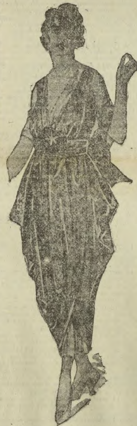
Traje de noche de raso brochado

Como consecuencia obligada de los bolsillos en crochet y cuentas, cuya elaboración ha sido de nuestro constante panorama por espacio de tres años, ni uno más ni uno menos, que todo ese tiempo ha empleado esta prenda de confección casera en degenerar de escribir reinante en insoportable vulgaridad, hemos visto surgir los afiejos bolsos de perlas, de menuda "esterilla", que fueron la gloria y el orgullo de las abuelas de nuestras madres. Tímidamente se han iniciado en algunos