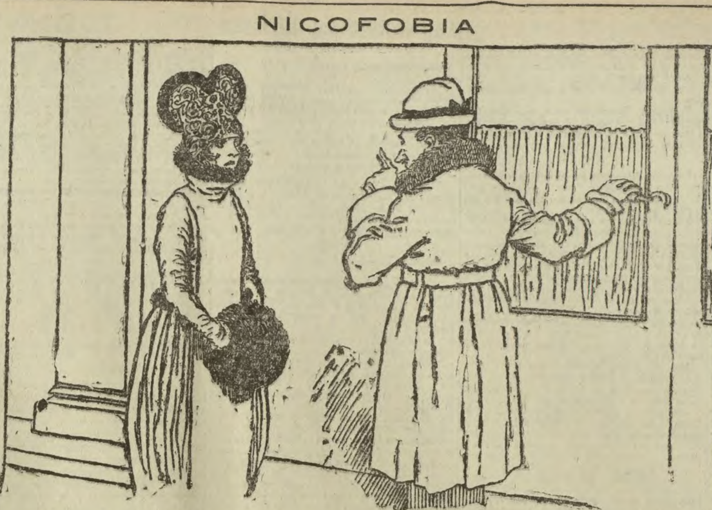
—Aguarda unos minutos, respiraré el humo del tabaco de los compañeros. Esto me ayudará a esperar...

Ayer fueron varios y graves los abusos cometidos por esta poderosa Compañía. En los Cuatro Caminos, a las seis de la tarde, y cuando mayor era la afluencia de viajeros, se suspendió el servicio inopinadamente durante media hora, motivando el hecho tal aglomeración de público, que hubo instantes en que tentamos ocurrir un serio accidente. Después, y para pasar el tiempo perdido, no sólo se permitió la entrada en los andenes a mayor número de personas de las que buena