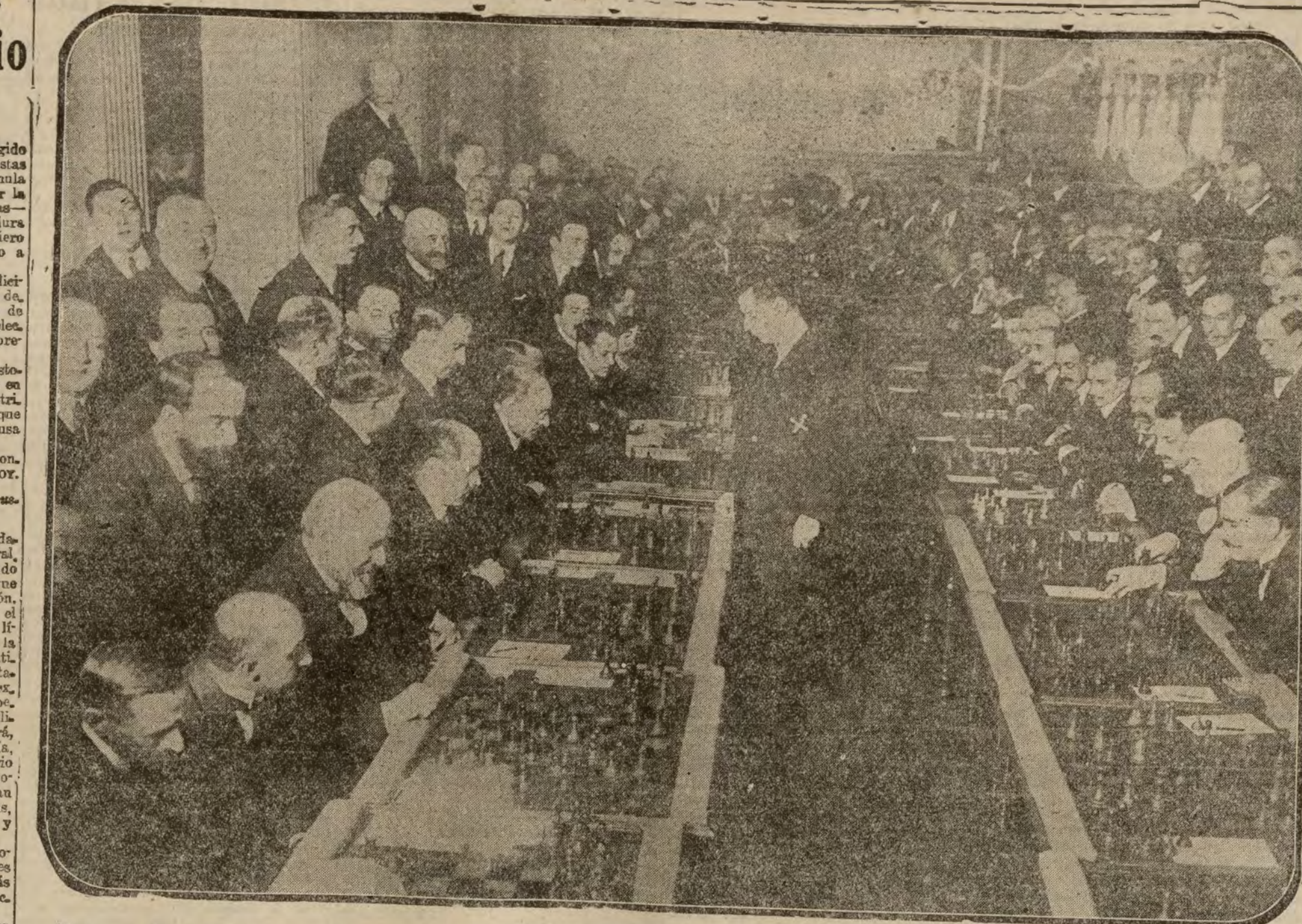
El joven Raul Capablanca (X), campeón de ajedrez, jugando simultáneamente en el Casino de Madrid con treinta de los mejores ajedrecistas madrileños.

Berlin 31.—La Comisión interaliada de vigilancia del cumplimiento del Tratado de Versalles ha enviado a Alemania una nota pidiendo la entrega inmediata, según los términos del Tratado de paz, de los barcos de guerra, con su armamento y material completo, excepción hecha de municiones y explosivos. El Gobierno alemán ha contestado inmediatamente con una nota, en la cual se queja alegando puntos de vista jurídicos. Esta nota insiste en el hecho de que, según las condiciones del armisticio, los barcos no debían ser entregados, sino desarmados inmediatamente, y a consecuencia de esta decisión, todo el material fue desarmado, y una parte se ha perdido durante la revolución, y otra utilizada con miras industriales.