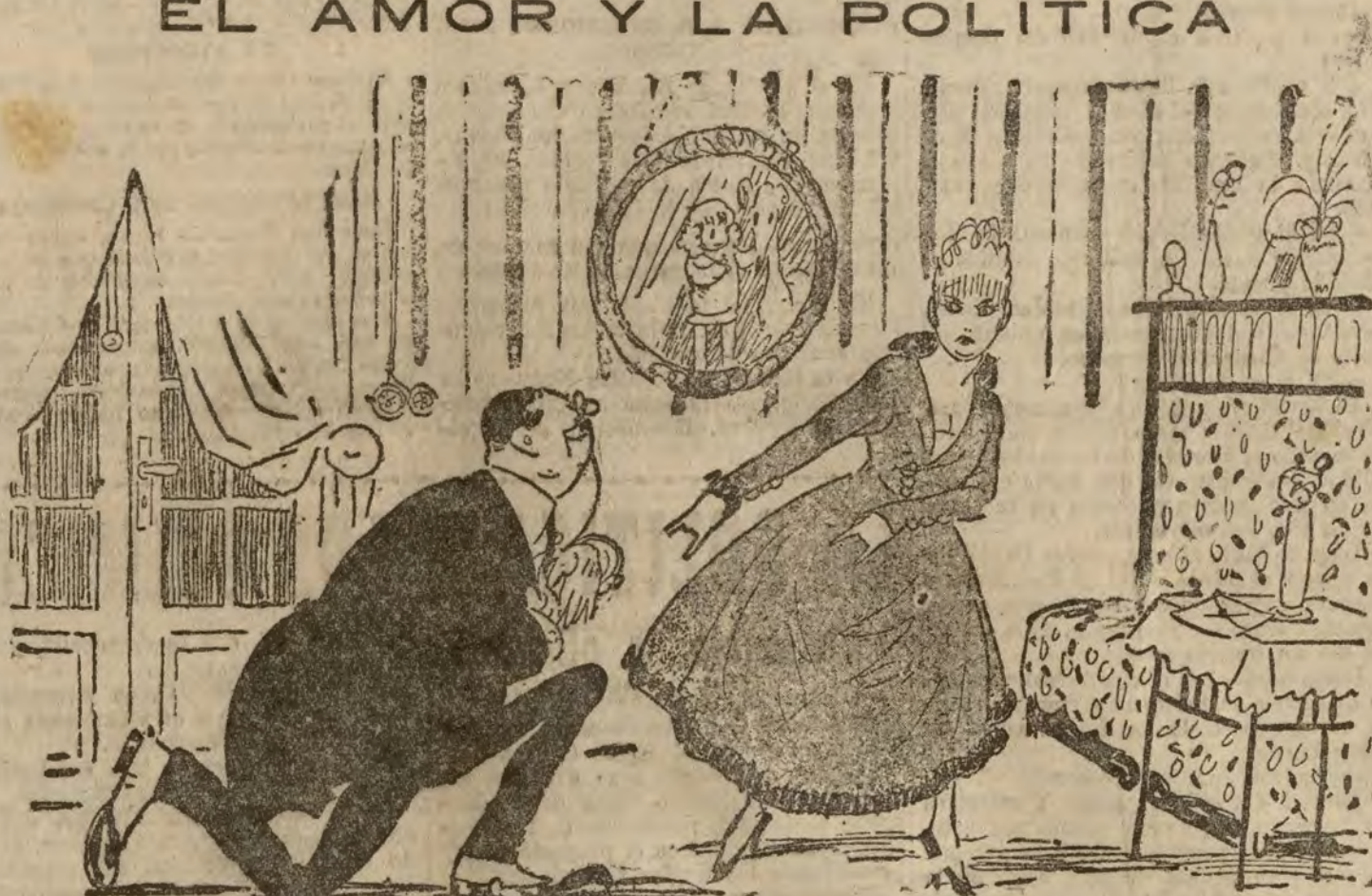
EL DIPUTADO MAURISTA.—Unámonos, señorita, y seremos felices... LA SEÑORITA.—¿Unirnos? ¡Nunca! Soy osorogallardista.

Después aterrizaron en el campo de Amadora donde el elemento oficial les dispensó un cariñoso recibimiento.