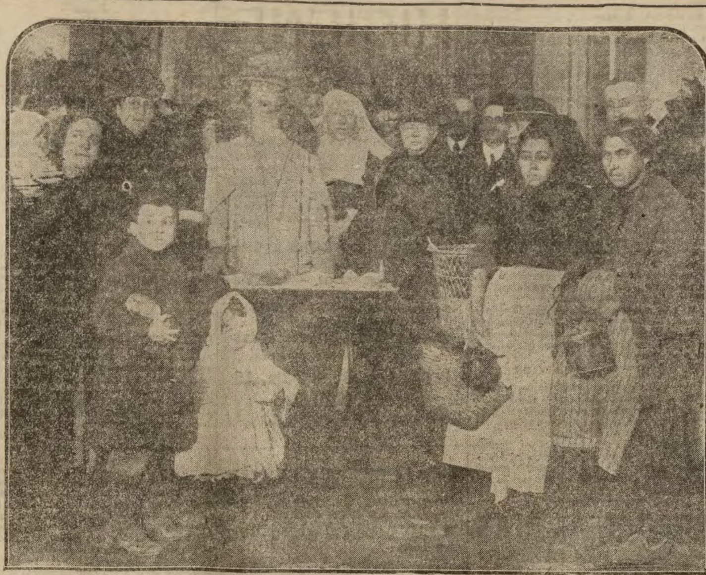
La Reina Doña Victoria, acompañada de la infanta Doña Isabet, repartiendo esta mañana raciones de cocido en el Asilo de las ancianas de la calle de Atocha.

El conde de Santa María de Pomés agradeció las manifestaciones de cariño que se le dedicaban como candidato de la Unión Monárquica Nacional. Censuró acerbamente al diputado regionalista por el distrito, porque a pesar de los dieciocho años que lleva ejerciendo su poder especial en el distrito no ha logrado arrotar ningún progreso, y citó como caso especial el proyecto de puente, que aún está por realizar, sobre la vía que atraviesa dicho pueblo. De esto dedujo que la administración de la Mancomunidad es muy inferior a la del Estado, tantas veces censurada por los catalanistas. Al final del mitin se inició una subscripción que inmediatamente fué abierta por los concurrentes, y cuyo producto se destinó a la construcción de dicho puente. Como muchos de los obreros presentes no pudieron aportar metálico, ofrecieron su prestación personal. Esta nota tan simpática dada por los trabajadores ha despertado gran entusiasmo. Después de este acto, y al salir la gente del local, que estaba abarrotado, se dieron, en medio de un entusiasmo inefable, vivas a la Unión Monárquica, a España y a Cataluña.