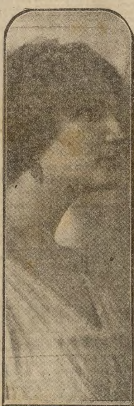
Irene López Heredia, bellísima actriz, que reprisa esta noche en Lara la comedia "La muchacha que todo lo tiene".

Pero ya todo esto pasó; muy pronto habrá tabaco en abundancia, si lo consienten los esmerados y exportadores y si los estancos no complacen exageradamente a sus amigos reservando en esta semana, se dará una saca mayor de la que se daba cuando fumábamos todos los que queríamos visitar el estanco.