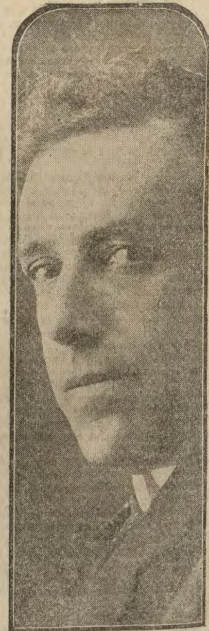
D. Julián Besteiro, diputado socialista por Maara.

quil de aquella localidad vino a Madrid a denunciado al ministro de la Gobernación el anunciado atropello; el ministro contestó que se respetaría el derecho de todos.