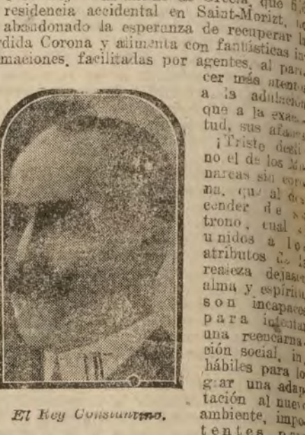
El Rey Constantino.