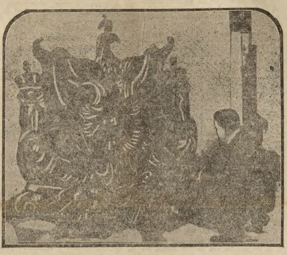
El escudo imperial de Alemania, que el nuevo régimen ha hecho desmontar del edificio del Reichstag.

—¿Y dices que se llama esta obra?... —"La encefalitis letárgica".