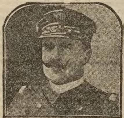
El almirante Salaun, jefe de Estado Mayor de la Marina francesa

Acompañaron al Soberano el general R. Mourel, el ministro de la Guerra y el conde de Romanones.