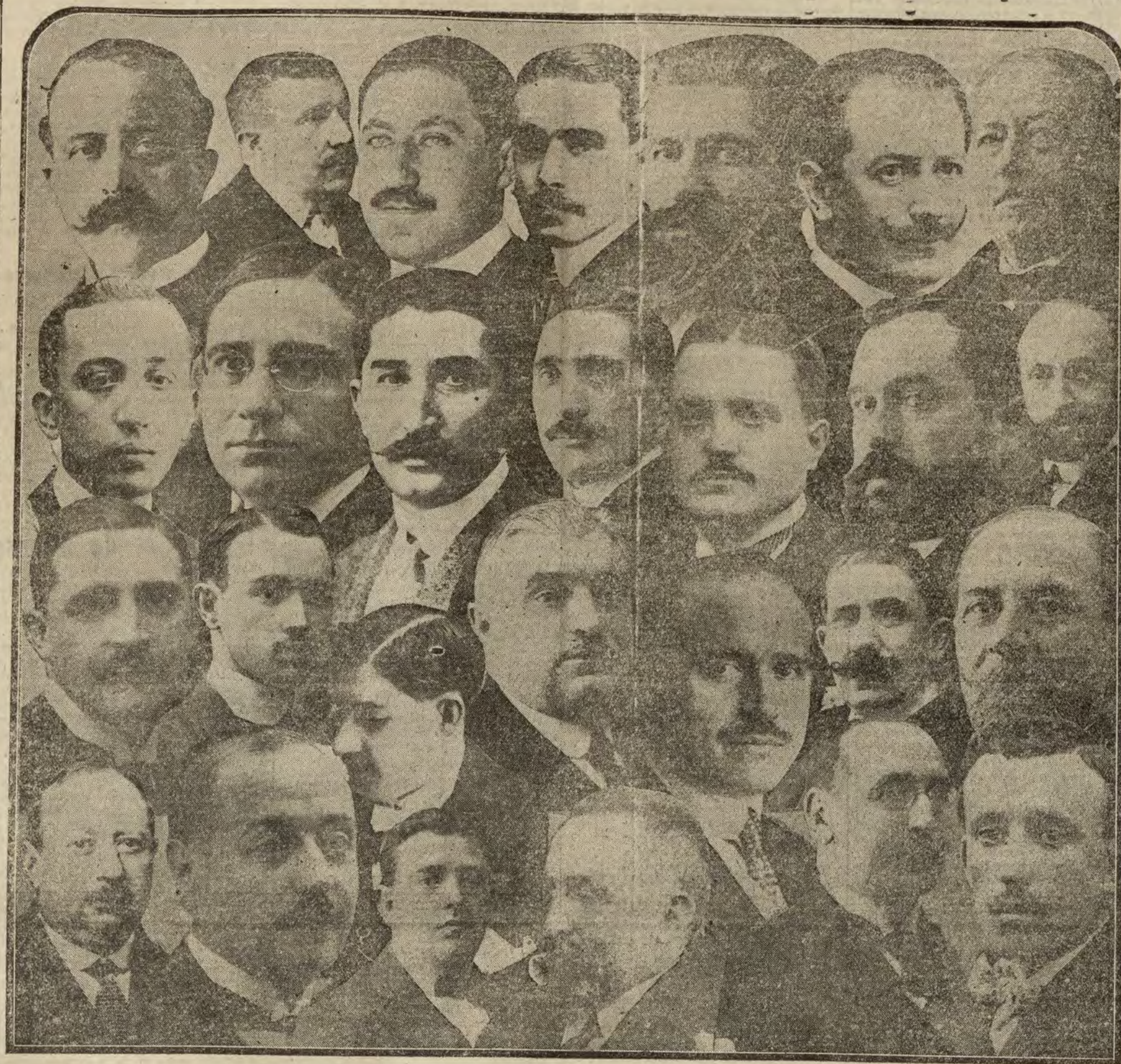
Los veintisiete caballeros, socialistas, liberales, conservadores, mauristas y hasta un independiente, elegidos ayer concejales por Madrid.

Sigamos. Poca animación: "lujo de fuerzas", o sea mucha Guardia civil y los del orden con tercercas, en las afueras; compra-venta de votos; estacadas sin consecuencias en la calle de Doña Blanca de Navarra y los desmontes de Ríos Rosas, por mor de comprar y chanchullos perpetra-