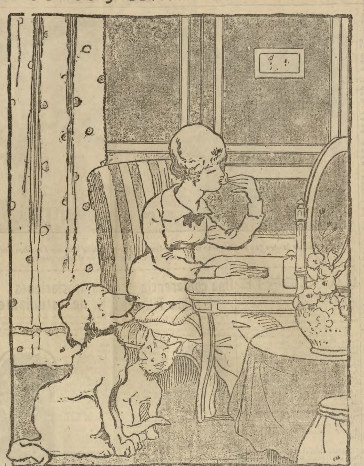
EL PERRO AL GATO.—¿Cómo va de salud tu amar EL GATO AL PERRO.—Muy bien, acaba de comprarse otra caja...

El campeonato que organiza la Federación castellana de Atletismo tendrá lugar el próximo domingo, a las seis de la tarde, en el Pabellón. En la noche se verificará el pase de los concursos. RAB LITOS