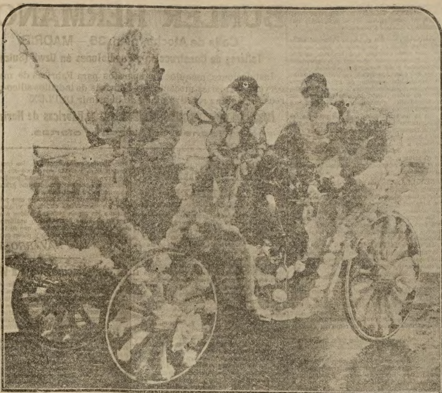
"¡Valla calor!", tercer premio del concurso de coches

No tienen ustedes nada que temer de Alemania. Está enteramente entre sus manos. No tiene ya ni Marina, ni primeras materias. Ya no es un peligro."