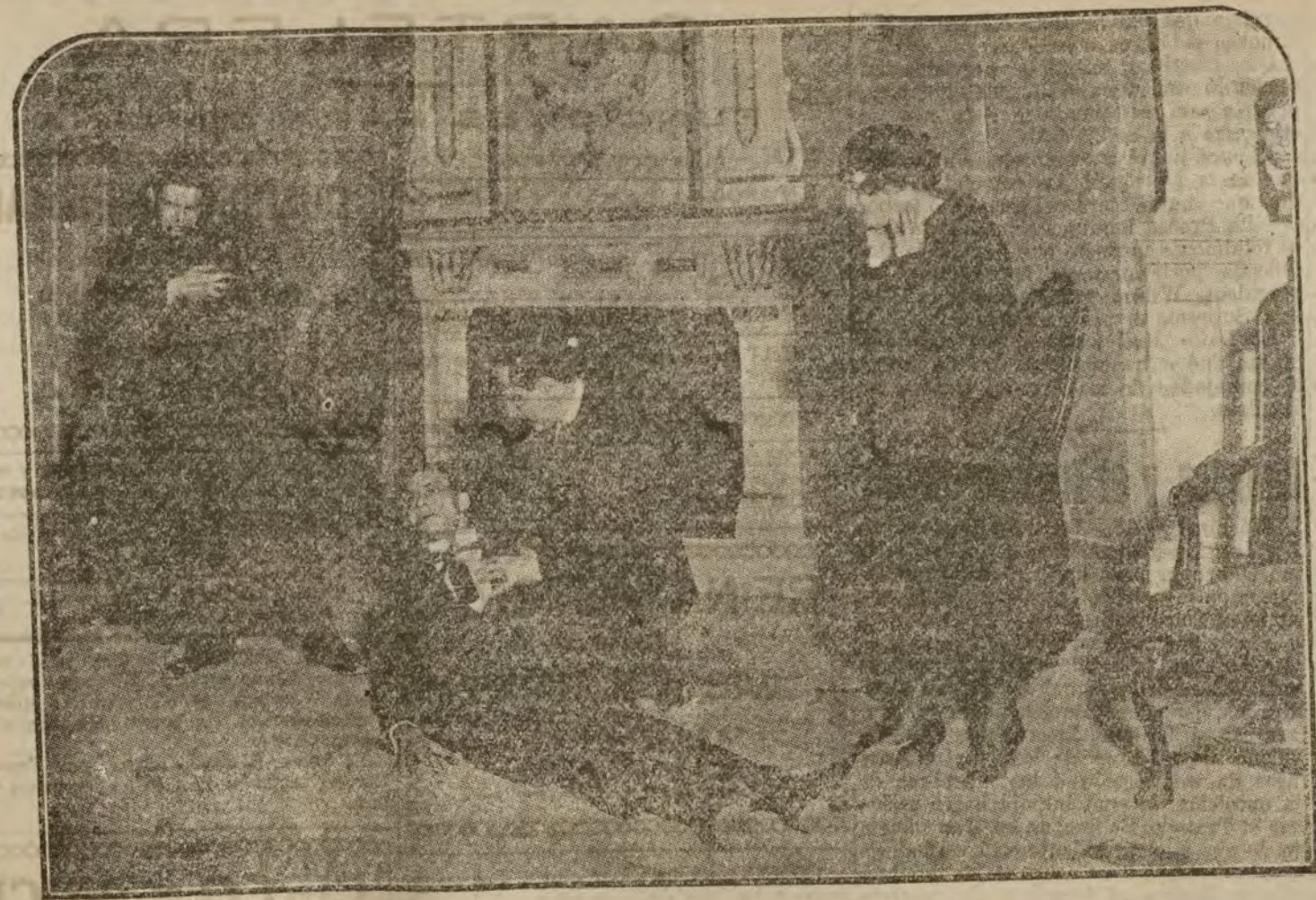
Una escena de la obra "Una voz en la noche", que se estrenó anoche en el teatro de Fuencarral.

SE DESEA arrendar monte de caza. Progreso, 9. Anuncios.