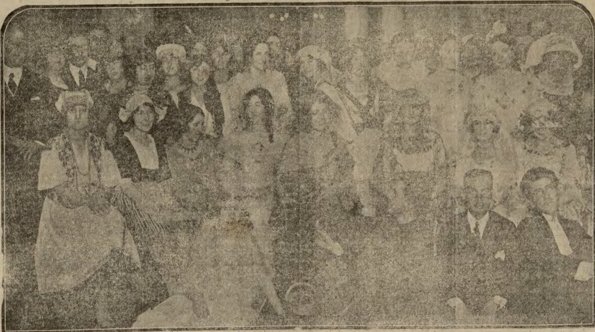
Grupo de señoritas y jóvenes de la aristocracia, que visitando a sus tíos políticos, se hallaron celebrando ayer en el palacio del Ayuntamiento de Madrid.

Arduos del juego son. Pero nadie podrá negarnos que el tradicional arraigo de las convicciones políticas sale bastante malparado.