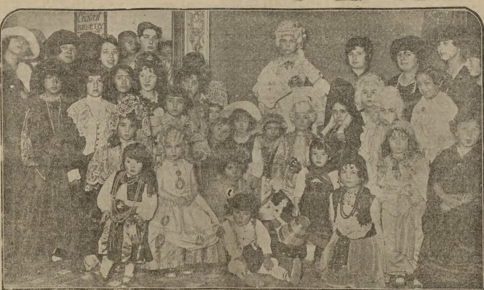
Grupo de niños vistiendo preciosos disfraces, que asistieron al baile infantil celebrado en el Centro de Hijos de Madrid.

El aislamiento social en que el almirante permanecía le lleva a desconocer por completo la verdadera situación de Alemania, y en consecuencia le hace escribir esta página en su diario de guerra: "Charlville, 14 octubre 1914.—El canciller me ha convocado para consultarme acerca de las condiciones posibles de la paz. Domíndome cuanto me fué posible le he dicho