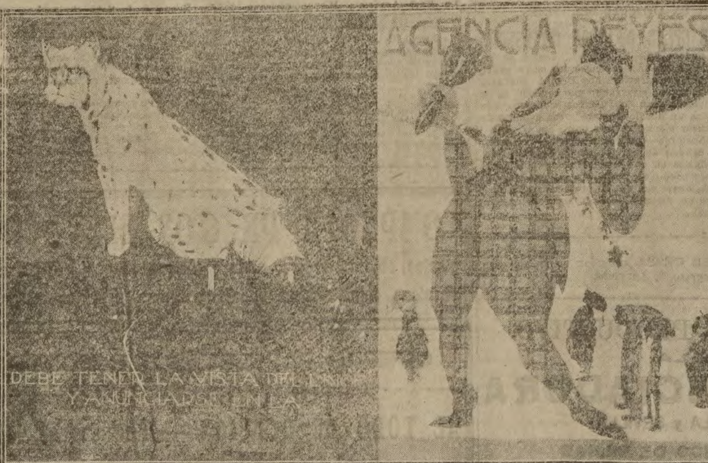
Carteles de Ochoa y Bartolozzi que alcanzaron respectivamente el primero y segundo premio de la exposición que de tan difícil género de arte ha organizado la agencia anunciadora Reyes.