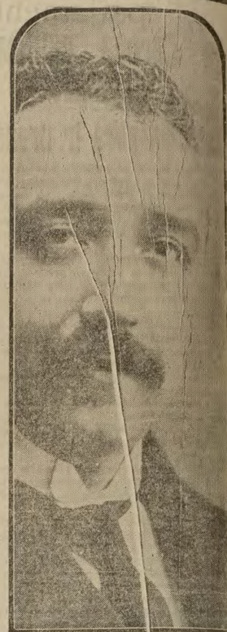
D. Niceto Alcalá-Zamora, nuevo académico de Ciencias Morales y Políticas, cuya recepción se celebrará mañana.