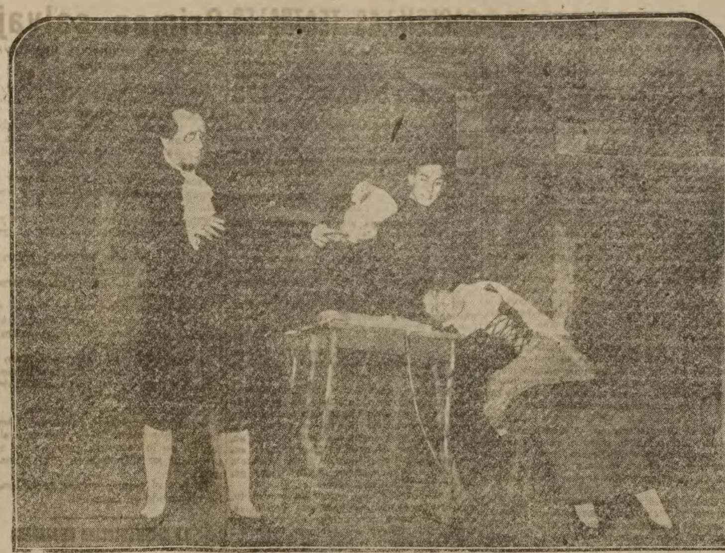
Una escena de la obra "La mesonera de Miro, o el corregidor burlado", que se estrenó el sábado en el teatro Español.

Tal vez estos niños sean explotados por un padre o una madre que diariamente les vierte en vilesas la recomendación de los niños. Tal vez no sean ni padres, sino que hayan recogido a los chicos para ejercer esa industria; pero es lo cierto que en la capital de España, todas las tardes, se consiente que niños de esa edad tiendan su mano para recaudar lo que unos padres o tutores se gastan en vicios como si no hubiera Arlos ni Asociación Matritense de Caridad ni guardias ni Policía.