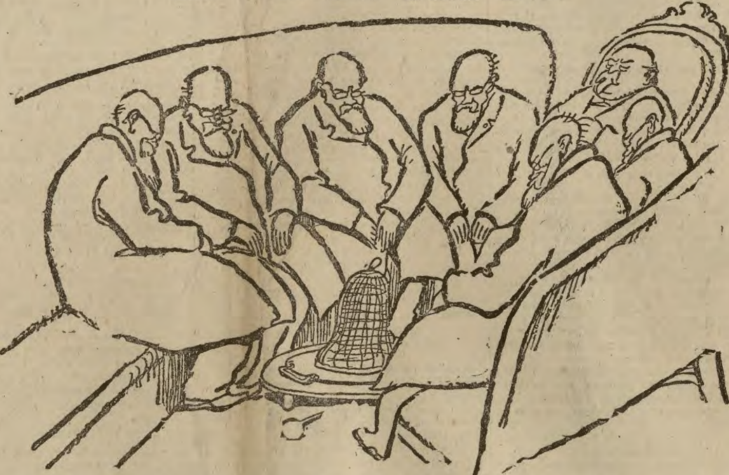
LOS SEÑORES CONSEJEROS A CORO.—En siendo del arrabal que nos llamen lo que quieran.