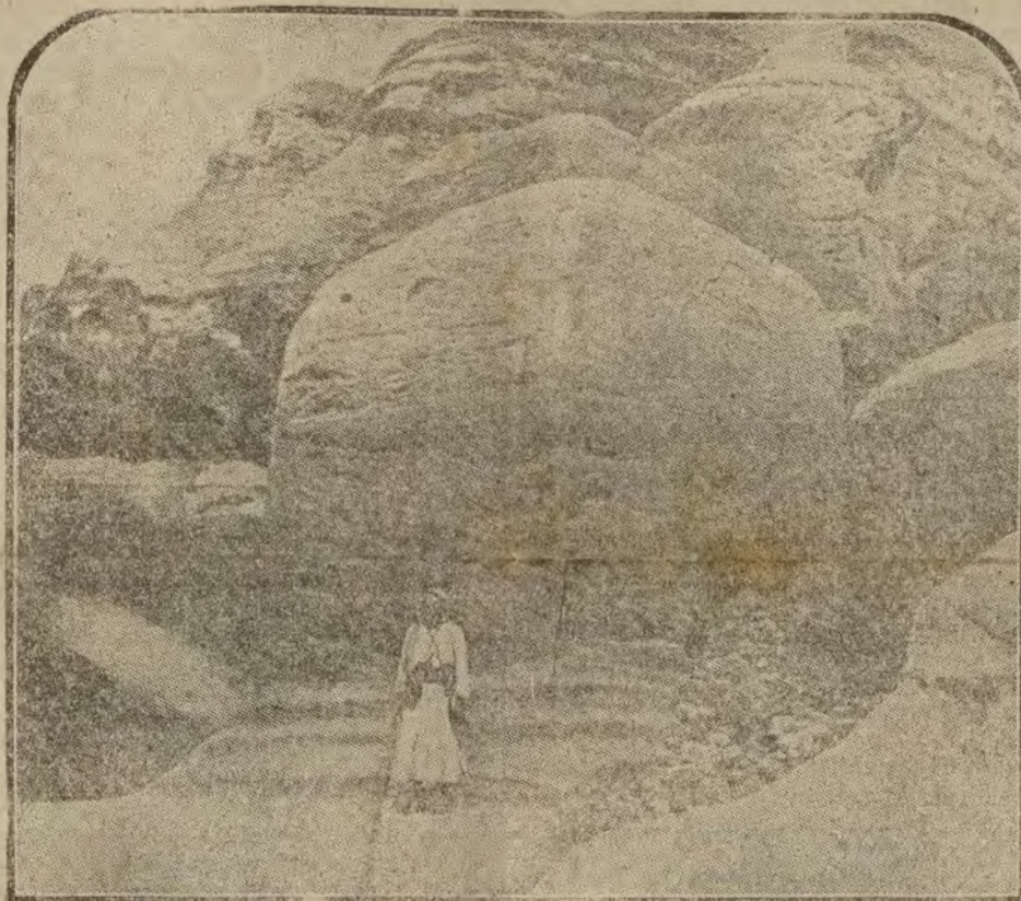
Una antiquísima tumba en Petra.

Al Sur de la Siria, a algunos kilómetros de Jerusalén, se encuentran las ciudades muertas de Djarrah y Petra, en cuyas ruinas se conservan hermosos vestigios de civilizaciones muertas, sombras nimbadas por la poesía de lo pretérito y el recuerdo de las ficciones poéticas que encarnaron sus mutilados monumentos.