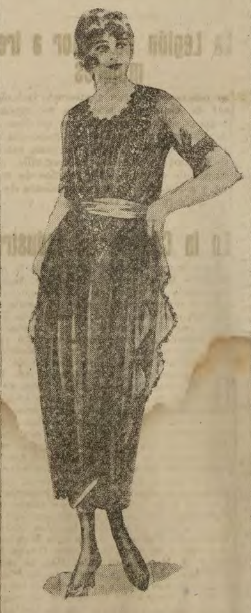
Traje de crepón con azabache.

La señorita Molina nos presentó en el primer acto una combinación más complicada: un traje de salón compuesto de seda blanca bordada, que es la falda un verdadero diábolo en combinación que se anuda en su amplitud de abajo arriba, y cuerpo, sin hombros, de