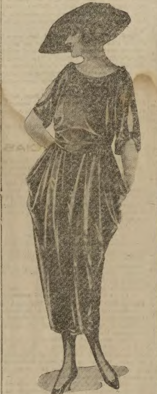
Traje de tafetán.

nostalgia oriental y la mujer sece gustosísima, sus combinaciones.