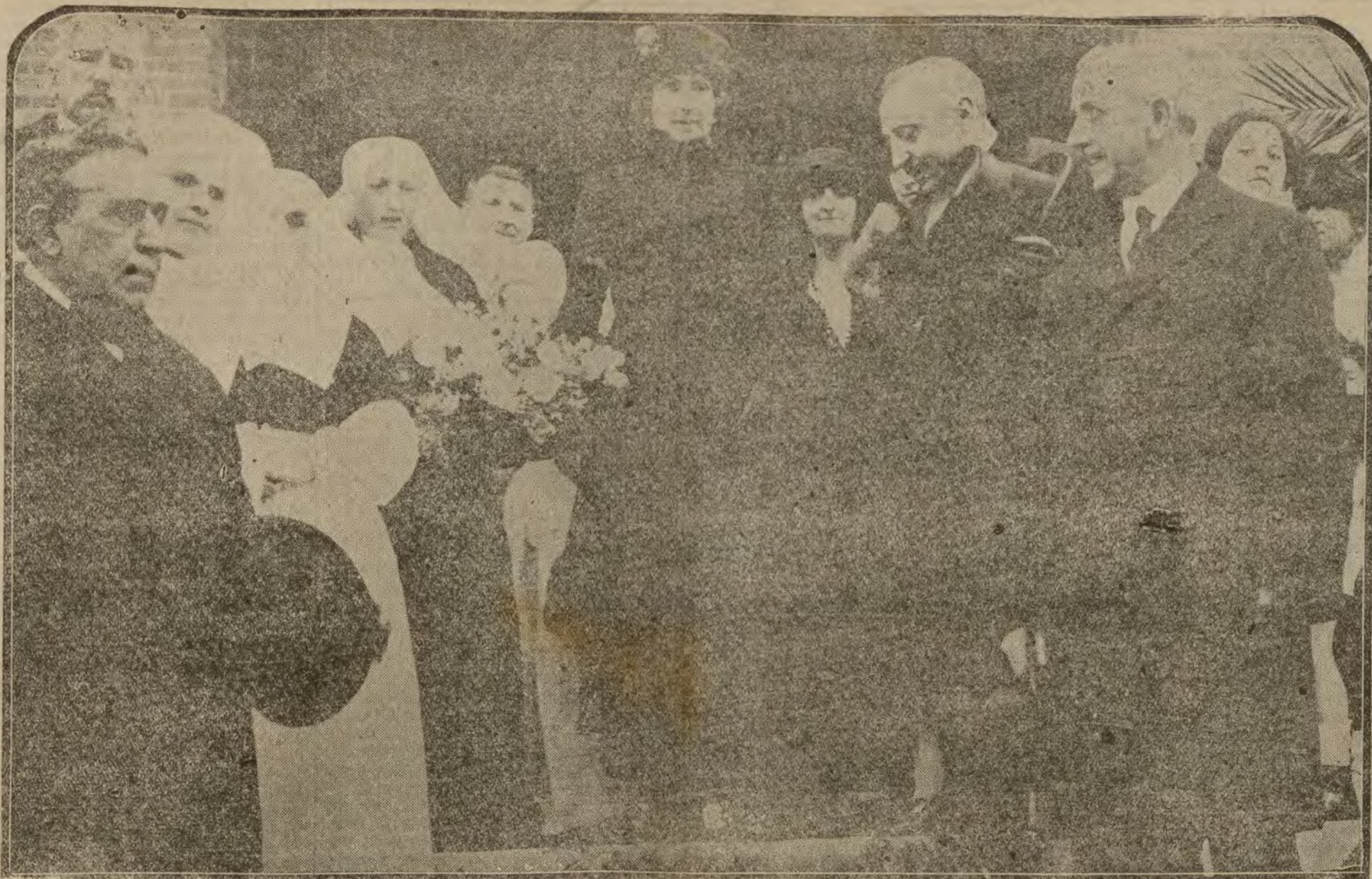
La reina Victoria saliendo esta mañana del Asilo de Ciegos del Pacifico, después de repartir comida entre los pobres de aquella barriada.