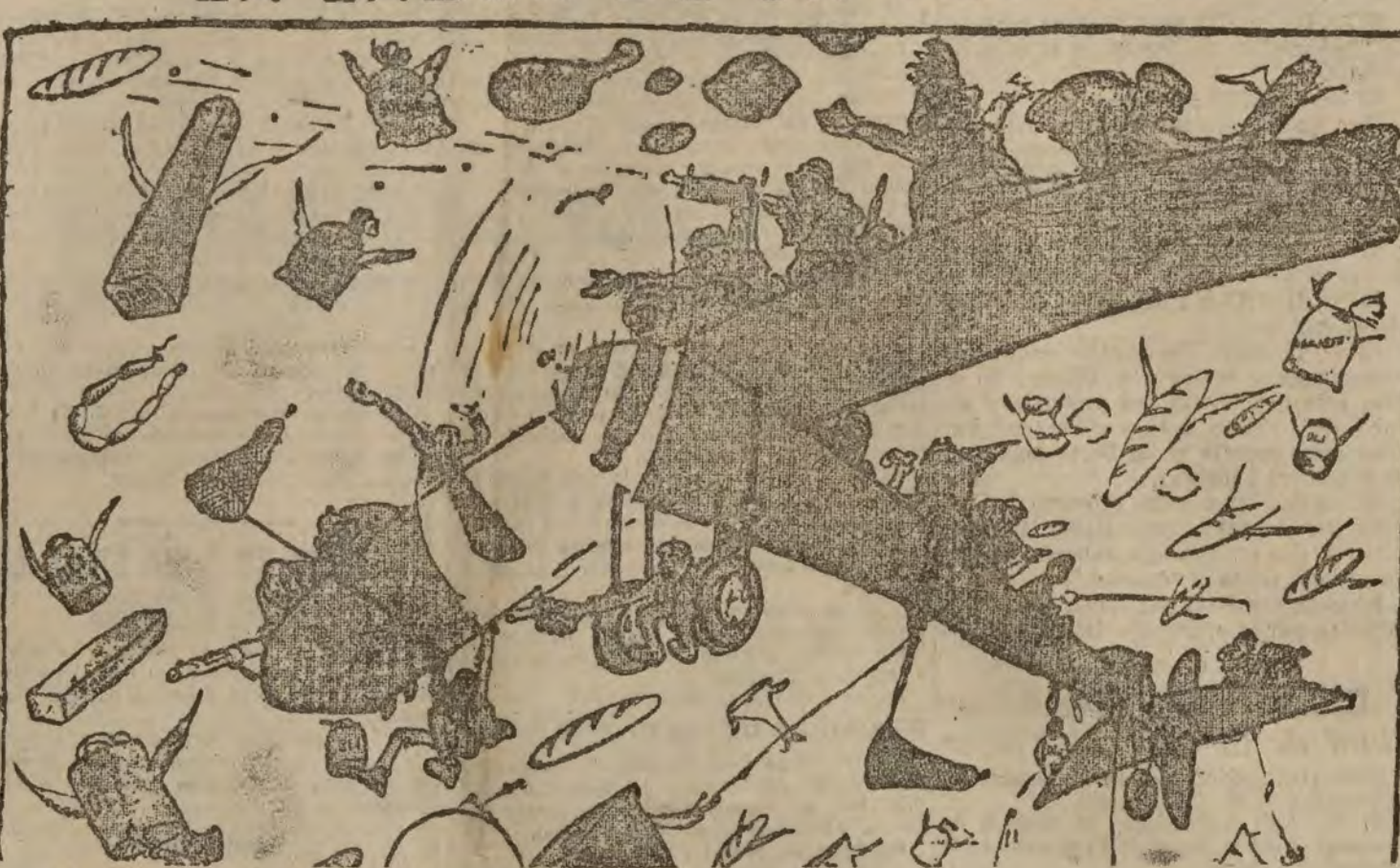
¡A los cuatro meses, todo por las nubes!