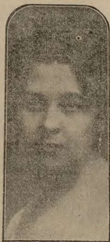
Aga Lanowska, célebre cantante que ha dado un artístico concierto en la Comedia.

Por otra parte, es un hecho evidente que los demócratas son suficientes para oponerse a la aprobación del Tratado, a menos que el artículo 10 fuera modificado. Todo parece indicar que la próxima campaña presidencial girará alrededor de la aprobación del Tratado.