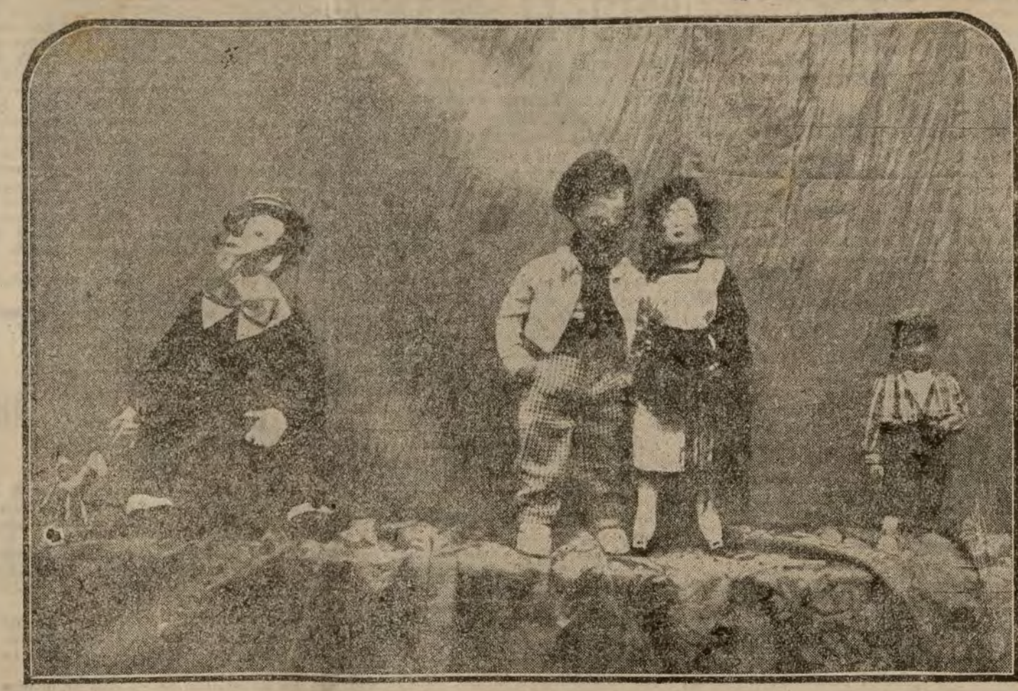
Manequines de Bartolozzi, que figuran en la exposición del VI Salón de Humoristas, inaugurado esta tarde.