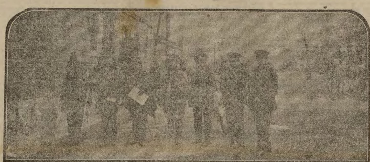
Los defensores de los procesados al salir de la cárcel, después del consejo de guerra.