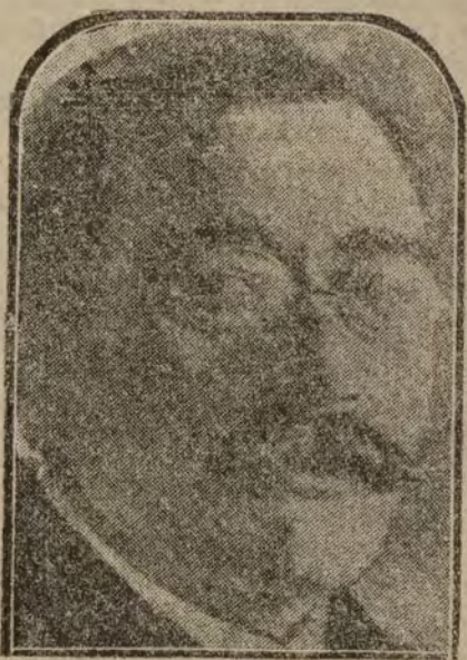
El ministro alemán Noke, que ha hecho importantes declaraciones respecto a la fuerza militar de Alemania.

—Desengáñate, hija, la mujer será siempre inferior al hombre; entre los dos sexos no puede haber paridad. —Bueno, hombre. ¡Pero no digas indecencias!