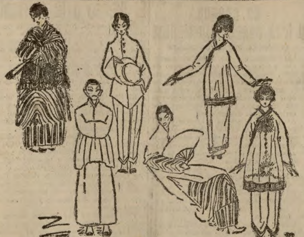
Varios personajes del interesante melodrama "Wu-Li-Chang", que se representa en el teatro Lara. (Apuntes del natural por Manuel Fontanals.)

La causa obedece a que la Empresa se ha implantado un salario mínimo. Parece que la huelga tiende a generalizarse a todos los metalúrgicos. Han salido para la Fielguera varias parejas de la Guardia Civil.