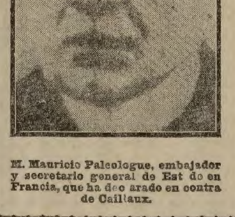
M. Maurice Paleologue, embajador y secretario general de Est do en Francia, que ha de arado en contra de Caillaux.