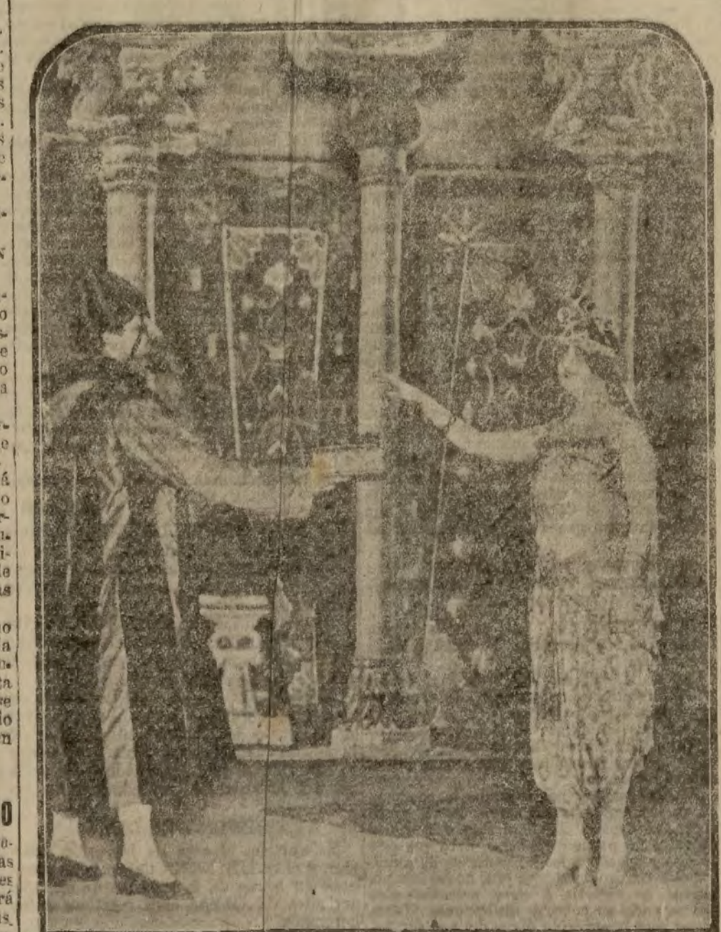
Una escena del cuento oriental "La cortisana de Omán", que se estrena esta tarde en Apolo.

Londres 4.—Se anuncia que se ha llegado a un acuerdo en principio entre las Empresas y los empleados de transportes urbanos. El martes próximo se celebrará una reunión bajo la presidencia del ministro inglés del Trabajo, en la que se se puntualizarán las bases de arreglo. Por tanto, el peligro de huelga parece momentáneamente conjurado.