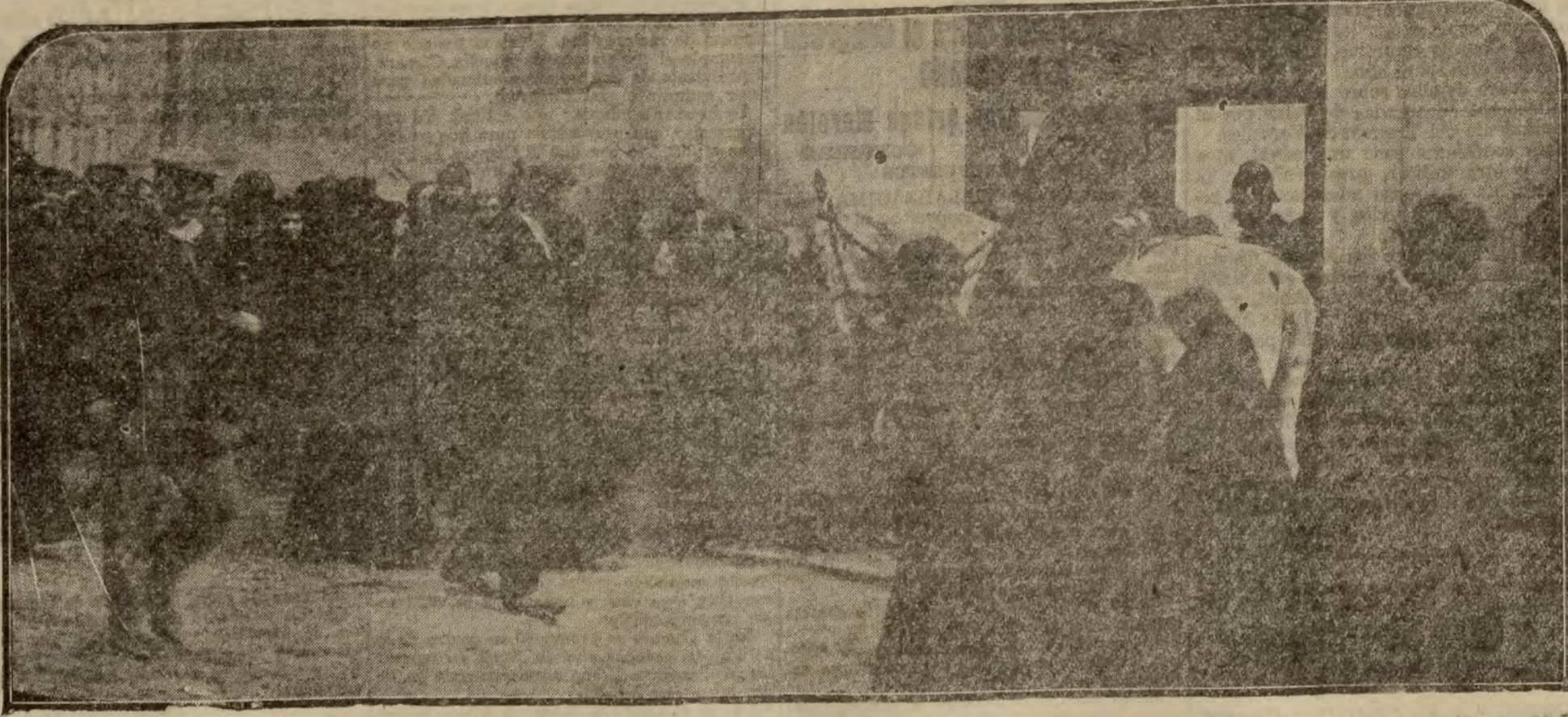
La fuerza pública conteniendo la entrada de los fieles, que esta mañana, como viernes de Cuarema, han acudido a la Iglesia de Jesús, donde se venera el Cristo de Medinaceli.

Cuarto. El personal de la Comisaría de Abastecimientos trabaja todos los días por mañana y tarde hasta bien entrada la noche, percibiendo una remuneración modestísima, y ahora