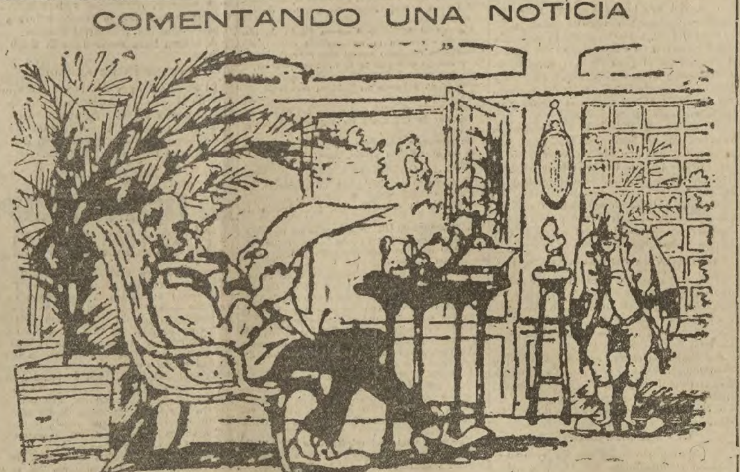
—Pero estos prietistas están locos! Mire usted que querer ser ministro Manuel Portela entrando en Palacio esgrimiendo un cuchillo...

PARIS 8.—La "Chicago Tribune" publica las siguientes declaraciones del mariscal Foch a un redactor de dicho periódico, a propósito de la Liga de las Naciones: "No puedo dar mi opinión—ha dicho—sobre una cosa inexistente. La Liga de las Naciones es una bella concepción; pero nada más. Existe su nombre; eso es todo. Yo estimo que la seguridad de mi país puede estar asegurada únicamente por garantías tangibles, y tengo más confianza en los hechos que en las teorías idealistas. Examinando la situación presente, pienso que Francia puede ahora menos que nunca excusarse de garantías tangibles."