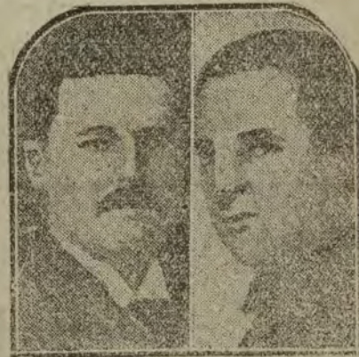
Muller, ministro de Estado del Gobierno lego, que conquistó al Poder, y el general von Oldershausen, que parlamentó con la bigada nava, primera fuerza que asaltó Berlín.

Por lo que se dice, parece ser que se acordó declarar la huelga de brazos caídos.