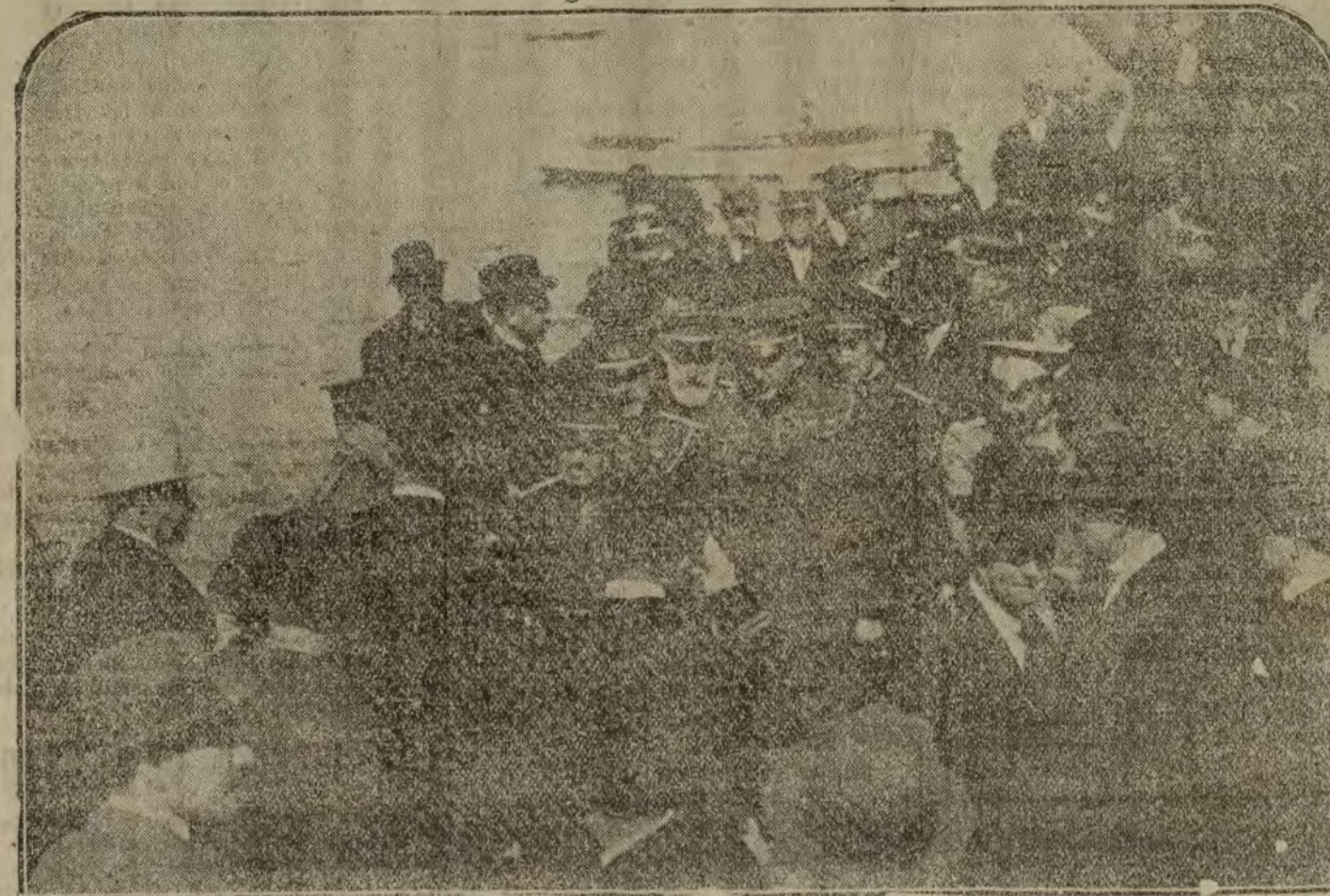
El capitán general de Cataluña, D. Valeriano Weyler, en el acto de la inauguración de la nueva línea de ferrocarril de Madrid.

Santander 19 (9 m.).—Mañana es esperado en este puerto el vapor "Mar Mediterráneo", con cargamento de trigo argentino, consignado a la Junta Provincial de Subsistencia.