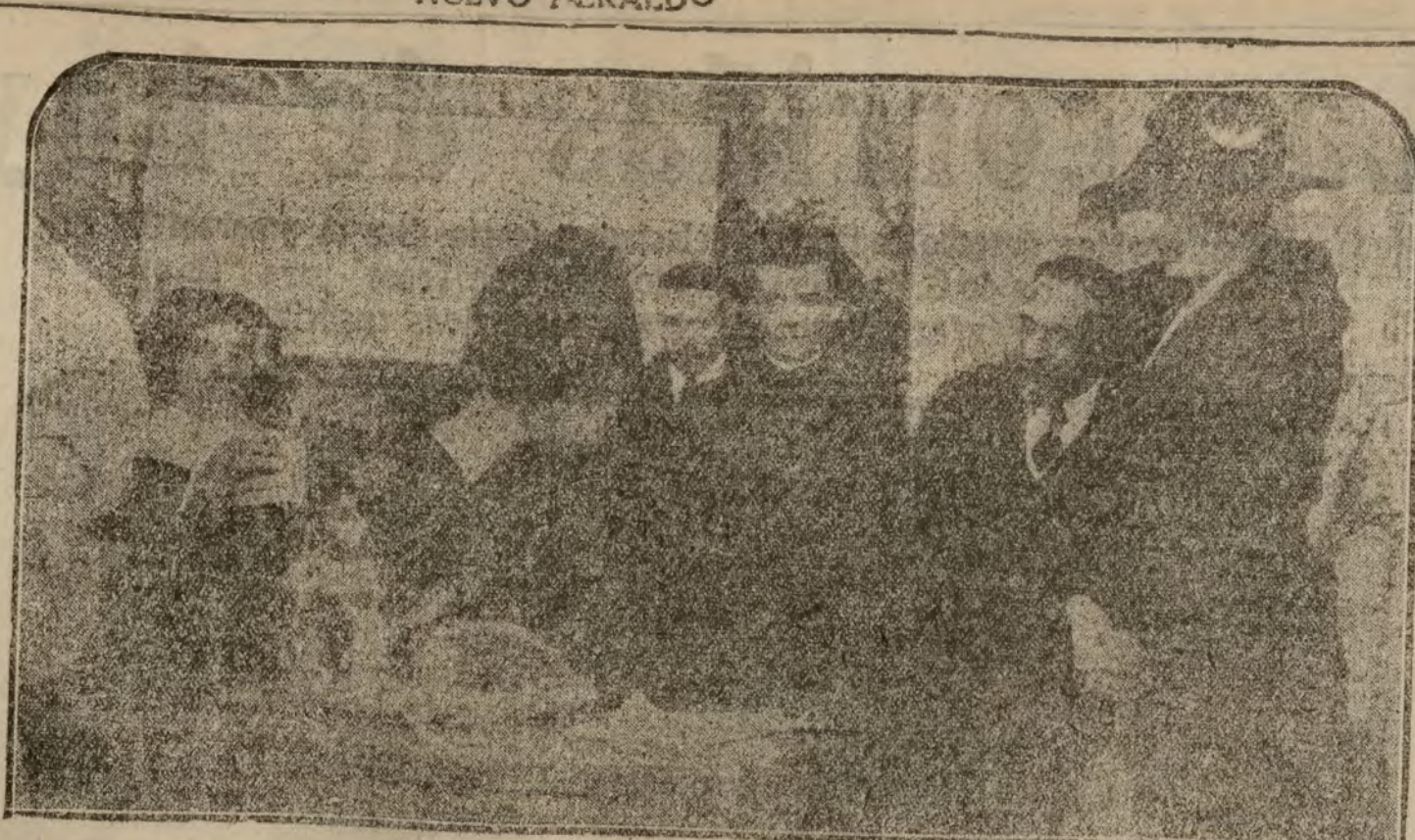
SS. MM. las Reinas, firmando en esta notaría la colocación de la primera piedra del Orfanato de las Escuelas Salorianas, para huérfanos de obreros.

Después de esto se suspende la audiencia.