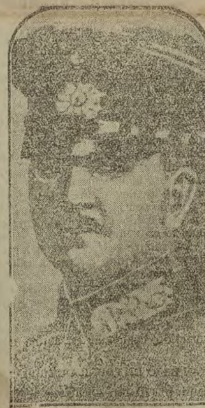
El general von Koch, designado por Hoffmann para ejercer la dictadura militar en Munich, donde permanecerá a reubicados y espartagustas, se dispuso a una lucha sin tregua.

Los escándalos de "permisos ilegales" están pidiendo a gritos una ejemplaridad. La "chusma enlevitada" que se enriquece a costa de las hambres públicas debe ser conocida del explotado pueblo. Vengan, pues, esos nombres y acabe de una vez el escándalo de los permisos.