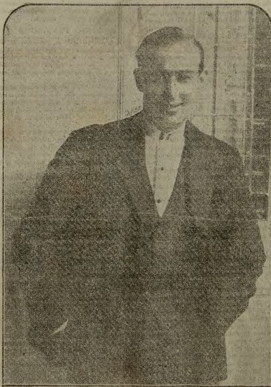
“Joselito”, el afortunado, a quien espera “la afición”.