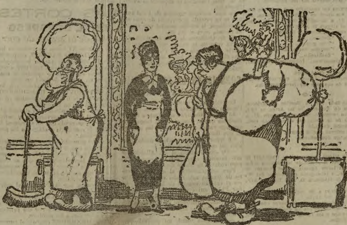
—De sangre azul! Eso sería antes... Ahora son hombres y mujeres como los demás... ¡Si lo sabrá una!