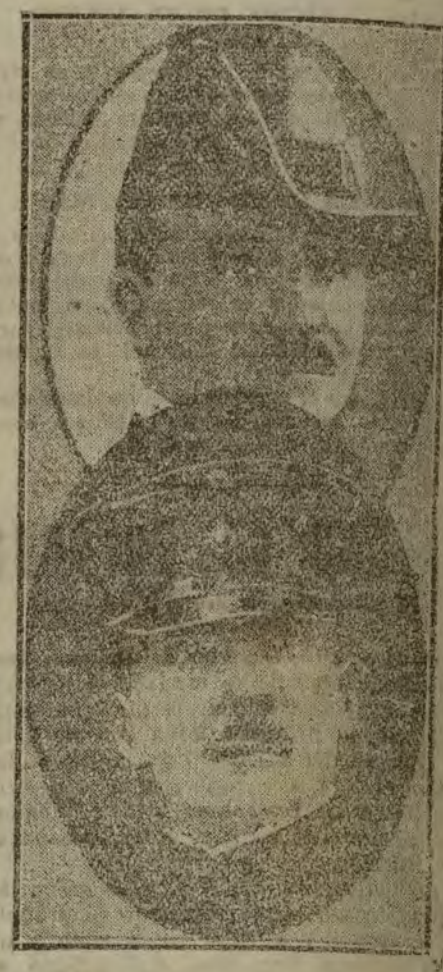
Arriba: General von Lettow-Vorbeck, jefe de la tropa de von Kapp, que sublevó los tropas de Lubeka.

El presidente del Consejo, M. Millerand, asistió a la sesión.