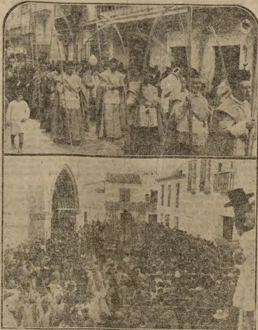
Primero.—La tradicional procesión de las Palmas, por los alrededores de la Catedral. Segundo.—Nuestra Señora de la Hiniesta saliendo de su parroquia.

Roma 30.—La escuadrilla aérea del capitán Gorioco, que toma parte en el raid de una locomotora, cortaron la retirada a los asaltadores, y ayudados por policías a Adalia.