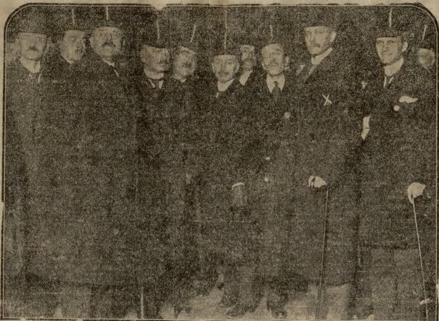
El nuevo embajador de Francia en Madrid, M. Saint-Aulaire (X), a su llegada anoche a la Estación de Norte.