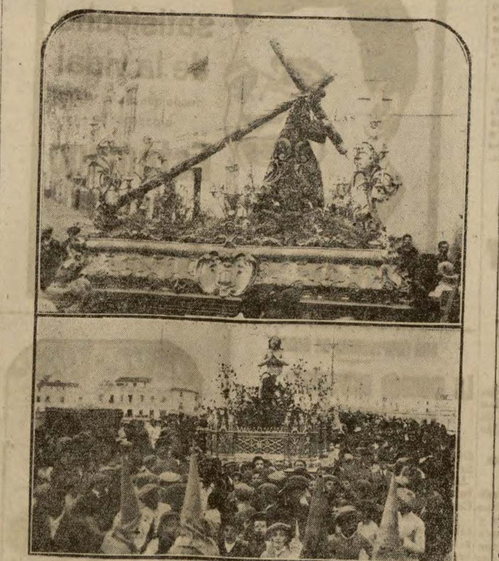
1.º Nuestro Padre Jesús de las Penas, a su paso por la plaza de Pilatos. 2.º Paso de una cofradía por el puente de Triana.