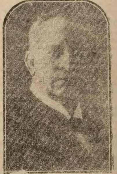
Zahle, jefe del Gobierno danés, destituido por el Rey Cristian.