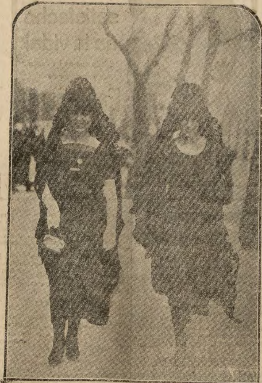
Dos bellísimas señoritas recorriendo las estaciones.

La Subsecretaría del Ministerio de Estado facilita nota de las siguientes defunciones de súbditos españoles, ocurridas en el extranjero: En Chalans (Marne) ha fallecido Manuel Marco Borea, natural de Benaguacil (Valencia), el día 7 de Enero último. El cónsul de España en San José de Costa Rica participa el fallecimiento del súbdito español Manuel López Rodríguez, ocurrido en San Pablo de Paraisal, de aquella República, el 5 de Enero del presente año.