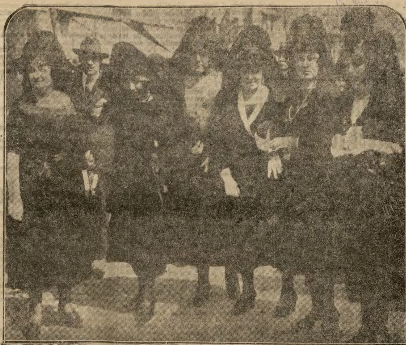
Grupo de señoritas recorriendo las iglesias esta tarde.