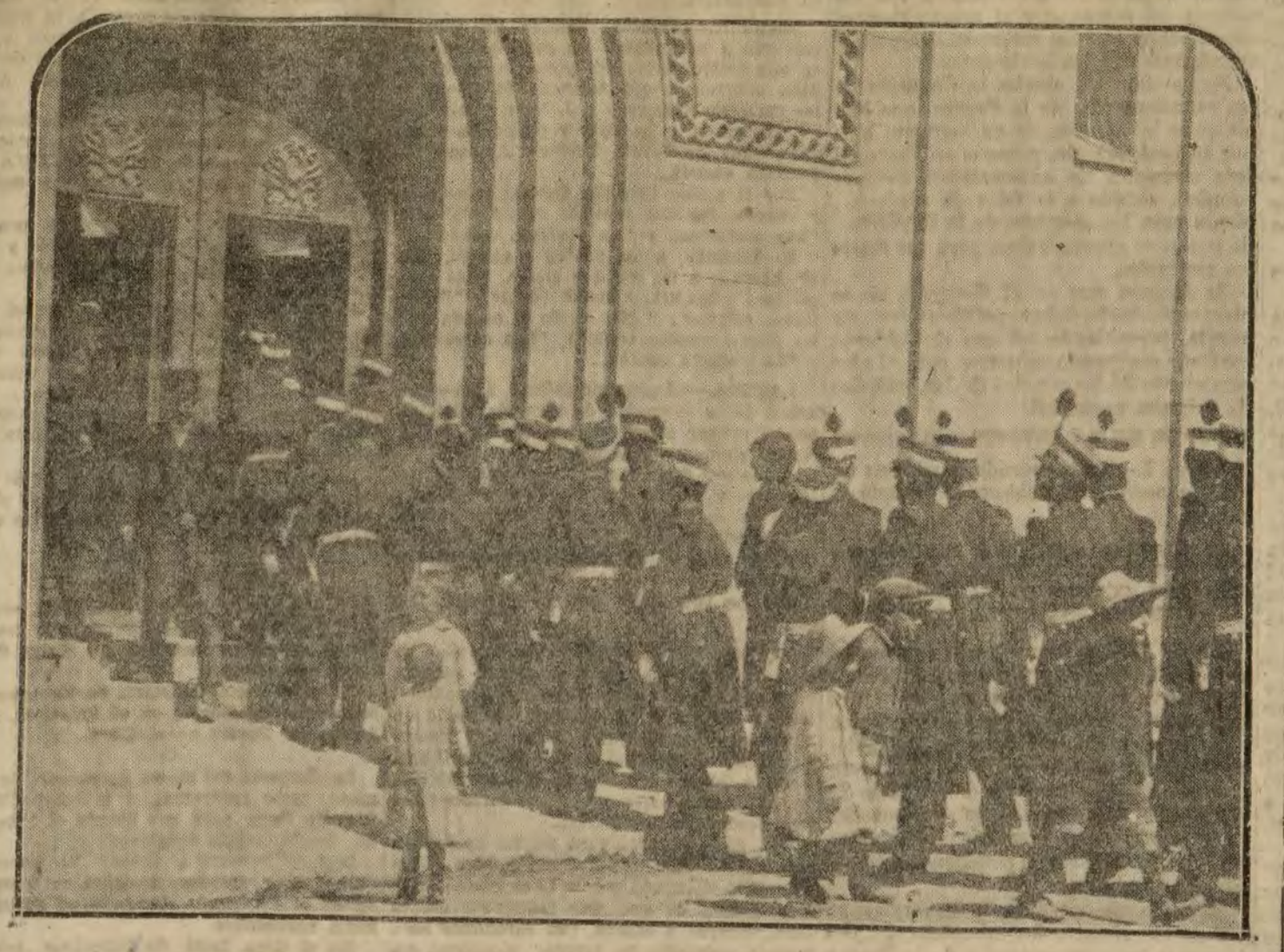
Soldados de ingenieros recorriendo las estaciones esta mañana.