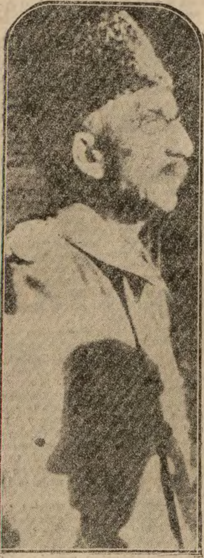
Mehmed VI, Sultán de Turquía, conde ha estallado la revolución.

También dijeron que una consignación aprobada de 47.000 pesetas para dicha fundación ha sido sustraída por la Comisión noveladora.