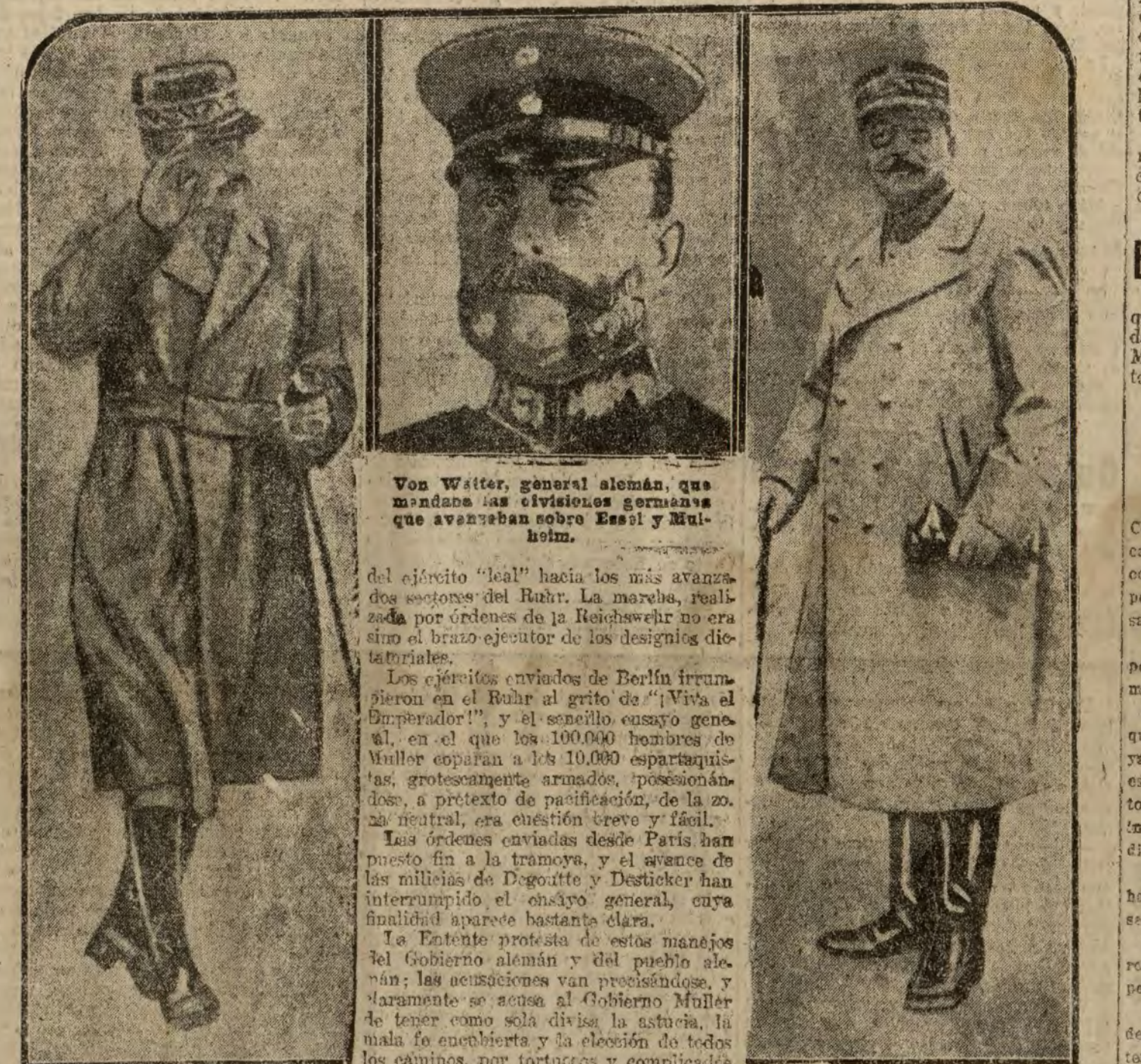
Von Witter, general alemán, que mandaba las divisiones germanas que avanzaban sobre Essen y Mülheim.

del ejército "leal" hacia los más avanzados sectores del Ruhr. La marcha, realizada por órdenes de la Reichswehr no era sino el brazo ejecutor de los designios dictatoriales.