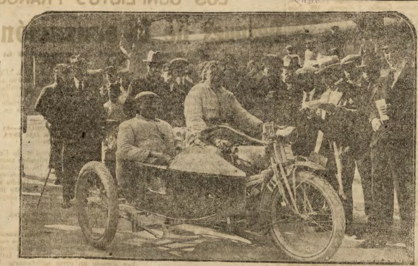
Barcelona.—“Carrera motorista”, vuelta a Cataluña, organizada por el Real Moto Club Un “side-car” en el momento de darle la salida.