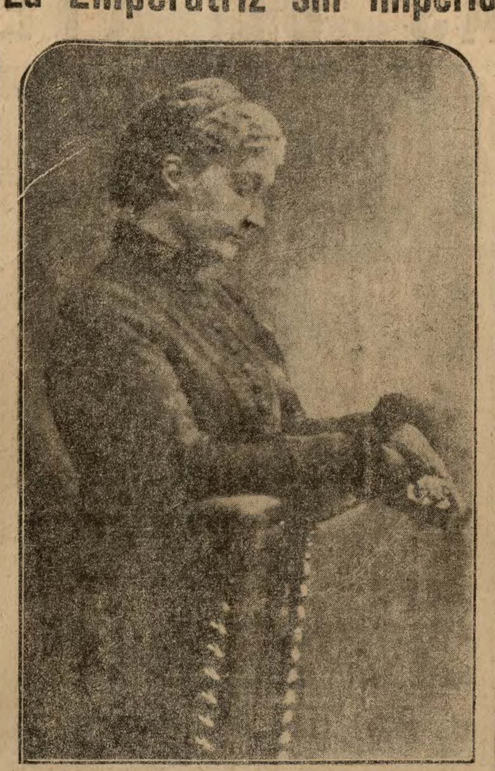
El último retrato de la Emperatriz Eugénie

"La Emperatriz Eugénie, que contenía en su residencia de Cap Martin, muy bien de salud, se propuso venir en breve a España para pasar una temporada en su querida y nunca olvidada patria.