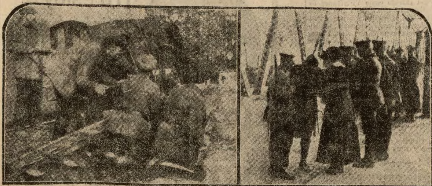
La guerra alemana del Rhur, alterada por los recientes sucesos, ha sido testigo de escenas que rememoran las escenas de la guerra. La escuela del conflicto europeo lleva a las luchas sociales toda su asperidad. Rápidamente se levantan hoy en las calles de una revuelta ciudad alambradas y artefactos guerreros, que transforman el antiguo aspecto de las barriadas; a los elementos primitivos que las constituían sustituyen hoy los carros blindados, los fosos guerriceros, verdaderas trincheras de batalla. Recordamos dos interesantes aspectos de la zona alemana. De izquierda a derecha: Soldados del ejército rojo parapetados tras de un carro blindado. Fuerzas de la misión aliada de ocupación ejerciendo el control sobre los pasajeros que se trasladan a la orilla opuesta del Rhur.