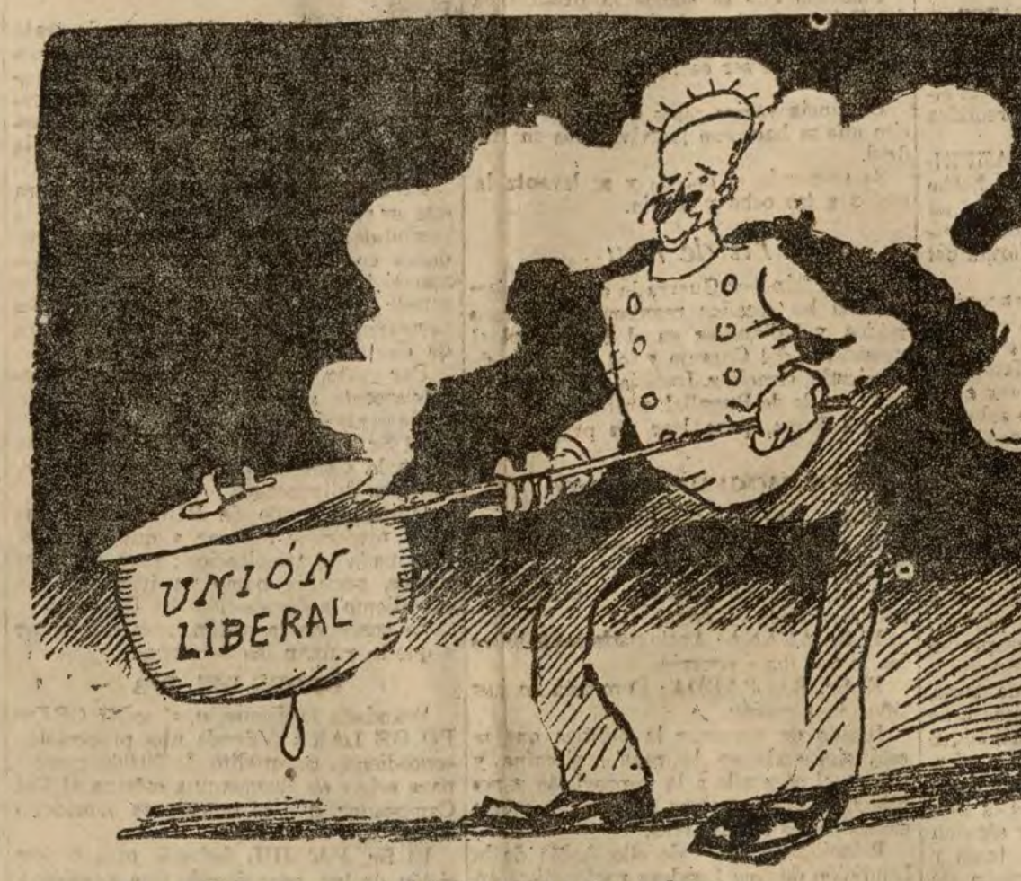
—La verdad es que soy el único para estos guisados.