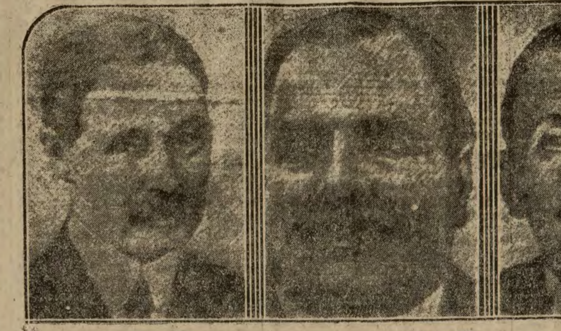
Bonar Law, que sustituyendo a Lloyd George en el Congreso Supremo de aliados, ha suavizado la tensión entre Francia e Inglaterra.