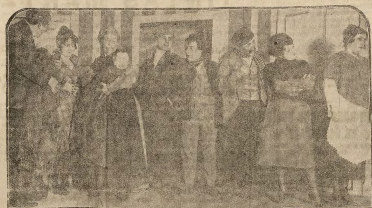
Escena final de la obra "La Pelusa o El regalo de Reyes", que se estrena esta noche en el teatro de la Latina.

A la entrada será preciso la presentación de la cartilla de asociado.