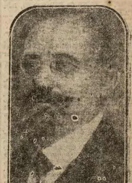
El canciller austriaco Renner, que en su gestión personal realizada en Roma, ha obtenido de Italia importantes concesiones para Austria.

Las negociaciones de Italia con Austria están en un período de franca suavidad. Austria eligió con acierto su representante; el conde Renner ha realizado una acertada gestión personal cerca del