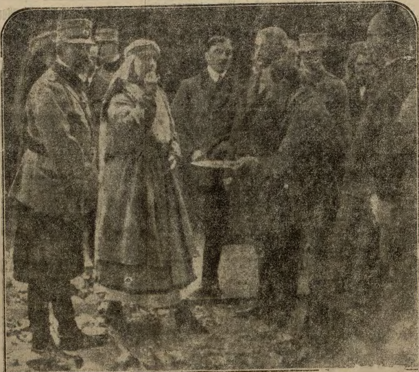
La reina María de Rumania, en su visita a Transilvania. —Al llegar a la estación que confina con el Banato, fiel a los ritos nacionales, toma el pan y la sal que la ofrecen las autoridades comunales, como pacto de amistad.

La joven República yugoslava, que combate diplomáticamente con Italia la enconada posesión de Fiume, tiene ante su joven Constitución otro problema no menos importante: la reclamación enérgica del Banato, que incorpora a su derecho Rumania, en virtud de las afinidades étnicas y geográficas existentes entre el remado baltánico y la antigua provincia húngara.