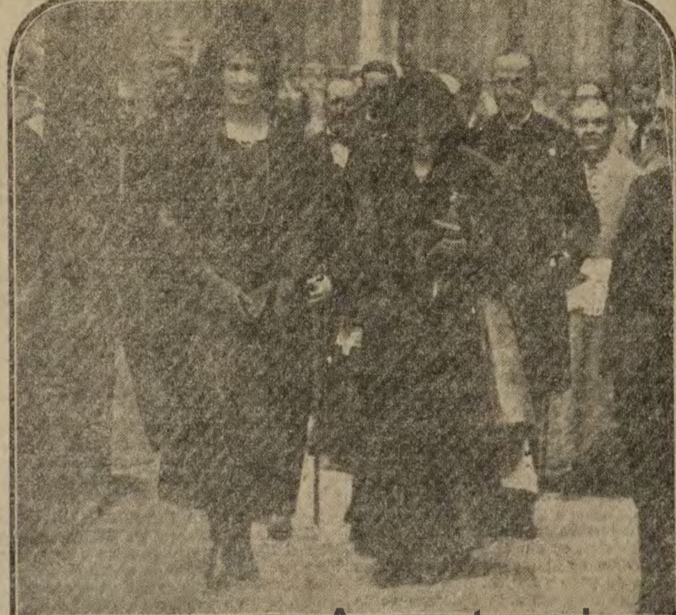
La Reina Victoria al salir ayer mañana de su casa en la Estrella.

En los centros autorizados se deplora que los Estados Unidos no participen en la Conferencia.