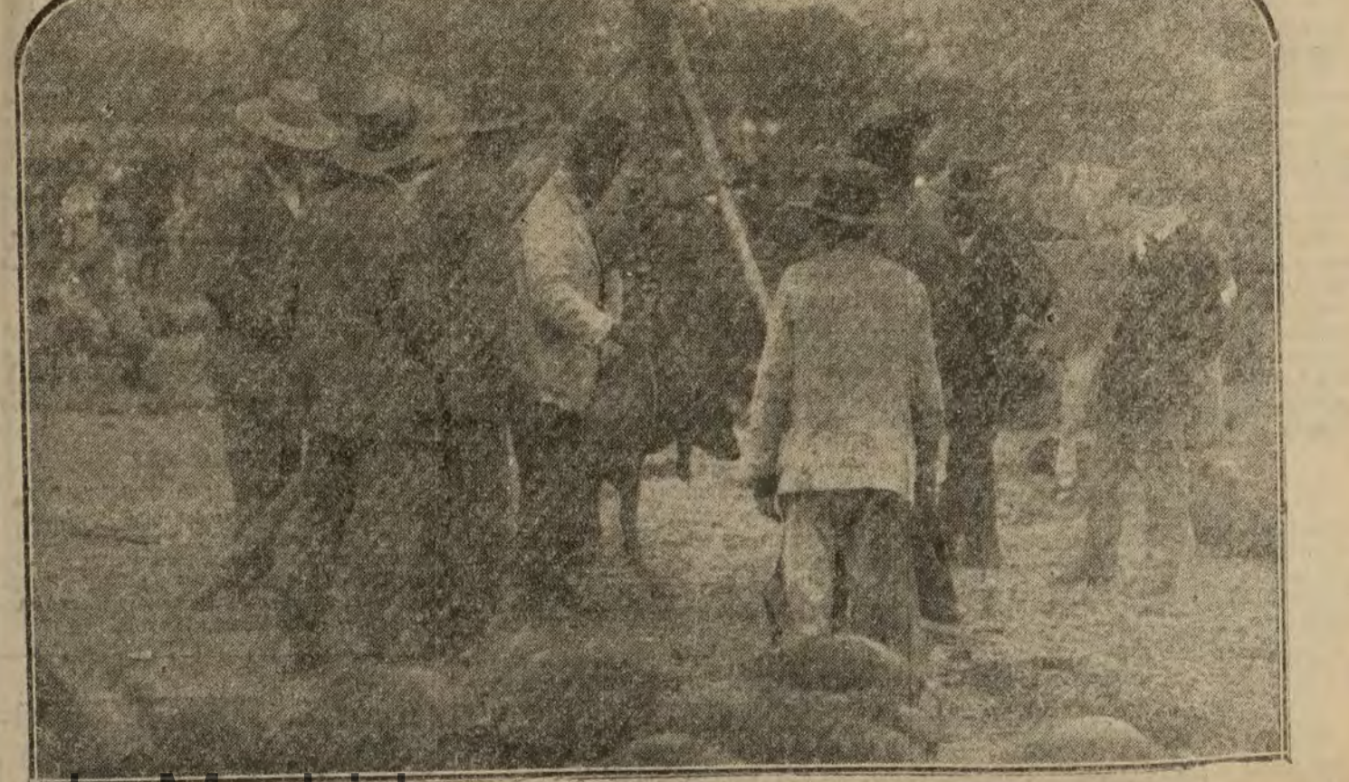
Los muchachos de ganado pesando un cerdo en el teso.