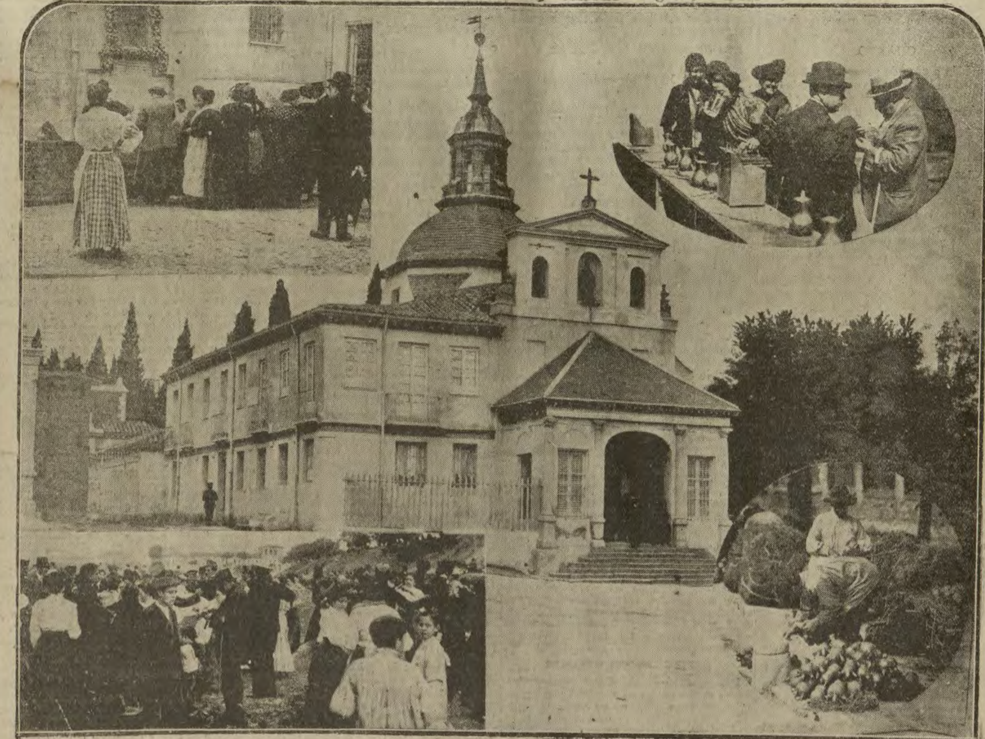
La feria del Santo. Bailando en la plaza. Baile de botijos.