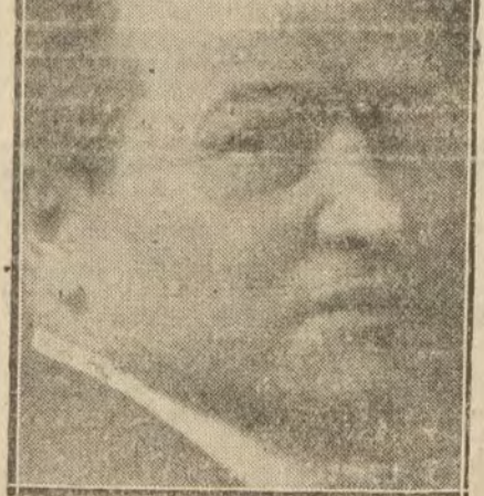
Segismundo de Nagy, ilustre pintor húngaro.

En Segismundo de Nagy las pinceladas son violentas y rebeldes.