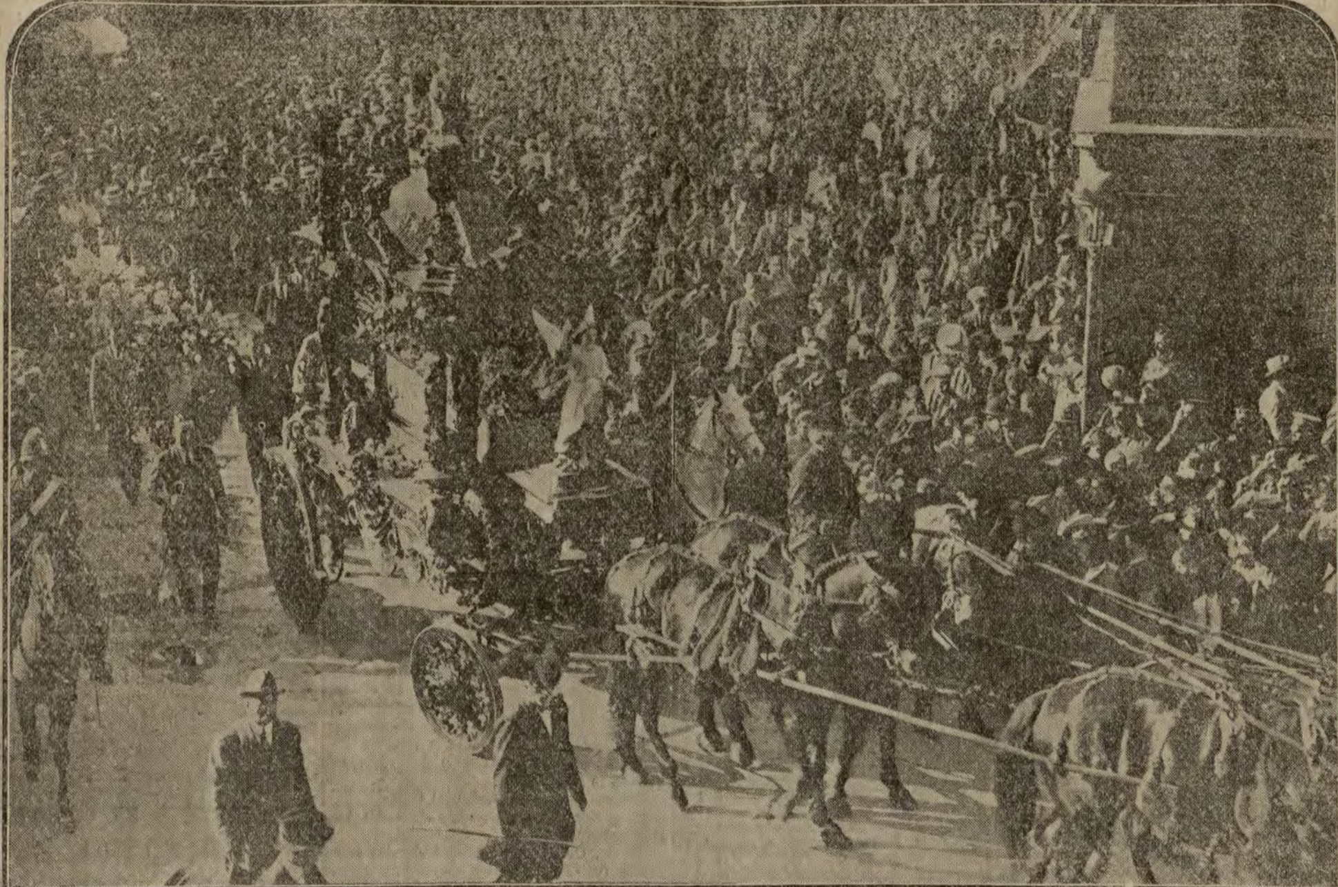
El entierro de Joselito al entrar en la calle del Arenal.