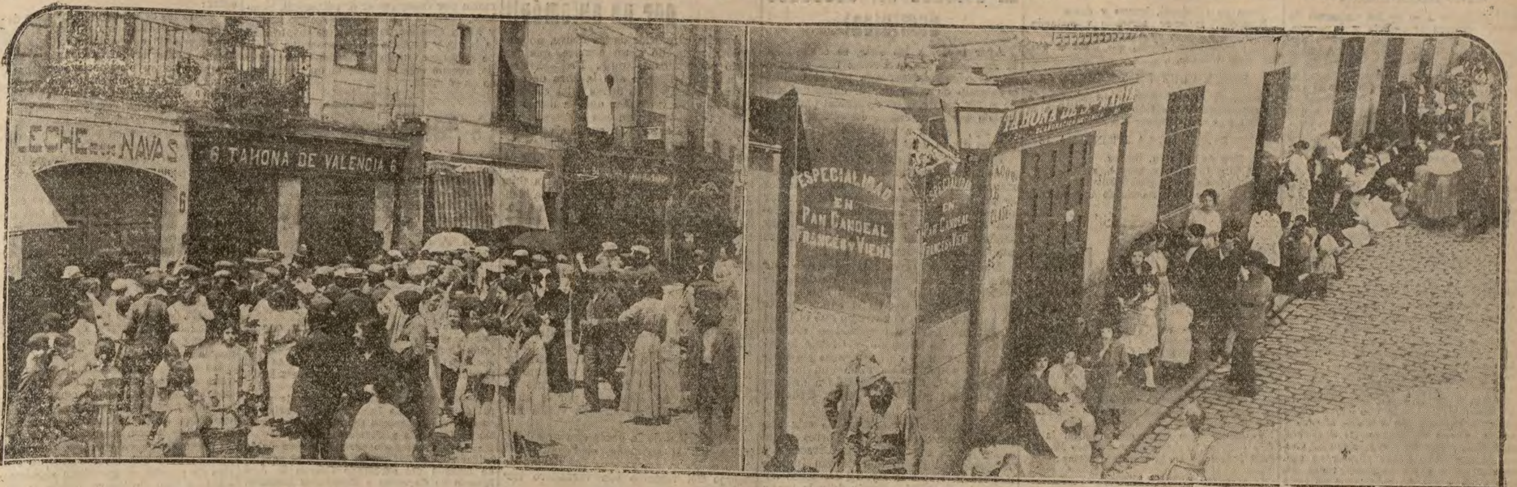
El público madrileño, obligado a hacer "cola" desde las cuatro de la madrugada en las tahonas para poderse proveer de un poco de pan.