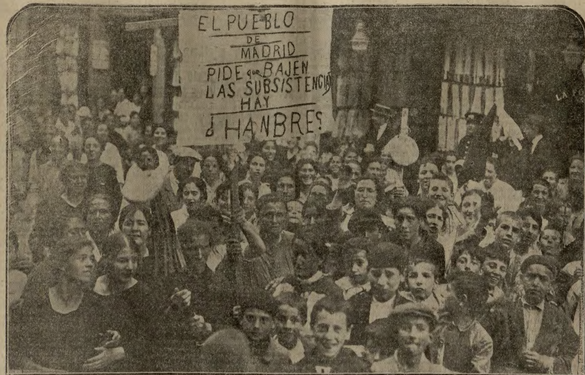
Un numeroso grupo de mujeres del pueblo que, en la imposibilidad de adquirir pan que dar a sus hijos, se han lanzado a la calle para demandar a voces que cese la huelga de autoridades, única responsable del conflicto.