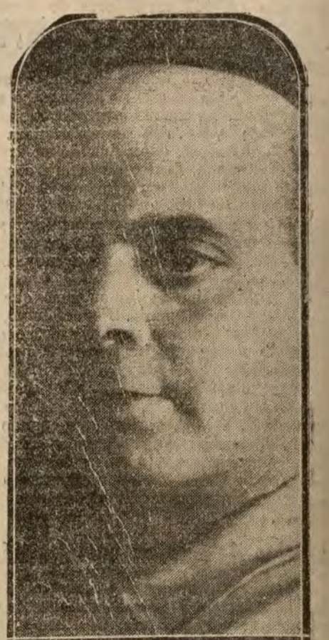
José Pedraza Astos, ilustre pintor que ha inaugurado una Exposición de sus obras en el salón permanente del Círculo de Bellas Artes, y que está siendo muy celebrada.

Y la canalla explotadora, la "ralea" zulesca, encantada de operar libremente con unas "autoridades" como Viguri, Grijalba y Limpias, que no se enteran de nada, y que cuando se enteran valía más que no se enterasen.