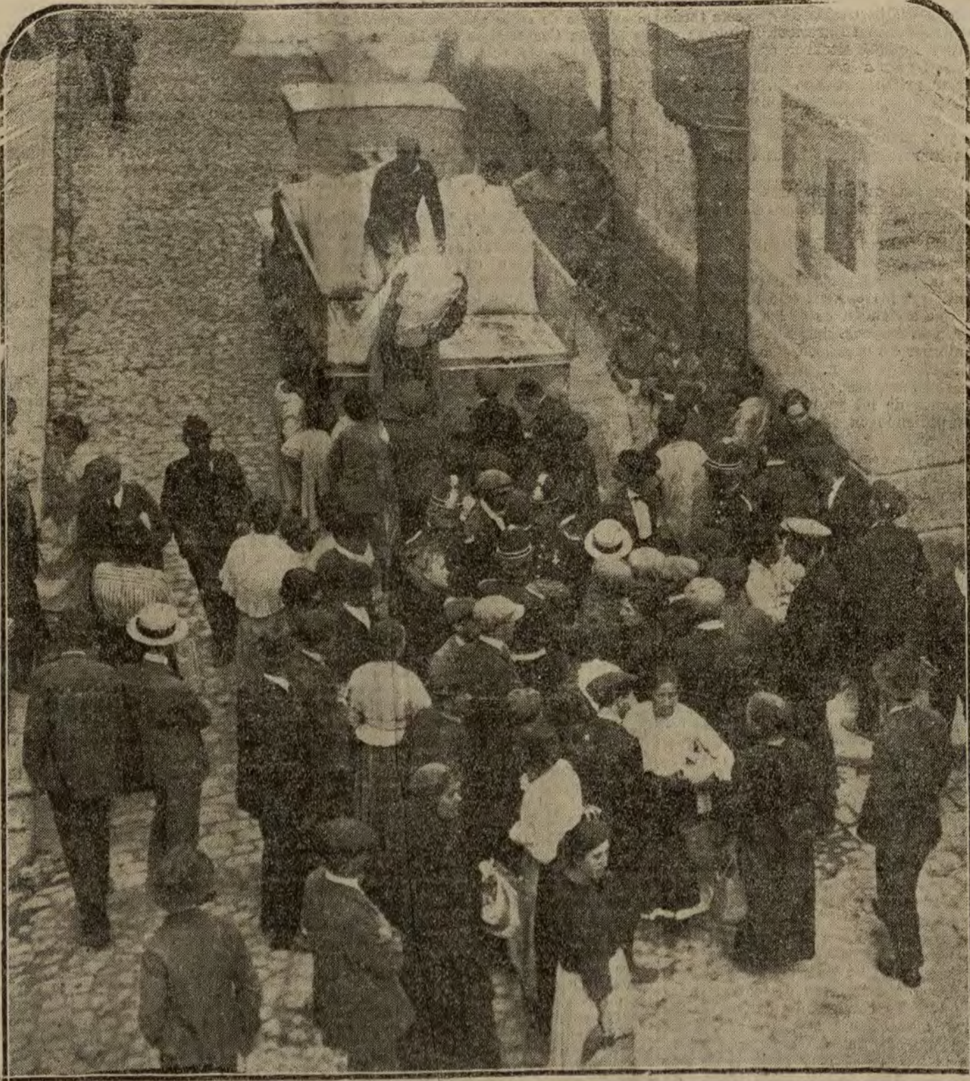
El público comentando los sucesos, a la puerta de la tahona establecida en el número 10 de la calle de la Cabeza, desde cuyo interior hicieron fuego un cabo y dos soldados del regimiento de Covadonga.

Berlín 20.—En vista de que la Conferencia de Spa se va a celebrar el 21 de julio, el Gobierno del Imperio tiene el propósito de autorizar al presidente, Fehrenbach, a que convoque al Reichstag inmediatamente después de las nuevas elecciones, o sea del 10 de junio.