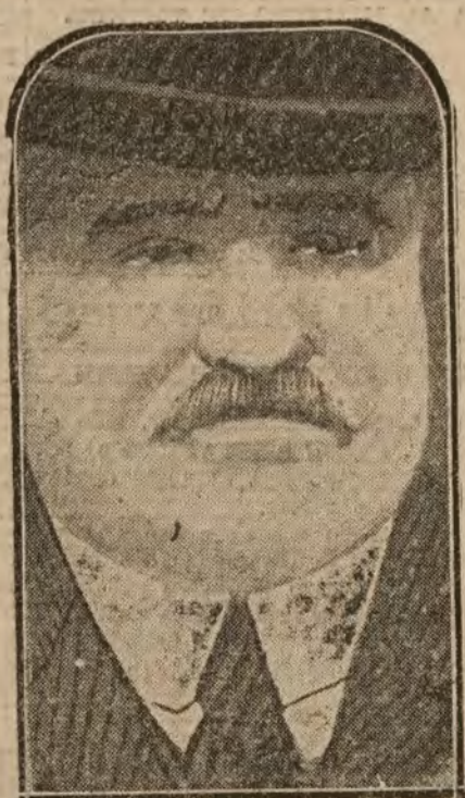
El diputado León Daudet, que en la Cámara francesa ha pronunciado un discurso contra el movimiento obrero de su país, inspirado en los mismos sentimientos de intransigencia nacionalista que le dieron traste fama durante la guerra.

Al fin y al cabo todas esas cosas tan alarmantes, que ahora corren, se la debemos a su incomprensión.