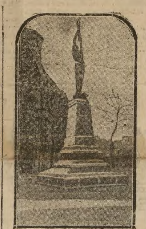
La estatua a Ferrer, nuevamente levantada en Bruselas, más como símbolo que como homenaje personal.

Presidencia e Interior, Nititi. Negocios Extranjeros, Scialoja. Colonias, Rubini. Tesoro, Schanzer. Hacienda, De Nava. Obras Públicas, Peano. Agricultura, Mitchell. Industria, Addiato. Justicia, Paleoni. Marina, Pochi. Instrucción, Torre. Correos, Aratorre. Territorios liberados, Lopegna.