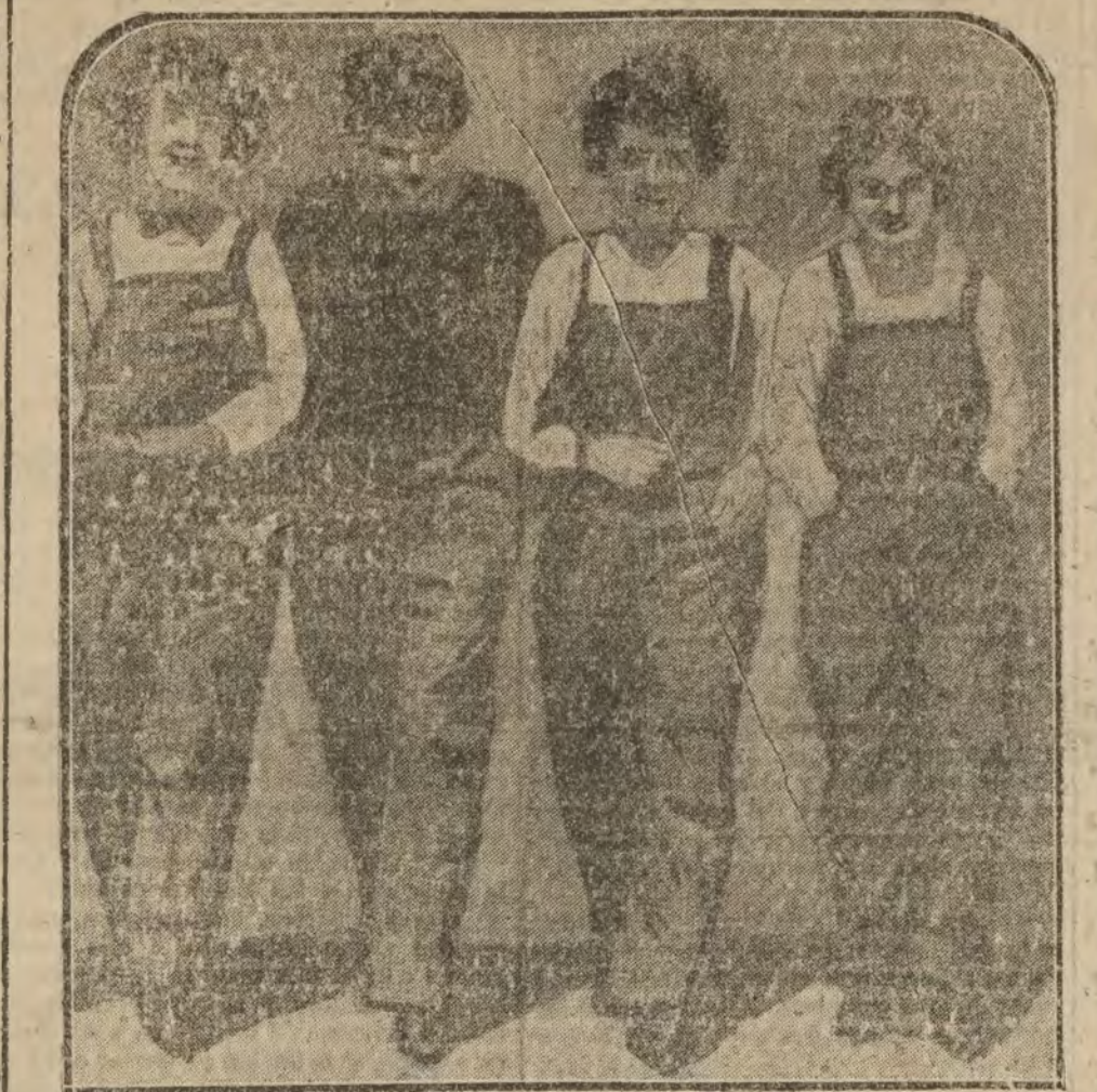
Cuatro señoritas, secretarias de diputados norteamericanos, que han adoptado el traje popular como protesta con la avaricia de los comerciantes. El nuevo aseo americano consiste en traje obrero de mecánica, alpargata y la cabeza descubierta.