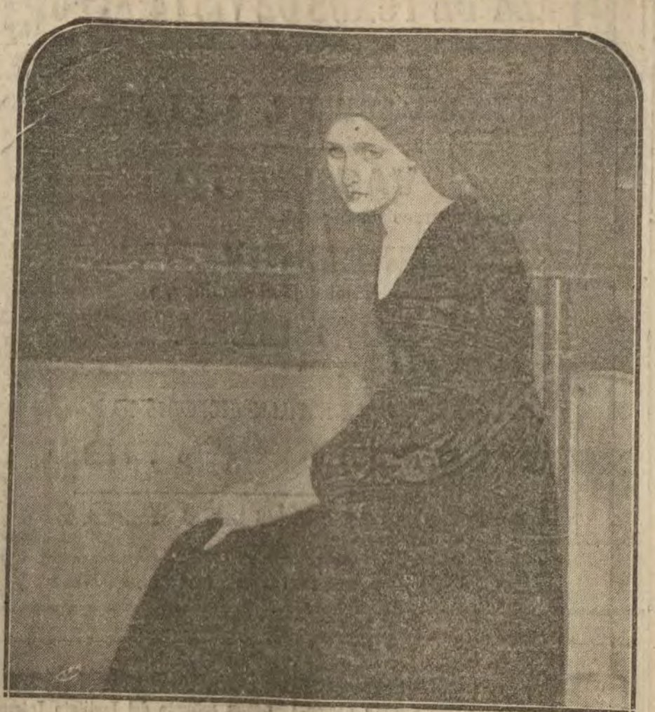
"Anunziata", cuadro de D. Manuel Álvarez de la Fuenlabrada