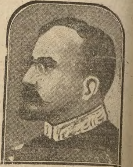
M. Reukin, ministro de la Gobernación del Gobierno belga, que ha presentado la misión manifiestamente adversaria respecto de la Entente con Holanda y enemigo de la política de benevolencia extranjera seguida por el Gobierno a que pertenecía