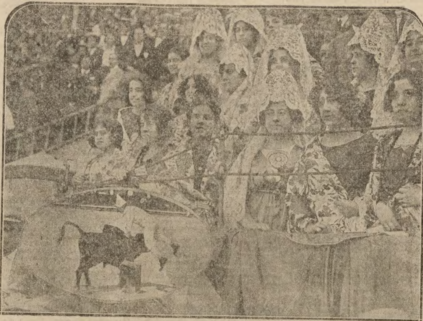
Aspecto de una grad, durante la b cerrada del Montepío del Comercio. (En el óvalo) la suíte del paraguas

Pérez Rivera toró embarrillado con la muleta al toro de Vaquerito, que ahuachaba mucho por el lado izquierdo, y entrando rápidamente y alargando el brazo le colocó un estoqueazo en el efecto fulminante. Al segundo de la tarde le toró valiente por verónicas, entre las que intercaló un farol, oyendo aplausos;