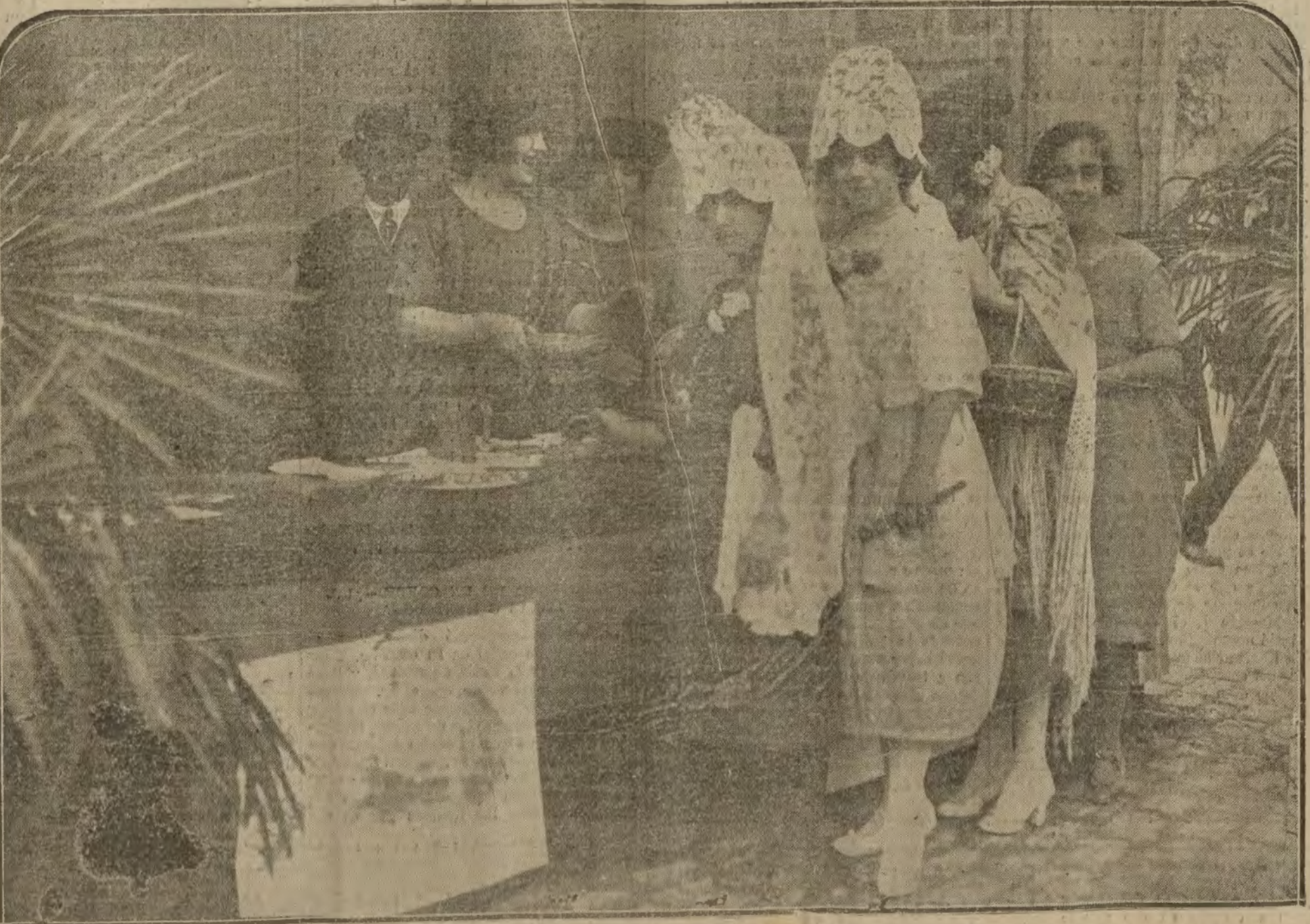
Una mesa petitoria en los Cuatro Caminos

En resumen, la fiesta de la flor, todo lo mejor que humanamente puede resaltar una obra como esta de amor y de caridad.