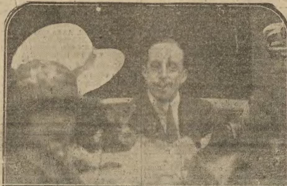
S. M. el Rey, asediado por las señoritas que han postulado en los alrededores de Palacio.

La disciplina se perdió un momento, y jefes y subordinados se escondían por