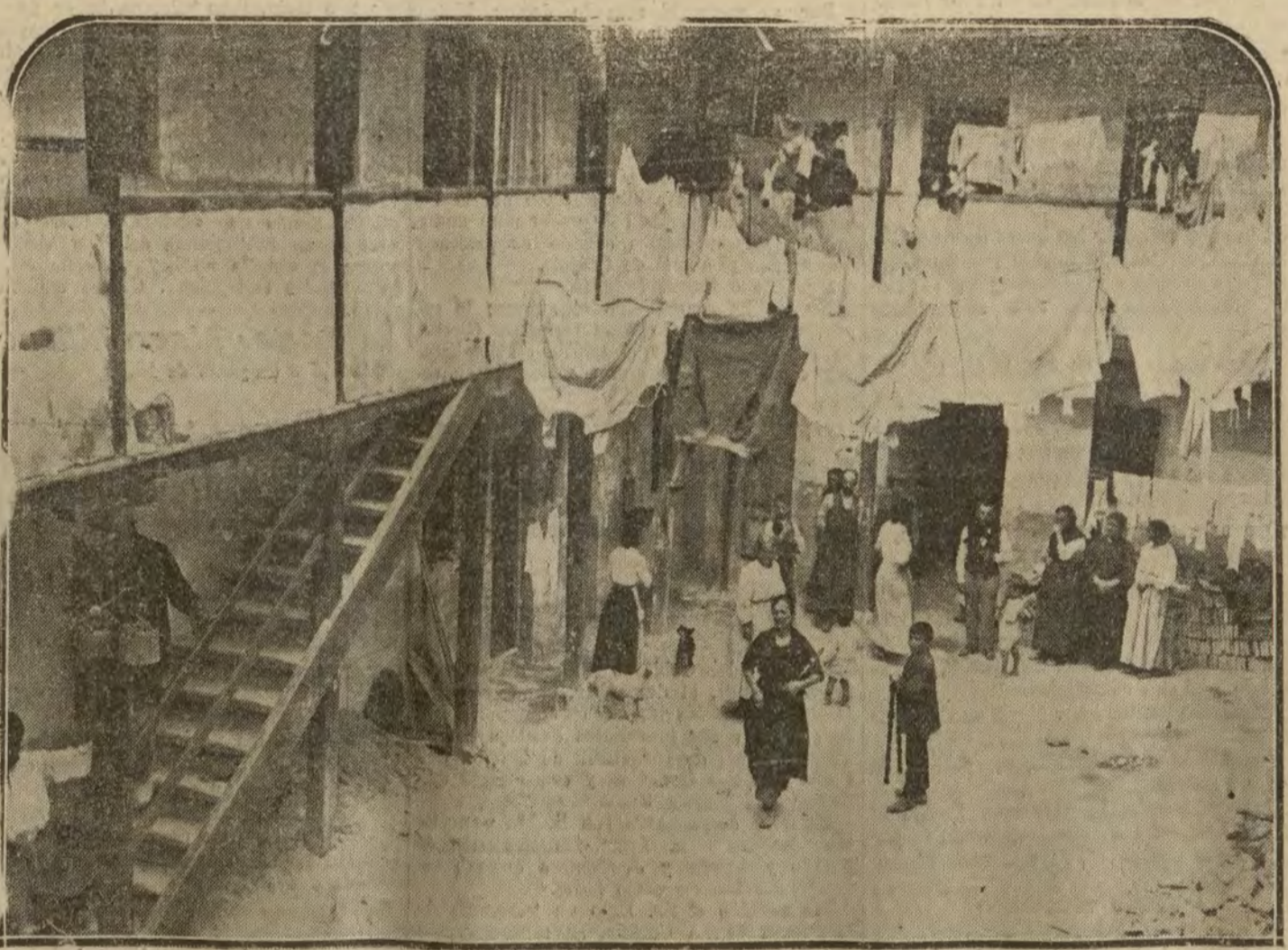
Un patio de sánete en donde la codicia de un casero hace que se represente una tragedia de hambre...