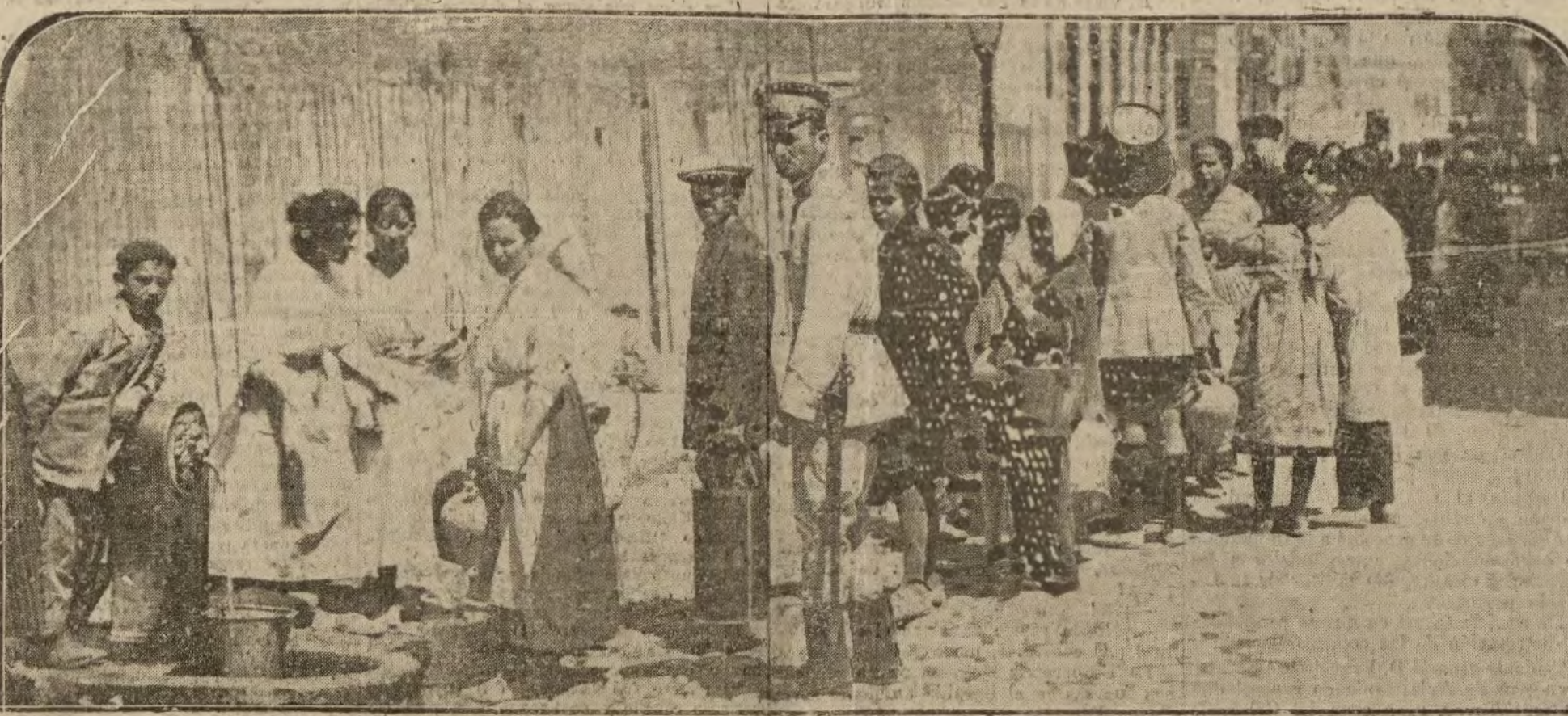
Aspecto que ofreció esta mañana una calle del barrio de Chamberí, debido a la escasez de agua que venimos padeciendo