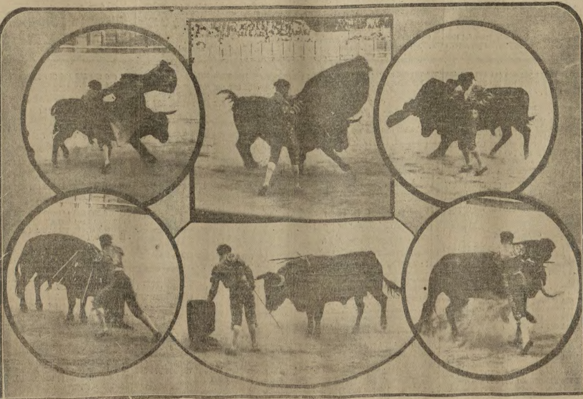
Varios momentos de Belmonte en la corrida de ayer