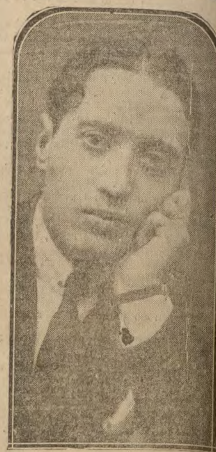
D. Adolfo P. Felsyo, notable pintor que ha inaugurado una brillante Exposición de sus obras en el Ateneo