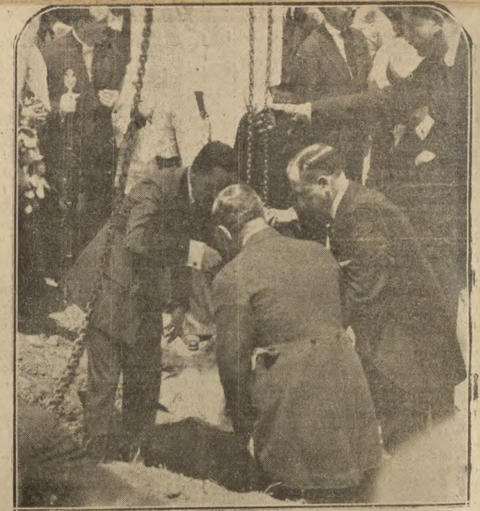
El Rey, echando una paletada de cal sobre la primera piedra para el pabellón de infecciosos del edificio de la Alianza

Hemos oído durante el trayecto innumerales clarines y múltiples aclamaciones de las muchedumbres ingenuas que llenan los andenes.