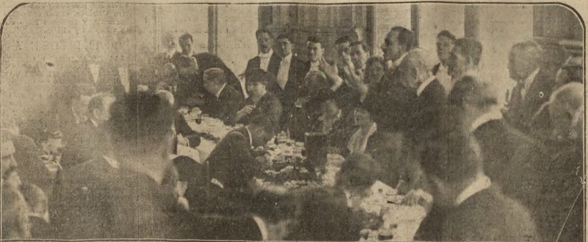
S. M. el Rey pronunciando un discurso a los señores del banquete con que se obsequiaba en el Tibidabo.

Jamás ningún otro Soberano de ninguna otra dinastía tuvo seguramente como más gales ni en medio de clamores más entusiastas un recibimiento que pueda su-