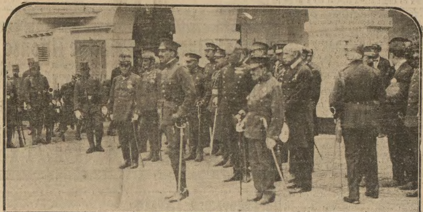
El Rey, acompañado del general Weyler y el presidente del Consejo de Ministros, durante su visita al cuartel de San Fernando, en la Barceloneta.