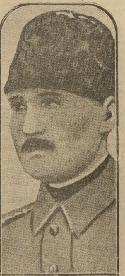
Mustapha Kemal, general en jefe de los contingentes turcos que atacan a los griegos en la región de Tracia