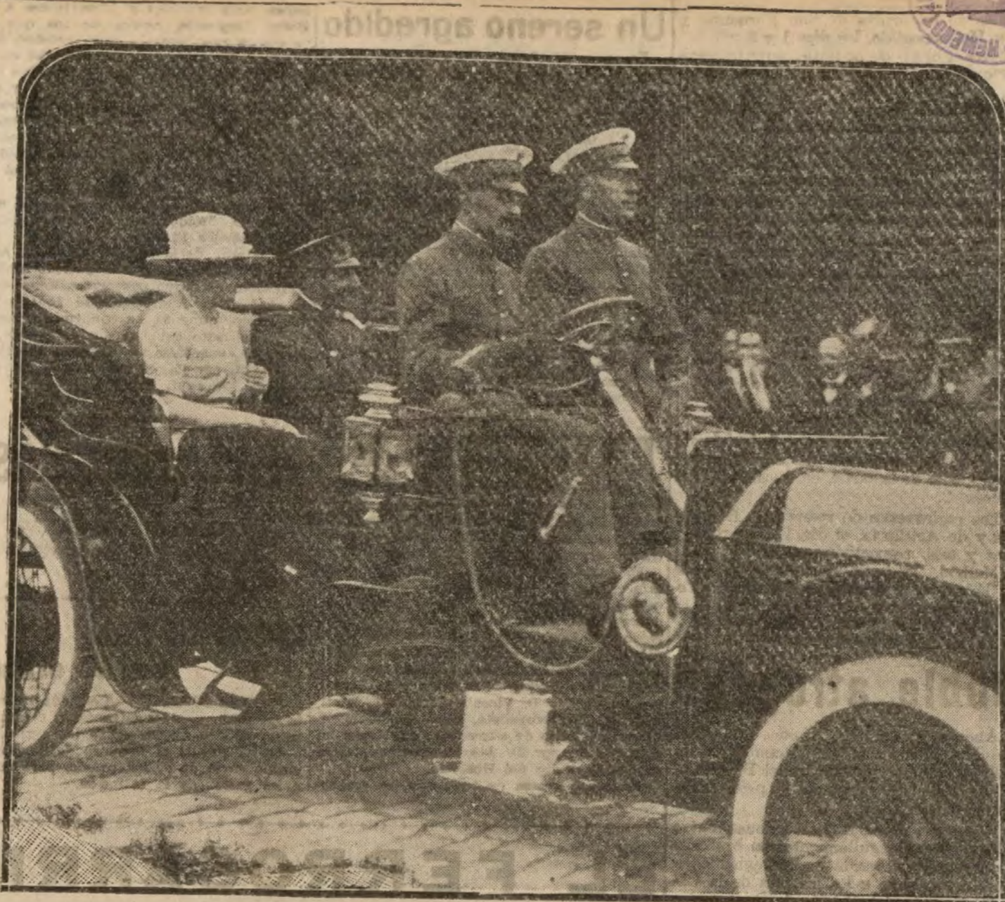
S. M. el Rey, acompañado de su augusta esposa, trasladándose desde la estación a Palacio en automóvil a su regreso de Barcelona