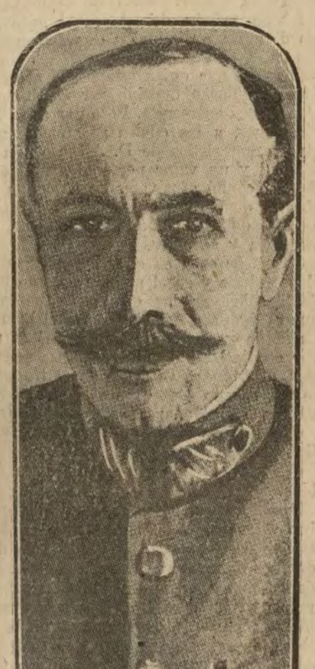
Zymbrakakis, general griego que dirige la ofensiva helénica contra los turcos, ayudados por bandas de búlgaros

Se atribuye a la joya un valor anecdótico no menos interesante que el intrínseco, y entre los snobs del gran mundo y los artistas se relata una historia fantástica, atribuyendo el origen del collar al capricho de un potentado, que, rindiendo un homenaje de admiración a la artista muerta, hizo buscar durante largo tiempo los más bellas ejemplares de perlas para formar el collar; las tres perlas centrales costaron no pocos esfuerzos, y la perla negra que cierra el broche procede de las pesquerías de Ceylán.