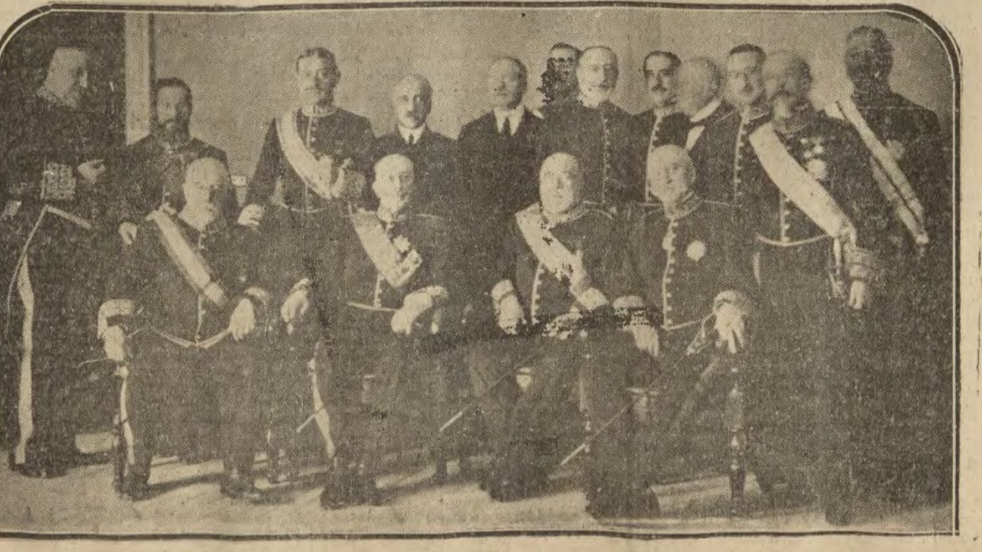
Los nuevos consejeros de Estado, acompañados de los ministros que asistieron a la ceremonia de jura y toma de posesión de sus nuevos cargos

Esta aventura es muy comentada en Estambul y en Pera.