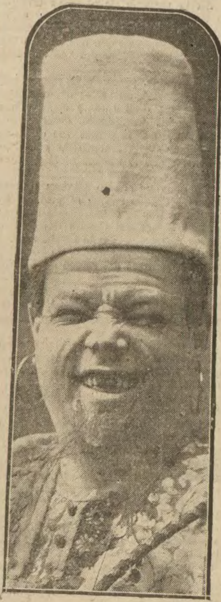
El popular actor Casimiro Ortas que anoche celebró su beneficio en el teatro de Apolo

Rogáramos de nuevo al conde de San Luis para que ponga orden en este marabombismo del Canal. Y hasta que se haya organizado debidamente "se continuará", como en las novelas.