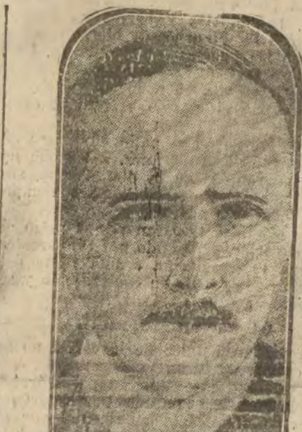
Von Simons, ministro de Estado alemán, que asiste en representación de su Gobierno a la Conferencia de Spa.

—Es exacto... Después fui elegido miembro del Comité director de la Federación industrial prusiana, estudié de