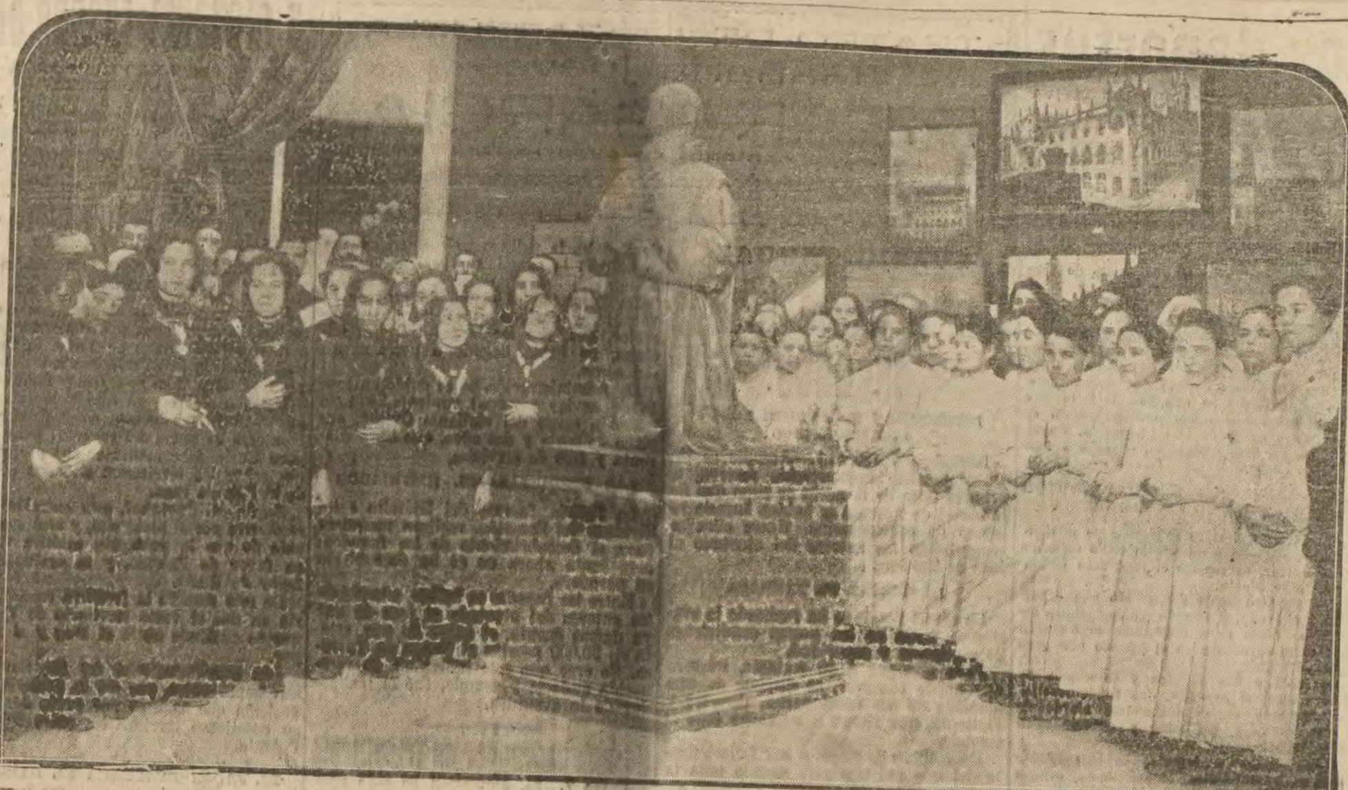
Niñas de los asilos visitando la Exposición de Pintura y Escultura de Bellas Artes

París 6.—El Congreso médico de la Liga de las Sociedades de la Cruz Roja ha comenzado su primera sesión, a la que asistieron delegados de los Estados Unidos, de la Gran Bretaña, Francia, Italia, Japón y Dinamarca.